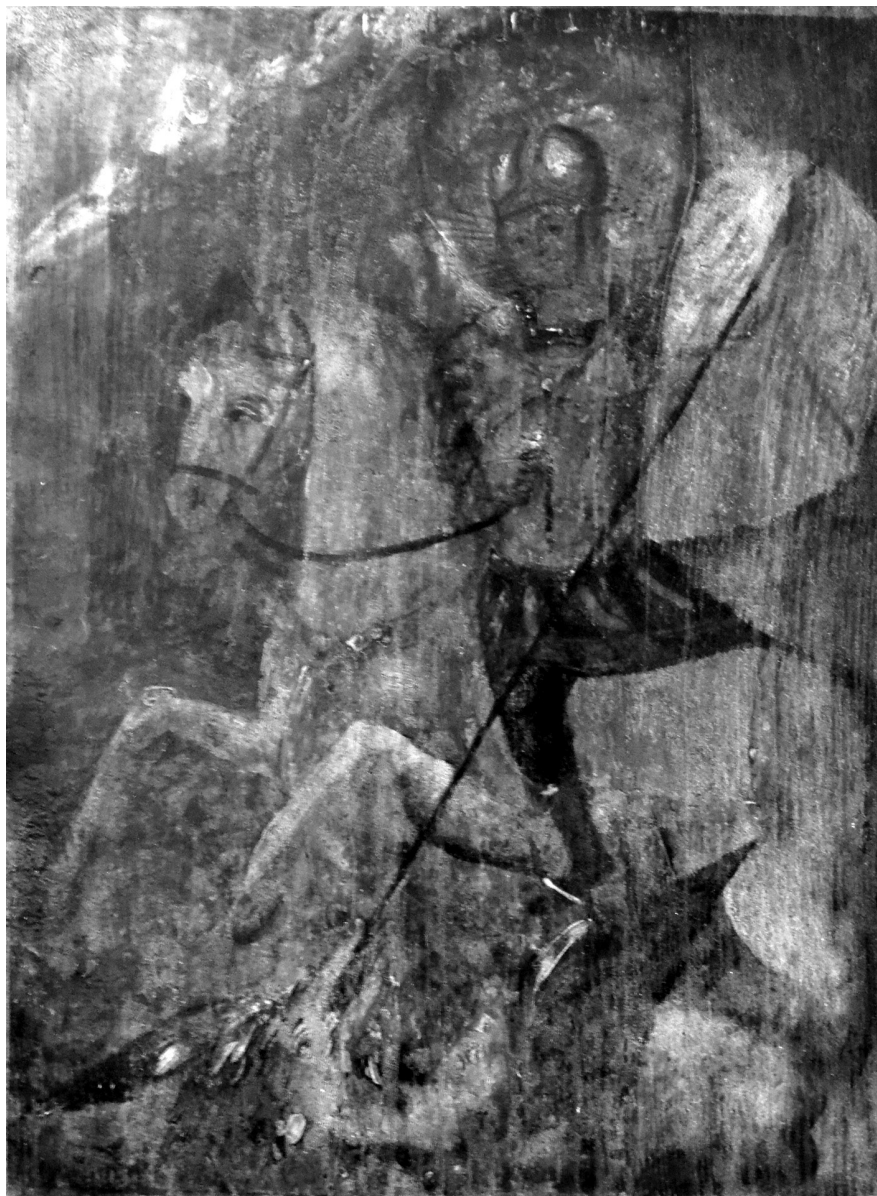
Рис. 7. Ікона «Георгій Змієборець», XVII ст. Дерево, олійні фарби.

11 вересня 2008 р. НІКЗ «Гетьманська столиця» передав до ННДРЦУ на реставрацію п'ять ікон. Дві з них – «Варвара Великомучениця» 4 [4] (рис. 4) та «Миколай Угодник» 5 [5] (рис. 5), які у 1998 р. надійшли від мешканки м. Конотоп Сумської обл. К. Камардіної, були пошкоджені шашелем та мали відшарування фарби. Дві інші ікони – «Хрещення Господнє» 6 [6] (рис. 6) та «Георгій Змієборець» 7 [7] (рис. 7), які передала мешканка м. Батурина Н. Яценко, також мали значні втрати фарби та пошкодження шашелем. Ікона «Святий Преподобний Устиніан» 8 [8] (рис. 8) була придбана у мешканки м. Батурина Н. Чемен зі значними візуальними пошкодженнями. Реставраційно-консерваційні заходи проводили художники-реставратори О. Фролова («Варвара Великомучениця» [17] та «Миколай Угодник» [18]), О. Корнієнко («Святий Преподобний Устиніан» [19]), Л. Когут («Хрещення Господнє» [20]) та В. Миргородський («Георгій Змієборець» [21]). У 2009 р. ці пам'ятки повернулися до фондів заповідника.