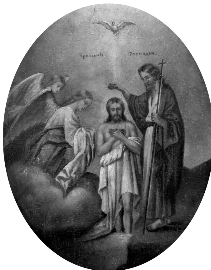
Рис. 6. Ікона «Хрещеніє Господнє», ХІХ ст. Дерево, олійні фарби.