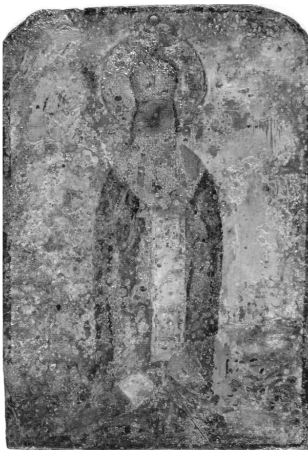
Рис. 9. Ікона «Богородиця з Предстоячими та Святого в повний зріст», кін. XVII ст. Мідь, олія.