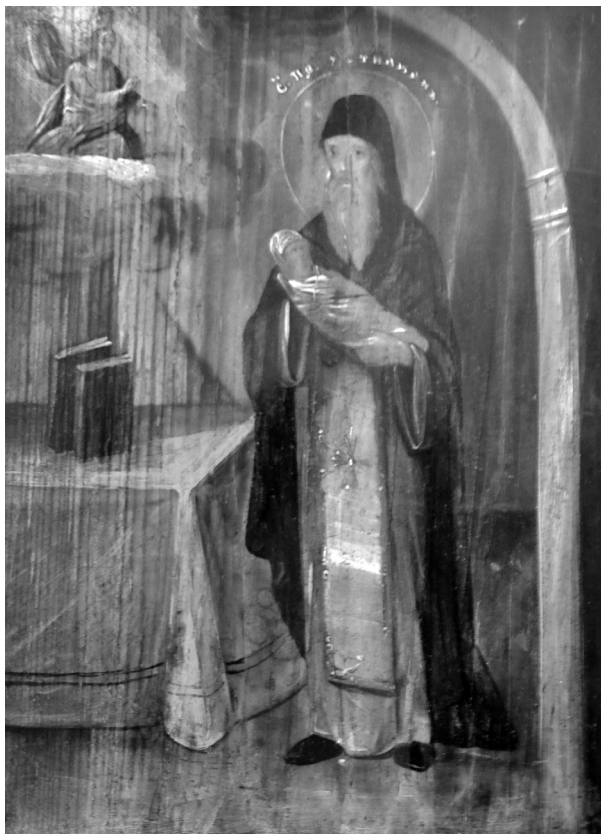
Рис. 8. Ікона «Святий Преподобний Устиніан», кін. XIX ст. Дерево, олійні фарби.