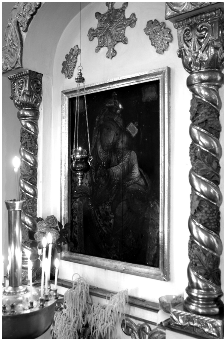
Рис. 11. Ікона «Повчанської Божої Матері». Дерево, олія, скло.

історичну цінність, тому що пов'язана з родиною Розумовських: на початку ХІХ ст. цю ікону передав до церкви-усипальниці син гетьмана К. Розумовського. За візуальним спостереженням можна припустити, що означену ікону реставрували, про що свідчить нерівномірність фарбового покриття і залишки лаку. Робота невмілого маляра, який вимастив білою фарбою дерев'яну основу ікони, псує її зовнішній вигляд. Загрозу для ікони становить виявлені на звороті пошкодження шашелем [12]. На прохання НІКЗ «Гетьманська столиця» про проведення реставраційно-консерваційних заходів церковна громада відповіла відмовою, аргументуючи це тим, що ікону їм більше не повернуть.