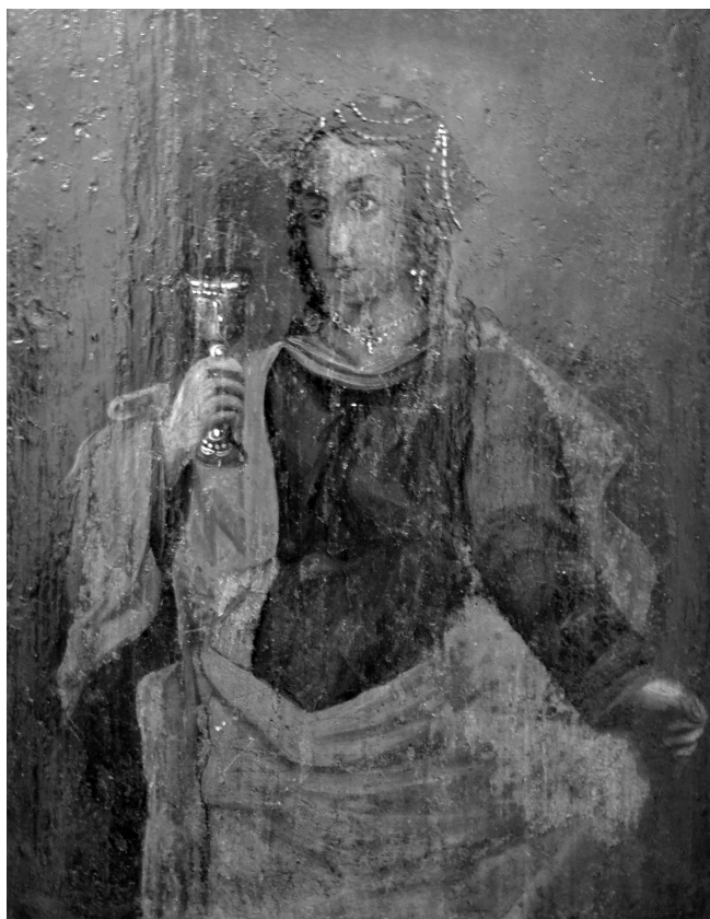
Рис. 4. Ікона «Варвара Великомучениця», кін. XVIII ст. Дерево, темпера.