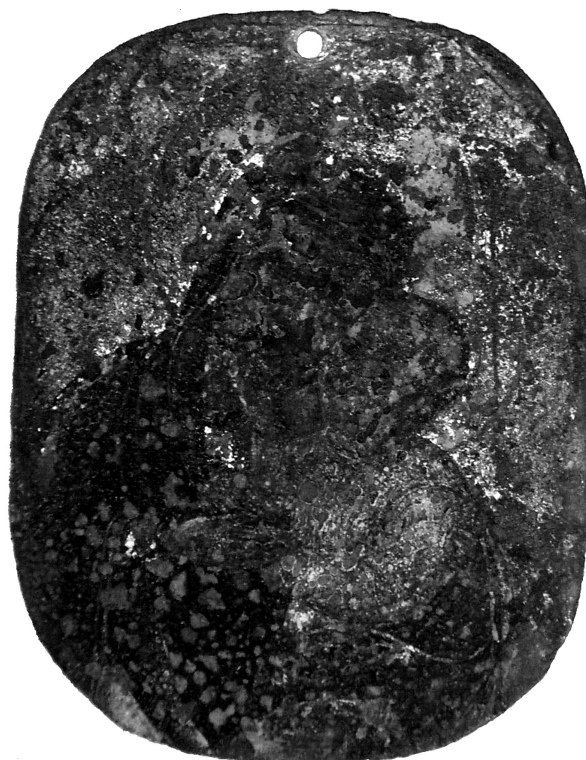
Рис. 3. Ікона «Божа Матір з Немовлям», XVII ст. Мідь, позолота.