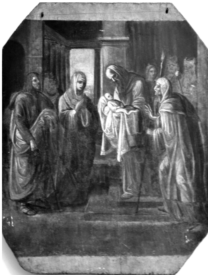
Рис. 2. Ікона «Стрітєння Господнє», XVII ст. Дерево, темпера.