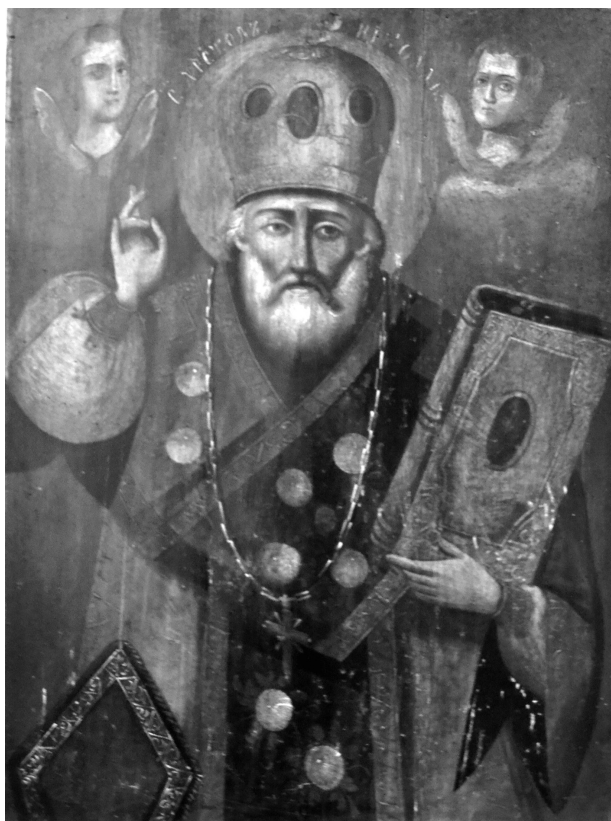
Рис. 5. Ікона «Миколай Угодник», серед. ХІХ ст. Дерево, олійні фарби.