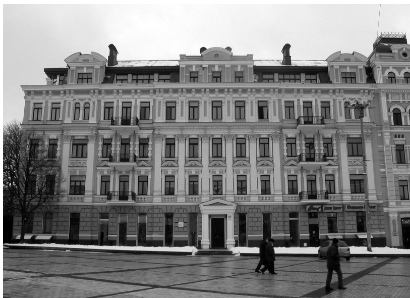
Рис. 4. Будинок по вул. Володимирській, 22, у якому з 1944 р. мешкали видатні українські архітектори. 2009 р.

У Києві зберіглося ще кілька будинків, пов'язаних з П. Альошиним, зокрема, по вул. Софійській, 23, де у 1918-1930 рр. з родиною жив архітектор. Втім, в цьому будинку всі квартири та приміщення зараз перебувають у приватній власності.