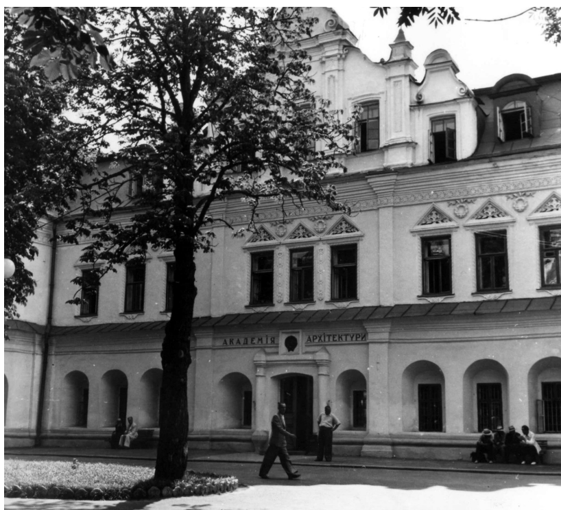
Рис. 1. Будинок митрополитів на території Національного заповідника «Софія Київська». 1955 р.