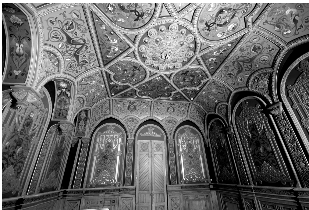
Рис. 10. Кабінет домовласника С. Могилевцева в особняку по вул. Шовковичній, 17/2. 2007 р.

Продовжуючи тему особняків, згадаємо будинок С. Могилевцева на вул. Шовковичній, 17/2 (рис. 9), який після майже 20 років перебування в аварійному стані та незавершеної реставрації 1990-х рр. став філіалом музею Російського мистецтва. Кілька років він функціонував як Дитяча картинна галерея, в ньому проводили виставки, концерти, наукові заходи. В особняку зберіглося первісне оформлення приміщень 2-го поверху, холу 1-го поверху та парадних сходів. Деякі інтер'єри відреставровані; зокрема, живопис у кабінеті у русько-візантійському