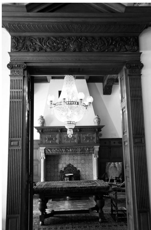
Рис. 6. Фрагмент музейної експозиції будинку Ламберта ван Меертена в м. Дельфт (Нідерланди). 2009 р.