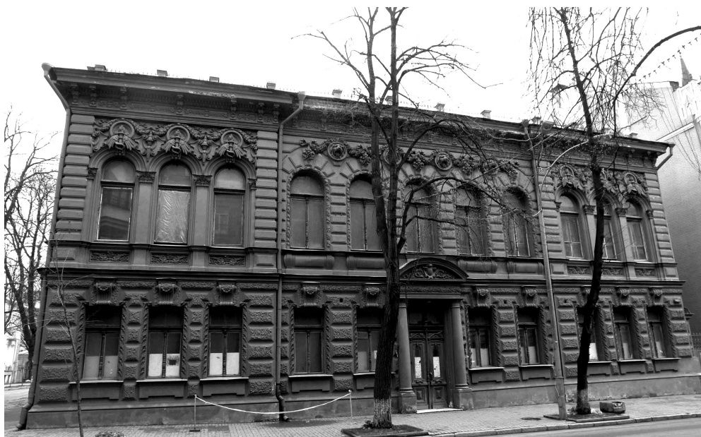
Рис. 9. Музей «Шоколадний будинок» по вул. Шовковичній, 17/2. 2007 р.

бермана (вул. Банкова, 2), де з 1950-х рр. міститься Спілка письменників України, дозволили екскурсійний доступ, відвідувачі заговорили про те, що там слід створити художній музей. Але ж це не єдиний спосіб збереження та демонстрації архітектурних принад.