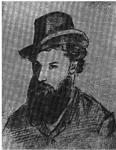
Рис. 1. В. Г. Короленко. Автопортрет, створений під час перебування в Мултані. 1895 р.

У малюнках В. Короленко використовував олівцеві штрихові тіні як для приховування світла, так і для поглиблення контрастності об'єктивних і характерних деталей. Для смислових деталізацій (просвітлення неба, присутність повітря, плинність часу) автор використовував алегорії: світлий трикутник неба, ймовірно, символізує повітря, час і простір як уособлення зіткнення божественного світу з надземним і земним.