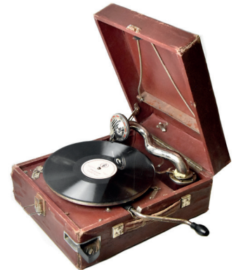
Рис. 7. Грамофон портативний ПТ-3, Завод «Молот», Кіровська обл. м. В'ятські Поляни. 1945–1955 рр. З колекції НМІУ (Р-1338)

Загалом у СРСР у різні часи діяло понад 20 підприємств із випуску патефонів 35 . Однак визначити датування їхньої продукції подекуди непросто через те, що з середини 1930-х і до початку 1960-х рр. вони випускалися майже без змін. Уточнити або й визначити датування музейних предметів, як патефонів так і платівок, може складена на основі різних джерел 36 таблиця № 1. В її основі покладені назви виконавчих органів влади, яким у різні роки підпорядковувалися структури, що відповідали за випуск патефонів і платівок.