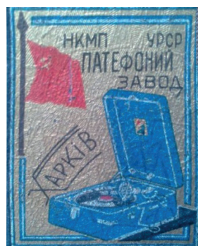
Рис. 10. Логотипи патефонних підприємств УРСР