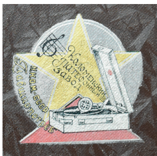
Рис. 8. Грамофон портативний ПТ-3. Коломенський патефонний завод, 1939–1941 рр. З колекції НМІУ (Р-780)

Одночасно з розгортанням патефонних заводів, у 1930-х рр. в СРСР створювалися також нові студії звукозапису та