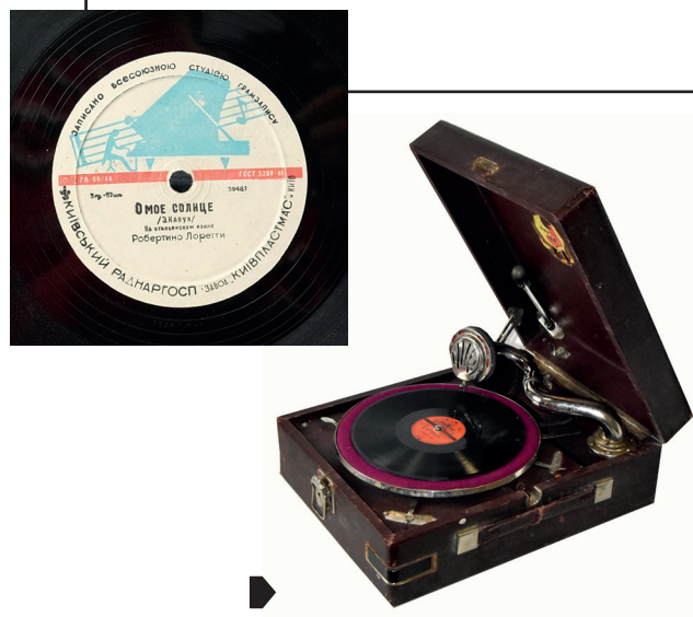
Рис. 13. Грамофон портативний ПТ-3. Артіль «Грамофон», Ленінград, кін. 1930-х рр. З колекції НМІУ (Р-1312)

кові («Грампласт»), Ризі («Bellaccord»), Тбілісі («Грамофон») та інших містах. Як в Україні, так і в інших республіках артілі підпорядковувалися Управлінню промислової кооперації при виконкомах. У колекції НМІУ зберігається один патефон, що був виготовлений на ленінградській артілі «Грамофон» наприкінці 1930-х рр. (Рис. 13)