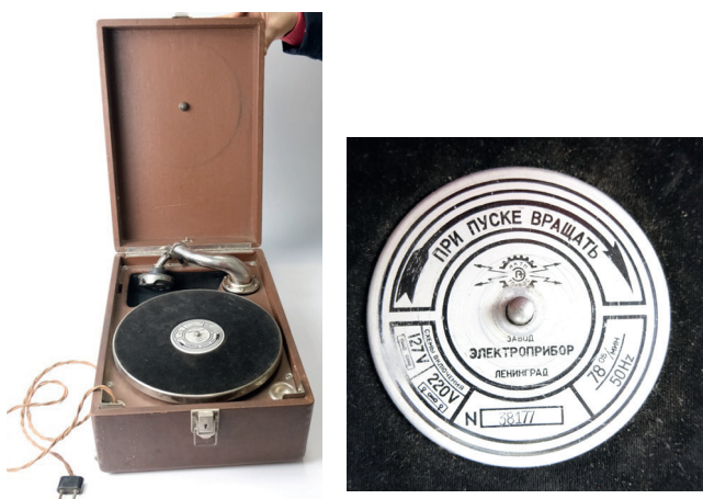
Рис. 14. Патефон електричний. Завод електроприборів», Ленінград, 1934 р. З колекції НМІУ (Р-444)

Періодично з подарованими патефонами в СРСР траплялися казуси і навіть скандали. Так, з 6 тисячі патефонів, відправлених на початку 1934 р. на Донбас для преміювання трудящих, майже 3 тисячі виявилися бракованими. Багато хто з власників патефонів не полінувалися поїхати до Ленінграда, щоб обміняти їх на підприємстві-виробнику. Але зробити це їм не вдалося, оскільки на прохідній Ленінградській грамофонної фабрики висіло оголошення: «Покупців, які приходять із зламаними патефонами, на територію фабрики не пускати» 53 .