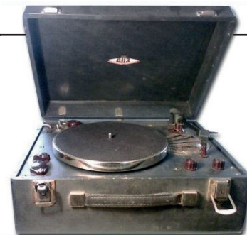
Рис. 9. Грамофон портативний ДПЗ-3. Дніпропетровський патефонний завод, початок 1950-х рр.

на логотипі Харківського патефонного заводу та в каталозі металевих виробів широкого споживання, випущеному у 1940 році Наркоматом місцевої промисловості УРСР 40 . (Рис. 10)