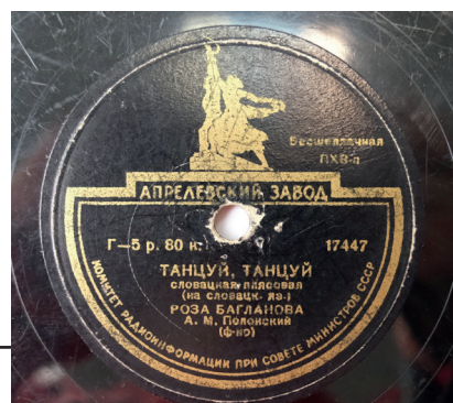
Рис. 11. Грамплатівка безшелачна, Апрелівський завод, 1950–1953 рр. З колекції НМІУ (Р-974)

Після закінчення Другої світової війни в СРСР до згаданих вище підприємств приєдналися також Ташкентський, Тбіліський, Ризький заводи та Експериментальна фабрика грамплатівок