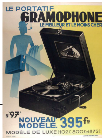
Рис. 6. Грамофон портативний модель HMV-102 (His Master's voice), 1933 р. Рекламний плакат «Портативний грамофон найкращий і найдешевший» HMV-102: нова модель 395 франків, розкішна модель 875 франків. Франція, 1930-ті рр.