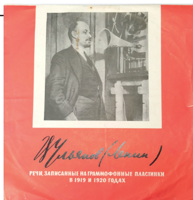
Рис. 2. Платівка «Промови Леніна, записані на грамофонні платівки у 1919–1920 рр.». Запис 1949 року. Всесоюзна фірма грамплатівок «Мелодія», 1968 рік. З колекції НМІУ (Р-368)