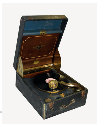
Рис. 5. Грамофон портативний «Columbia Grafonola model 163». США, Нью-Йорк. Компанія Коламбія (Columbia Phonograph Company). 1927–1930 рр. З колекції НМІУ (P-1304)

Ймовірно, саме таким шляхом в Україну потрапив і один з найбільш популярних наприкінці 1920-х рр. портативних грамофонів – «Columbia Grafonola model 163», який нині зберігається в колекції НМІУ. Виготовлений він був американською компанією «Columbia Phonograph Company» у 1927–1930 рр. До музею його передали співробітники Бориспільської митниці на підставі рішення Міжвідомчої ради з питань вивезення, ввезення та повернення культурних цінностей № 3 від 12.01.2010 р. за актом приймання-передавання № 7 від 15.02.2010 р. 23 Незважаючи на поважний вік, даний портативний грамо-