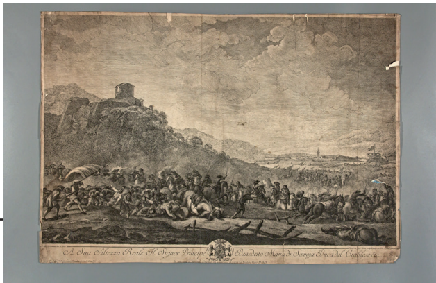
Рис. 9. Теодоро Вьєро. Сцена кавалерійської битви. Італія, Рим, бл. 1766 р. За живописним оригіналом Франческо Сімоніні. Папір, офорт

другу – Боннар Робер (Robert Bonnat) (1652–1733) 43 та, вже згадуваний, Адріан Франсуа Бодюен (Adriaen Frans Boudewijns). Як зазначено на самій гравюрі, фігури виконав Боннар Робер: «R. Bonnat. fig. sculp. et F. Vaudouins sculp.» (Р. Боннар вирізав фігури та Ф. Бодюен вирізав). Облога Лілля, сцену з якої можемо бачити на першому аркуші, відбувалась в період 11–28 серпня 1667 і завершилася взяттям французькими військами під проводом короля Людовіка XIV фламандської фортеці Лілля в Іспанських Нідерландах в ході Деволюційної війни 44 . При атрибуції другої гравюри «Вид на місто і порт Кале з суші» виявилось, що оригінальна назва живописного полотна – «Облога Куртре під час деволоційної війни», що підтверджується опубліко-