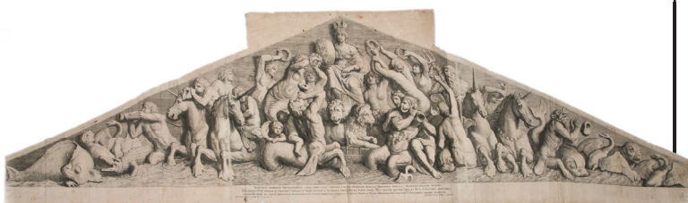
Рис. 2. Губерт Квеллін. Морські боги віддають пошану місту Амстердаму. Нідерланди. 1664 р. За скульптурним оригіналом Артуса Квелліна Старшого 1656–1658 рр. Папір «верже», офорт