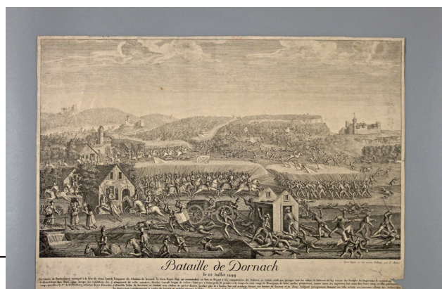
Рис. 6. Лоренц Людвіг Мідар. Битва під Дорнахом 22 липня 1499 року. Швейцарія, м. Берн (?), кін. 18 ст. (1788 р. ?). Папір «верже», офорт, різцева гравюра