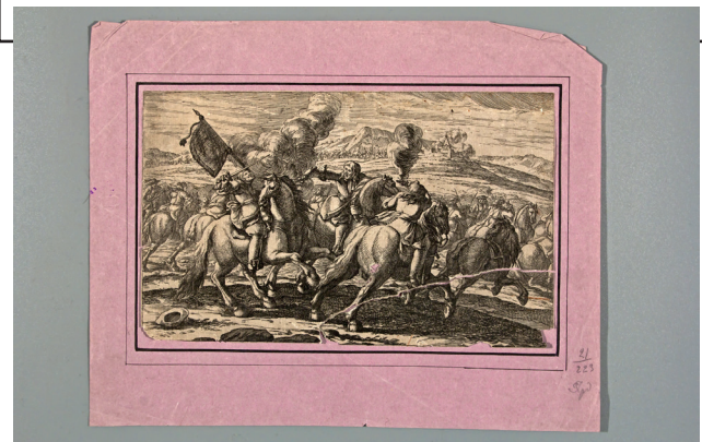
Рис. 4. Антоніо Темпеста (?). Битва вершників біля підніжжя гір. Італія, Рим. Поч. 17 ст. (?). Папір, офорт

ких воєн та ін.) найкращими з них вважаються «Розп'яття» та «Вступ Олександра Македонського до Вавилону». – Темпеста Антонио [Електронний ресурс]: Вікіпедія. – Режим доступу: https://ru.wikipedia.org/wiki/Темпеста,_Антонио (дата звернення 15.05.2023).