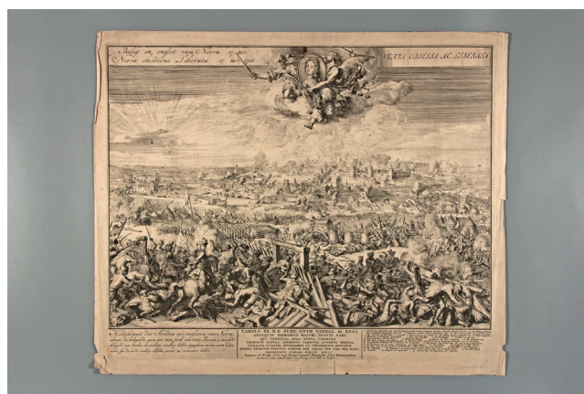
Рис. 11. Ромейн де Хоге. Звільнення Нарви від облоги 27 листопада 1700 р. Голландія, після 1700 р. (до 1708 р.). За оригіналом Петра Шенка Старшого. Папір, офорт

старий інвентарний номер Київського музею революції (1924–1937) «Рев-495», що розташовувався в будинку колишнього Педагогічного музею за адресою вул. Володимирська, 57, а у 1937 р. був переданий під філіал Центрального музею ім. В. І. Леніна. Павла Потоцького заарештували влітку 1938 р., тому достеменно не відомо, коли саме гравюра потрапила до музею революції, до арешту чи після. Що ж до сюжету гравюри, то зображена битва під Нарвою була однією з перших битв Великої Північної війни (1700–1721) між