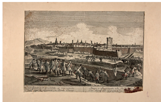
Рис. 10. Пробст Георг Матеус. Облога Барселони (1714). Священна Римська імперія, Аугсбург, бл. 1760 р. Видавець Пробст Георг Бальтазар. Папір, офорт

Створена німецьким гравером Пробстом Георгом Матеусом (Probst Georg Matthaus) (1754–1788) і видана його батьком Пробстом Георгом Бальтазаром (Probst Georg Balthasar) (1732–1801) у Аугсбурзі бл. 1760 р. Облога Барселони (1713–1714) відбувалася в рамках війни за іспанську спадщину