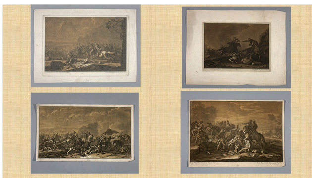
Рис. 7. Христіан Ругендас. Сцени битв. Священна Римська імперія, Аугсбург, 18 ст. (після 1735 р.). За живописним оригіналом Георга Філіпа Ругендаса. Папір «верже», офорт, меццо-тинто, вохриста пластина

Сюжети деволуційної війни 1667–1668 рр. між Францією та Іспанією за