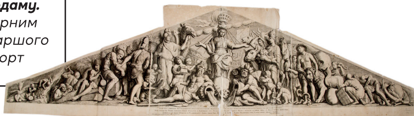
Рис. 1. Губерт Квеллін. Чотири сторони світу підносять дари місту Амстердаму. Нідерланди. 1664 р. За скульптурним оригіналом Артуса Квелліна Старшого 1656–1658 рр. Папір «верже», офорт

На сьогоднішній день найстарішими ідентифікованими та атрибутованими творами з його колекції в збірці НМІУ є гравюри 17 ст. Заслужують на увагу дві гравюри 1664 р., трикутної форми, що відтворюють фронти зі скульптурними групами, що розташовані на колишній ратуші в Амстердамі (нині – Королівський палац) 24 . Алегоричні зображення «Чотири сторони світу підносять дари місту Амстердаму» (ГРЛ-57) (Рис. 1) та «Морські боги віддають пошану місту Амстердаму» (ГРЛ-61) (Рис. 2), створені фламандським гравюром по міді та рисувальником Губертом