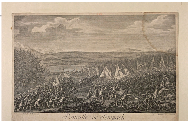
Рис. 5. Лоренц Людвіг Мідар. Битва під Земпахом 9 липня 1386 року. Швейцарія, м. Берн (?), кін. 18 ст. (1788 р. ?). Папір «верже», офорт, різцева гравюра

Наприкінці 18 ст. (1780–1788) швейцарським війнам 14–15 ст. присвятив серію гравюр Лоренц Людвіг Мідар (Midart, Lorenz Ludwig) (1733–1800), швейцарський художник, рисувальник і гравер. Вона нараховувала 6 аркушів: «Битва під Земпахом», «Битва під Дорнахом», «Битва під Муртенном», «Битва під Лаупеном», «Битва під Нефельсом», «Битва під Моргартеном» 34 . Два з цієї серії – «Битва під Земпахом 9 липня 1386 року» (ГРЛ-58) ( Рис. 5 ) та «Битва під Дорнахом 22 липня 1499 року» (ГРЛ-81) ( Рис. 6 ) – зберігаються в НМІУ.