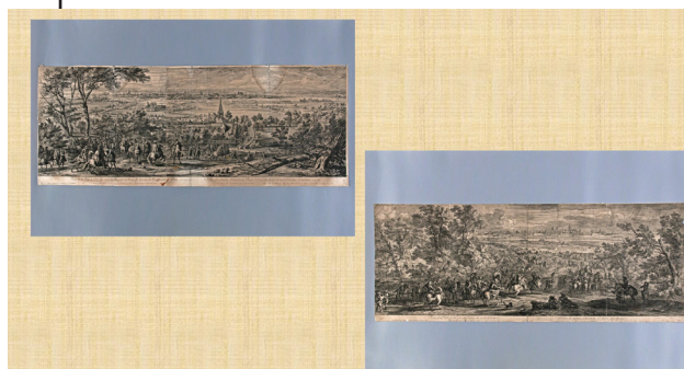
Рис. 8. Ян ван Хуктенбург, Боннар Робер, Адріан Франсуа Бодюен. Вид на місто Ліль з боку пріорату Фівс та королівська армія перед площею у 1667 році. Вид на місто і порт Кале з суші. Франція, м. Париж, 1685 р. За живописним оригіналом Адама Франсуа ван дер Мейлена (1667). Папір, офорт

Походять із серії «Завоювання та битви Людовика XIV» («Conquêtes et batailles de Louis XIV») 40 . Кожна гравюра виконувалася двома художниками-граверами: першу створили Ян ван Хуктенбург (Jan van Huchtenburg) (1647–1733) 41 та Адріан Франсуа Бодюен (Adriaen Frans Boudewijns) (1644–1719) 42 ,