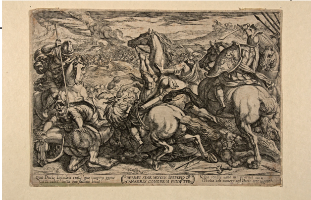
Рис. 3. Антоніо Темпеста. Сцена битви ізраїльтян з хананеями. Італія, Рим. 1613 р. Папір «верже», офорт