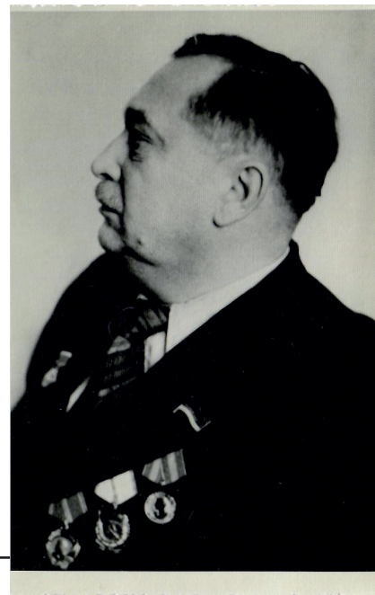
Рис. 1. Володимир Заболотний – видатний український архітектор. Українська РСР, Київ, середина 1950-х рр. Національний музей історії України. – Фонди. – Інв. № Ф-20237 10 .

Ця стаття не ставить за мету представити всю меморіальну спадщину Володимира Заболотного, що входить до