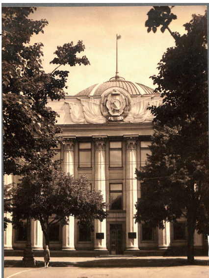
Рис. 5. Будинок Верховної Ради. Головний фасад. Українська РСР, м. Київ, поч. 1940-х рр.

У центрі будівлі над восьмигранним сесійним залом розміщений скляний купол, що забезпечував природне освітлення головного залу. Ззовні будинок витриманий у світлих тонах завдяки застосуванню світлої теразитової штукатурки й світло-сірого кованого турчинського граніту, яким облицьовані стіни цокольного поверху. З цими тонами контрастує темний цоколь, що виконаний із полірованого лабрадориту і має значний виступ відносно площини стін 19 . Велику увагу автор проєкту приділив художньому оформленню інтер'єрів, застосувавши високоякісні штукатурки, ліпний орнамент, штучний мармур, скло, мозаїку, художні вироби з металу, дерева та інших матеріалів.