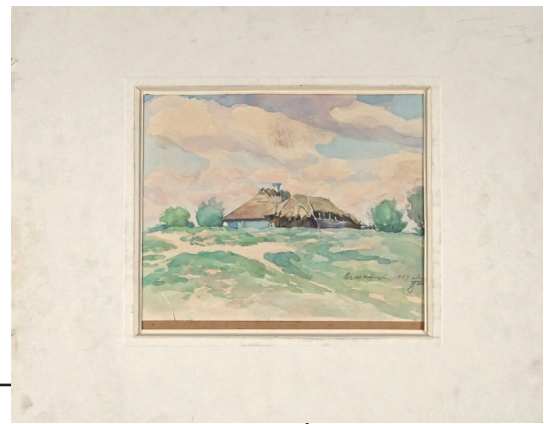
Рис. 7. Малюнок. «В'юнице». В. Заболотний. 1959 р. Папір, акварель