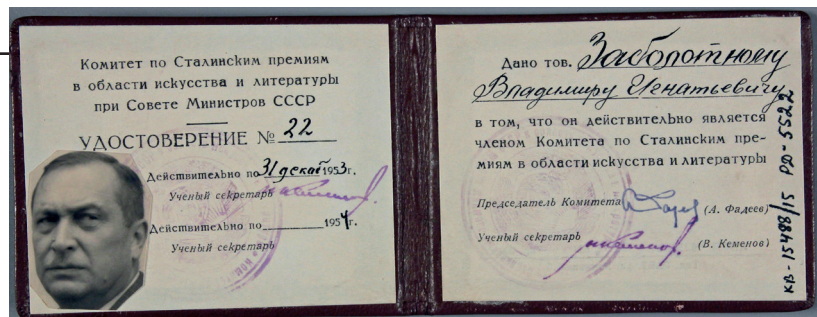
Рис. 4. Посвідчення № 22 члена Комітету з Сталінських премій в галузі мистецтва і літератури Володимира Заболотного. СРСР, Москва, 1953 р.

члена Комітету з Сталінських премій в галузі мистецтва і літератури 13 . (Рис. 4)