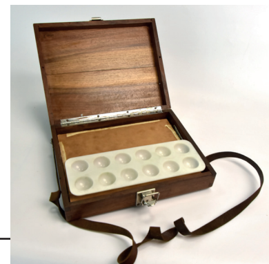
Рис. 11. Етюдник В. Заболотного. 1940-ві рр. 23,5x29,5x7 см