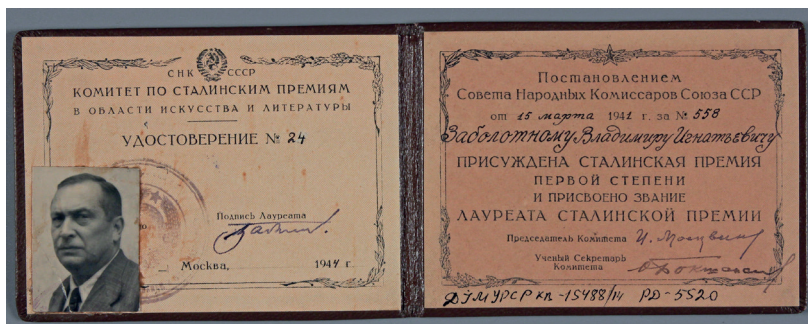
Рис. 3. Посвідчення № 24 лауреата Сталінської премії Володимира Заболотного. СРСР, Москва, 1944 р.

Документ виготовлений на двох аркушах паперу, вклеєних в обкладинку. Текст надрукований шрифтом чорного кольору та доповнений рукописом чорним чорнилом, російською мовою.