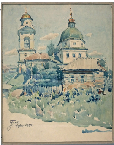
Рис. 8. Малюнок. «Уфа». В. Заболотний. 1942 р. Папір, акварель