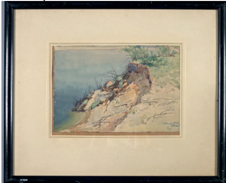
Рис. 6. Малюнок. «На Дніпрі». В. Заболотний. 1954 р. Папір, акварель