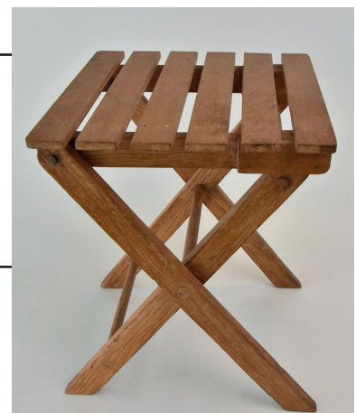
Рис. 12. Стілець похідний дерев'яний В. Заболотного. 1940-ві – 1950-ті рр.