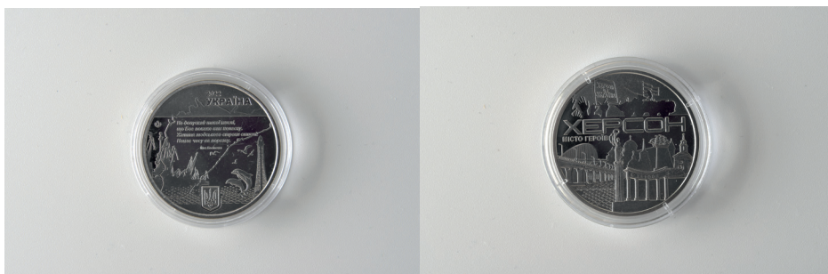
Рис. 2. Медаль пам'ятна «Місто героїв Херсон» (avers, revers)

Кожний художник стає документалістом своїх емоцій, кожна робота – суб'єктивна рефлексія на історичні події, що відбуваються в державі. Але пам'ятні медалі Банкотно-монетного двору України, присвячені війні, об'єднують спільне відображення реальної дійсності, що відчувається майже у фізичному вимірі: наслідки повномасштабного вторгнення РФ, великі трагедії, діапазон почуттів від розгубленості до гніву та рішучості, віра в перемогу.