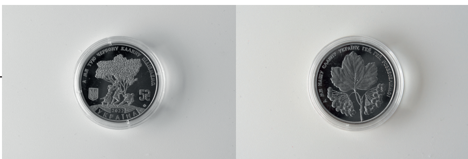
Рис. 1. Монета пам'ятна, 10 гривень «Ой у лузі червона калина» (avers, revers)

Наступна монета «Країна супергероїв. Дякуємо енергетикам!» присвячена героїчній праці українських робіт-