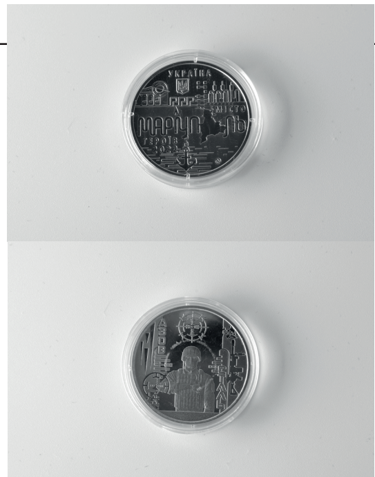
Рис. 3. Медаль пам'ятна «Місто героїв Маріуполь» (avers, revers)