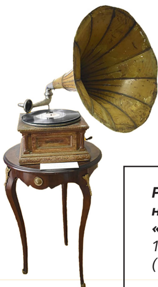
Рис. 3. Грамофон, виготовлений на одному з дочірніх підприємств «The Gramophone Company Ltd». 1900–1911 рр. З колекції НМІУ (ТКВ-11574)

У музеї зберігається грамофон, випущений означеною компанією. Це засвідчує логотип «The monarch Gramophone of London», що міститься з правого боку шухляди, та зображення «Амура, що пише», нанесене як на лівий бік шухляди, так і на рупор. (Рис. 4) Латунна табличка з написом «Кієвскій складъ іздѣлій Акц. Общества Грамофонъ. Кієвъ. Крещатикъ № 19», прикріплена на верхній частині шухляди, вказує на те, що грамофон продали в Києві. Його придбали не раніше 1903 р., оскільки Російське акціонерне товариство «Грамофон» (далі РАТГ), зазначене на пристрої, отримало дозвіл на діяльність в Російській імперії 2 травня 1903 р. та проіснува-