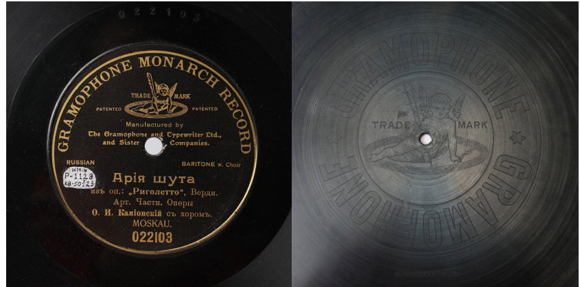
Рис. 6. Платівка із записом арії блазня з опери Дж. Верді «Ріголетто» у виконанні О. Каміюського. 1908 р. Платівка з чорною етикеткою. З колекції НМІУ (P-1128)

них компаній звукозапису дозволяють точніше датувати музейні експонати. Так, платівку ризького заводу, зазначеного на її етикетці, випустили 31 жовтня 1911 р. Тривалість звучання – 3:04, швидкість відтворення: 78 об/хв. (Рис. 5) А платівка із записом арії блазня з опери Дж. Верді «Ріголетто» у виконанні українського оперного співака О. Каміюського – 1908 р. 24 (Рис. 6)