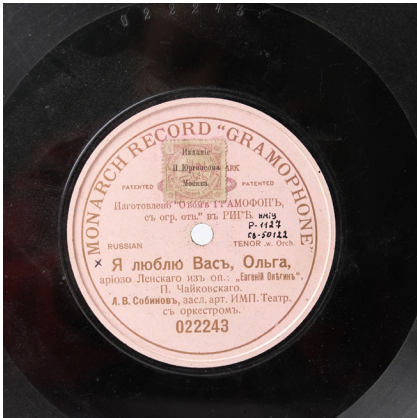
Рис. 5. Платівка із записом аріозо Ленського «Я люблю вас, Ольга» з опери П. Чайковського «Євгеній Онєгін» у виконанні Л. Собінова. 31.10.1911 р. Платівка з рожевою етикеткою. З колекції НМІУ (P-1127)