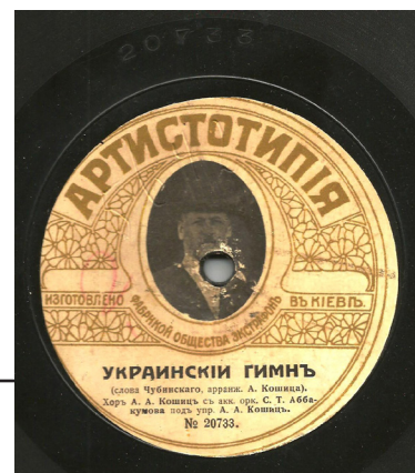
Рис. 9. Платівка з Українським гімном у виконанні хору під управлінням композитора і диригента Олександра Кошиця. Виготовлена на фабриці «Екстрафон», 1917 р.

Зрештою, до нового предмета побуту кияни звикли так, що навіть із початком Першої світової війни (1914–1918) попит на платівки не зменшився. В моду увійшли нові патріотичні пісні й вірші, сатиричні куплети про нім-