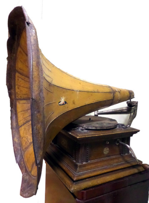
Рис. 4. Грамофон, виготовлений на підприємстві «Амур, що пише». 1903–1917 рр. З колекції НМІУ (Е-2506)