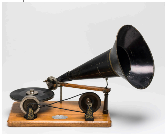
Рис. 2. Грамофон Seven-Inch Hand Gramophone (семидюймовий ручний грамофон) Е. Берлінера. Виготовлений на підприємстві «Berliner Gramophone Co». Філадельфія, Пенсільванія, США. 1893–1896 рр. 11

платівці 14 . Від 1901 р. цей логотип з'явився на всій продукції кампаній Е. Берлінера.