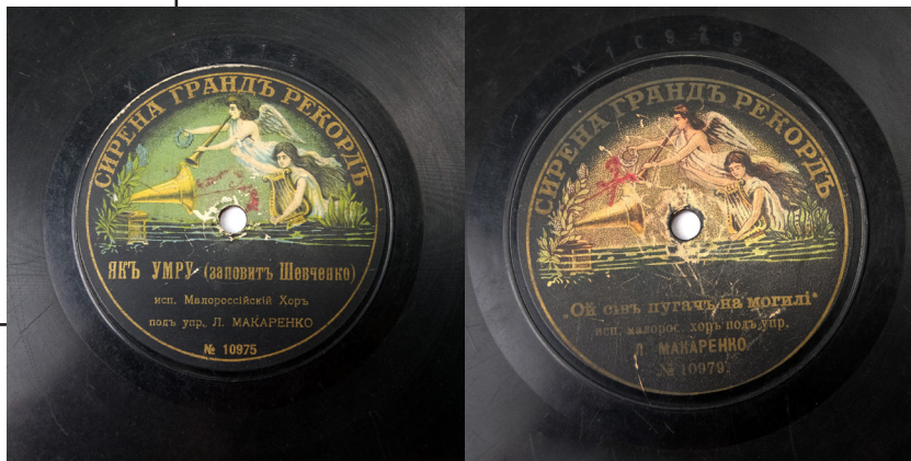
Рис. 7. Платівка із записом «Заповіту» Т. Шевченка та пісні «Ой сів пугач на могилі» у виконанні Малоросійського хору під керівництвом Л. Макаренка. 1911 р. З колекції НМІУ (Р-1360)

1909 р. студію звукозапису заснували й у Києві. Все почалося з того, що керівник берлінської фірми «Інтернаціональ Екстра Рекорд» Ернст Гессе запропонував київському купцю чеського походження Генріху Ігнатію Інджишеку 29 , який із 1882 р. торгував у місті музичними інструментами, стати його компаньйоном. Як людина передових поглядів Г. Інджишек зважився на розміщення в одній із кімнат свого магазину на вул. Хрещатик, 41 обладнання для звукозапису. Його закупили в Німеччині, це обладнання було