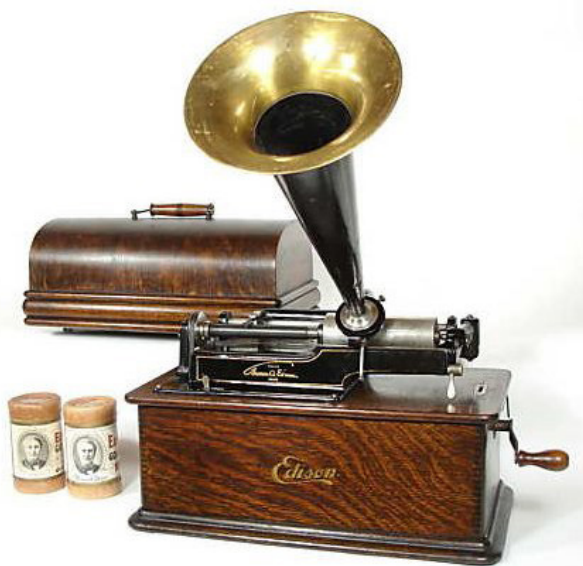
Рис. 1. Фонограф Томаса Едісона 2

Мета статті. Базуючись на зразках грамофонів і платівок, що зберігаються у фондах Національного музею історії України (НМІУ), поглибити цю тему та розглянути її у вимірі історії повсякдення населення Києва початку 20 ст.