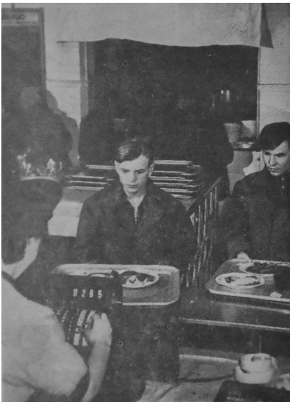
Рис. 1. Потоковий метод обслуговування в їдальні № 9. Світлина зі стінгазети «Азовсталь»

У період, що досліджується, на «Азовсталі» діяла овочева база. З бун-