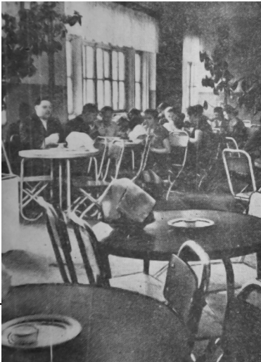
Рис. 5. Їдальня мартенівського цеху.