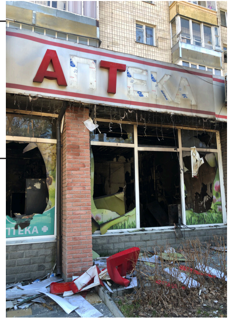
Рис. 7. Знищена аптека в м. Бучі

рожу колону артилеристи 43-ї окремої артилерійської бригади імені гетьмана Тараса Трясила 27 лютого 2022 р. 14 Окремі будівлі по вул. Вокзальній було повністю зруйновано прямими влучаннями, інші залишилися майже неушкодженими. Здивувала велика кількість чобіт російських окупантів, розкиданих вулицею. Місцеві мешканці подарували музею сухпайки російської армії. У вересні 2022 р. А. Богдалов презентував один із них у Дрездені заступниці директора з науки, завідувачці відділу музейної справи Військово-історичного музею – Кристяні Янеке. Цей сухпай став частиною колекції означеного музею.