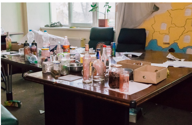
Рис. 12. Одна із залишених російськими окупантами позицій у Димері

Окремим видом проведення дозвілля для російських солдатів було «художнє оформлення» дверей. Майже кожні двері в гуртожитку підприєм-