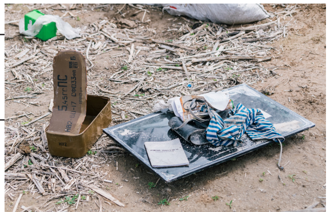
Рис. 13. Безлад, який залишили після себе окупанти