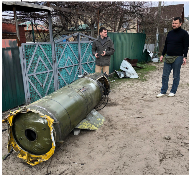
Рис. 9. Учасники експедиції НМІУ біля решток ракети в с. Козаровичах

У Димері в приміщенні селищної ради завдяки Андрієві Дзюбі учасники експедиції зустрілись із селищним го-