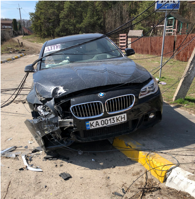
Рис. 3. Понівечений автомобіль у Ірпені (Фото авторів)

вигляд. На в'їзді до м. Ірпеня асфальт було посічено осколками від мін і снарядів, все частіше траплялися виведені з ладу автомобілі, як-от «БМВ» із написом «ДІТИ» біля магазину по вул. О. Кошового, 33. (Рис. 3)