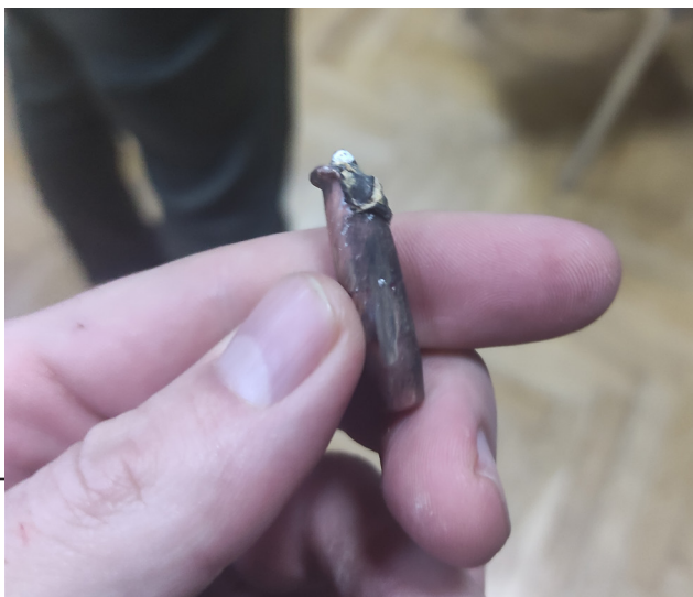
Рис. 1. Куля, знайдена в залі № 8 6

Попри те, що перелічені міста розташовані поруч із Києвом, виявилось, що дістатися туди непросто. Прямі дороги до Ірпеня та Гостомеля було перекрито, мости через р. Ірпінь, зокрема й на Житомирській трасі, – зруйновано, тому довелося робити великий гак через Білогірродку, що перетворилось у тригодинний рух суцільними автомобільними заторами. Шляхи були запружені військовою технікою та приватним транспортом мешканців звільнених від окупації населених пунктів, які поверталися з евакуації. Перші помітні сліди боїв траплялися вже в с. Гореничах, що на південь від Житомирської траси. У с. Стоянці (північніше Житомирської траси) руйнування мали суттєвіший