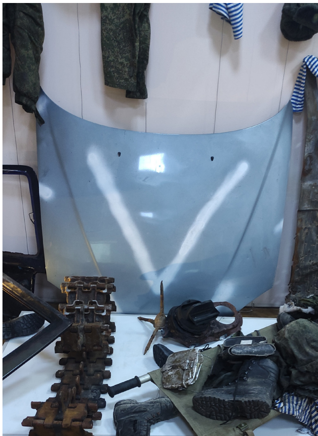
Рис. 18. Капот від автомобіля «Део Ланос» із м. Ірпеня в експозиції виставки «Навала. Київський постріл»