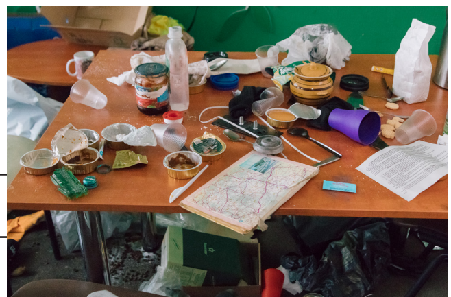
Рис. 25.

Символом та центральним експонатом виставки «Навала. Київський постріл» став предмет, зображений на давньому гербі Києва, – арбалет, що означав готовність киян чинити збройний опір і захищати місто. Як і упродовж сотень років, Київ протистояв величезній ворожій навалі. Цього разу столиця встояла завдяки мужності та єдності захисників і захисниць та жертвності мешканців Київщини. Півколом у виставковій залі розташовані інсталяції, що імітують захоплені й понівечені будинки Київщини, у прозорих кубках «будинків» розміщені експонати, пов'язані з російськими окупантами: трофейні речі, передані до музею українськими військовими, документи російських офіцерів, надані фондом Сергія Припути, матеріали, зібрані під час музейної експедиції. Речі мирних мешканців і експонати, які ілюструють злочини російських загарбників, представлені в центрі зали. Привертають увагу пам'ятні таблички воїнам АТО з Алеї Героїв Приірпіння. Ці предмети були демонстративно розстріляні окупантами. Серед експонатів у центрі зали вражають