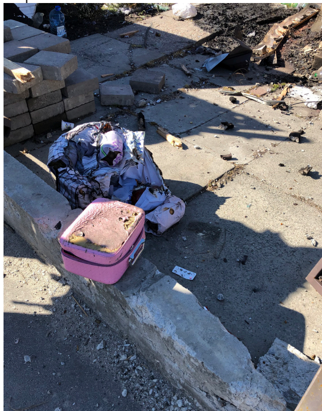
Рис. 6. Покинута тривожна валізка на вул. Соборній

громлену російську БМД. Відібрали як майбутні музейні предмети обгорілий російський кевларовий шолом, тактичні окуляри, оптичні пристрої та частини БМД за № 30, зокрема фрагмент гусениці.