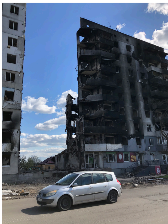
Рис. 20. Один зі зруйнованих будинків у Бородянці

Музейників вразила велика кількість цивільних авто на звалищі. Більшість машин мали отвори від куль, що свідчить про навмисні вбивства цивільних окупантами. Деякі автомобілі були розчавлені бронетехнікою росіян. Музейна колекція поповнилася капотом від знищеного авто «Део Ланос», привласненого окупантами, з літерою «V». (Рис. 18)