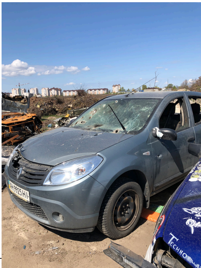
Рис. 19. Одна з розстріляних окупантами автівок на звалищі у Бучі