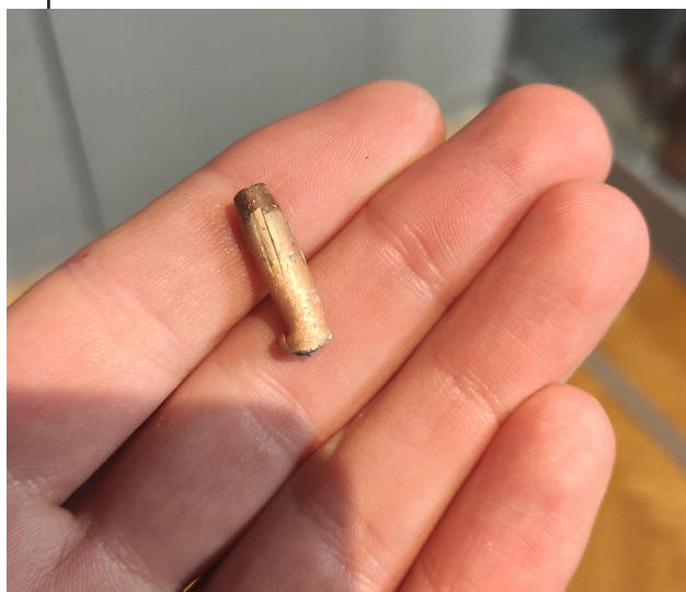
Рис. 2. Куля, знайдена в залі № 22 7