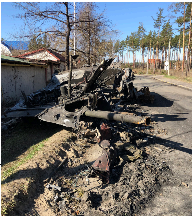
Рис. 4. Знищена російська БМД-4

Пізніше з'ясувалося, що до знищення цієї машини був причетний колишній народний депутат України Володимир