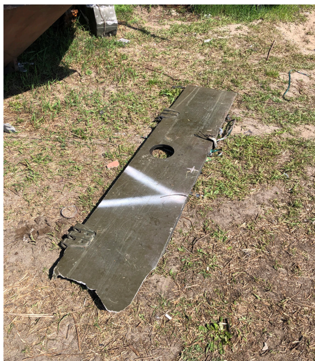
Рис. 17. Фрагмент російської бронетехніки з літерою «V»

У Бучі спалену російську бронетехніку з вул. Вокзальної вже вивезли на звалище. Перед експедицією стояло завдання – знайти елемент російської бронетехніки з маркуванням «V». На звалищі було виявлено такий фрагмент. (Рис. 17)