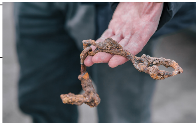
Рис. 14. Кінські вудила 16–17 ст., виявлені в одному з окопів окупантів

На зворотному шляху до музею було демонтовано пошкоджену табличку з дамби в с. Козаровичах, підірив якої врятував Київ. (Рис. 15)