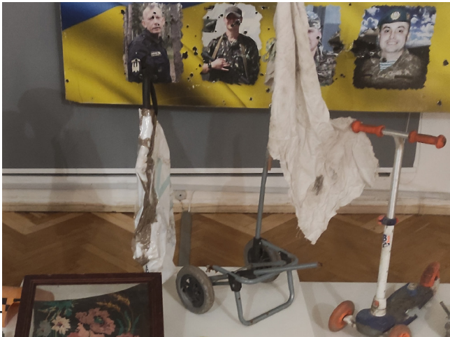
Рис. 16. Саморобні прапори з-під мосту через р. Ірпінь у експозиції виставки «Навала. Київський постріл»