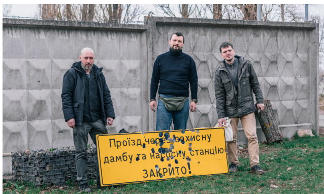
Рис. 15. Табличка з дамби в с. Козаровичах