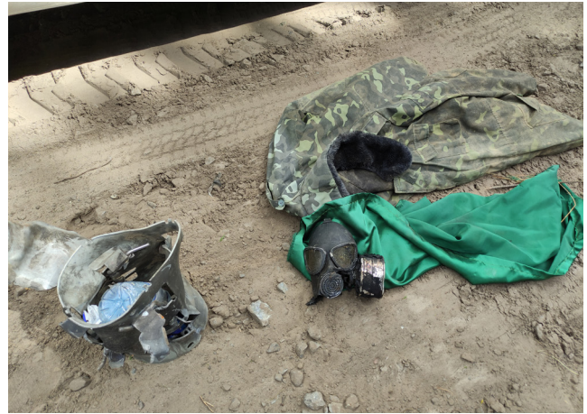
Рис. 21, 22. Позиції кадирівців біля с. Берестянки

У Бородянці експедиція обстежила дитячий садок, де базувався російський окупаційний штаб. Тут музейники вилучили дерев'яну конструкцію з позначенням сторін світу, призначення якої спочатку встановити не вдалося. Згодом під час однієї з екскурсій виставкою українські військові розповіли, що такі позначення на різних поверхнях окупанти робили для орієнтування на місцевості. Російські військовослужбовці не використовують систему глобального позиціонування GPS, а російська система ГЛОНАСС має проблеми з точністю визначення координат та періодичні