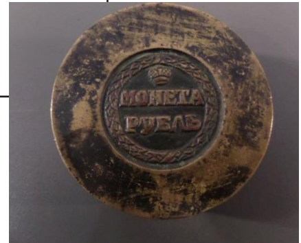
Рис. 3. «Сестрорецький» рубль із нумізматичної колекції Харківського історичного музею імені М. Ф. Сумцова. Гурт