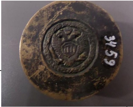
Рис. 1. «Сестрорецький» рубль із нумізматичної колекції Харківського історичного музею імені М. Ф. Сумцова. Аверс