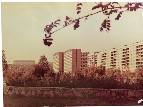
Рис. 5. Зальний вигляд житлового масиву Перемога. Дніпропетровськ, УРСР. 1983 р.