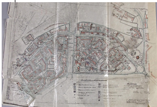
Рис. 4. Схема житлового масиву Перемога м. Дніпропетровська. Автори проєкту – Оскар Хавкін, Павло Нірінберг, Євген Яшунський та ін.

го обслуговування житлового масиву Перемога» (автори проєкту – О. Хавкін, П. Нірінберг, Є. Яшунський та ін. 20 ); «Схема житлового масиву Перемога» (автори проєкту – О. Хавкін, П. Нірінберг, Є. Яшунський та ін.) 21 ; робочий ескіз одного із фрагментів забудови та благоустрою прибережної зони, прилеглої до масиву Перемога (автор – О. Хавкін) 22 . Щоб уявити надзвичайний об'єм роботи, яку виконав колектив архітекторів під час проєктування масиву Перемога, розглянемо детальніше один із означених проєктів. На кресленику «Схема житлового масиву Перемога» (Рис. 4) майбутній житловий масив має вигляд сегмента, розділеного на дві частини бульваром Слави та обмеженого проспектом Героїв і набережною Перемоги (тут і надалі вживатимуться топонімічні назви, зазначені у креслениках).