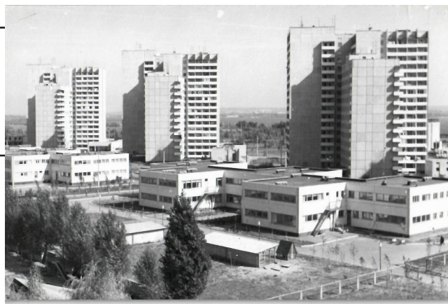
Рис. 6. Великопанельні житлові будинки масиву Перемога. Дніпропетровськ, УРСР. 1982 р.