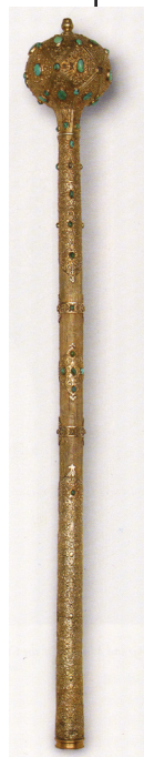
Рис. 3. Булава польського короля Стефана Баторія

щих державних та військових діячів Речі Посполитої 16–17 ст., зокрема польському королю Стефану Баторію ( Рис. 3 ) 12 , Великому Коронному Гетьману Яну Собеському ( Рис. 4 ) 13 , Великому Коронному Гетьману Станіславу Яну Яблоновському ( Рис. 5 ) 14 .