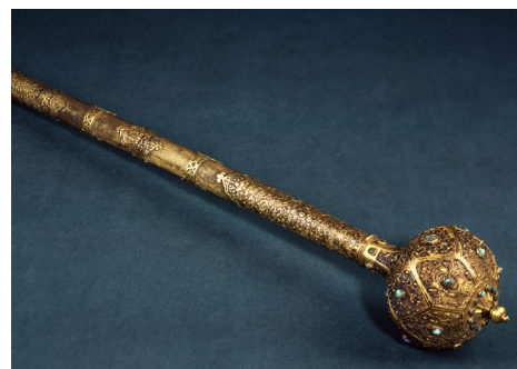
Рис. 4. Булава Великого Коронного Гетьмана Яна Собеського