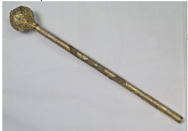
Рис. 2. Булава (інв. № 3-1647) після реставрації

Процес реставрації булави задокументовано у класичному підручнику «Реставрація творів з металу» 8 . (Рис. 1а, Рис. 1б)