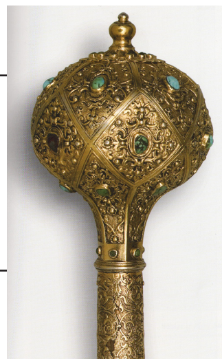
Рис. 5. Булава Великого Коронного Гетьмана Яна Станіслава Яблоновського