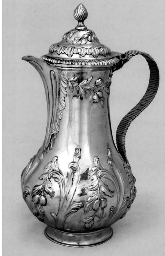
Рис. 2. Кавник. Велика Британія, ХІХ ст. РДМ-1342.

Прикрашений карбованим рослинним орнаментом кавник (ХП-301), що має кілька англійських та російських клейм, має сучасний інв. № РДМ-1342 (рис. 2).