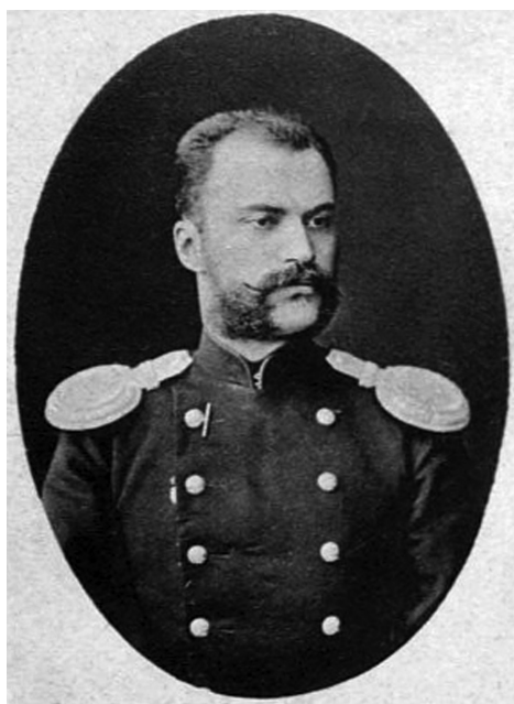
Рис. 5. Портрет Д. С. Федорова

Перші відомості про нього ми отримали з інтернет-ресурсів: «Федоров Дмитрий Сергеевич (1855–?), из московских дворян, сын действительного статского советника Сергея Петровича Федорова и Екатерины Александровны, урожд. Быковой, корнет Кавалергардского полка (1875), поручик (1879), в 1885 г. – ротмистр, в 1889 г. – надворный советник, чиновник особых поручений при киевском генерал-губернаторе, в 1890 г. – камер-юнкер, в 1891 г. – волынский вице-губернатор, в 1894 г. – камергер, киевский вице-губернатор и почетный гражданин Житомира; в 1896 г. – причислен к Министерству внутренних дел, в 1906 г. – действительный статский советник. Сослуживец М.М. Осоргина по Кавалергардскому полку, друг Я. Г. Жилинского и А. А. Киреева» [3] (рис. 5).