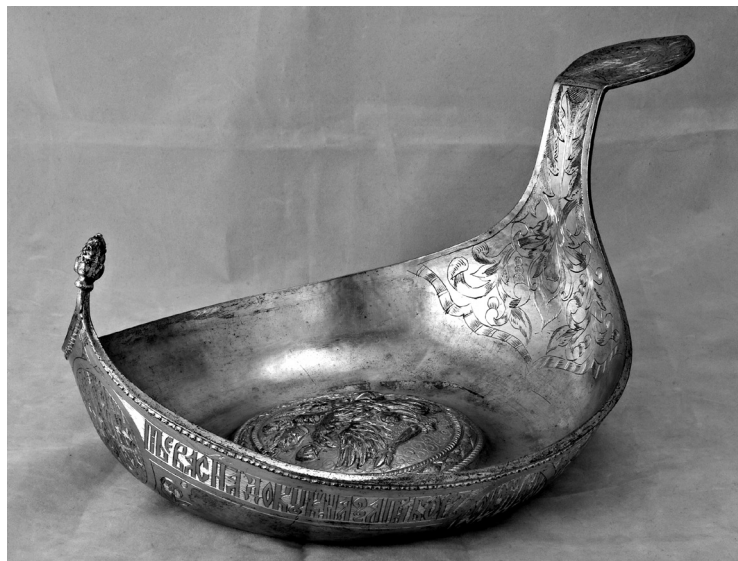
Рис. 3. Ківш жалуваний. Російська імперія. РДМ-923.

Слід згадати ще чотири срібні жалувані ковші (РДМ-923, 964, 966, 967), що відповідно мають номери КХПНМ: ХП-317, 311, 313, 315 (рис. 3, 4).