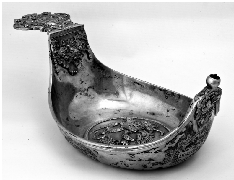
Рис. 4. Ківш жалуваний. Російська імперія. РДМ-966.

Отже, в колекції дорогоцінних металів НМІУ зберігається 9 предметів з шифром «ХП», в 1909 р. записаних до інвентарної книги КХПНМ як такі, що надійшли «...по духовному заповіщанню Д. С. Федорова» [2]. З колекції Д. С. Федорова, певно, походять ще кілька предметів з зібрання НМІУ. Тому логічним було знайти відповідь на питання: хто ж цей чоловік?