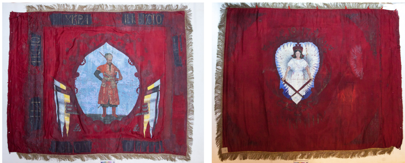
Рис. 1. Прапор Українського Запорізького полку. 1917 р.

У контексті нашого дослідження це зображення викликає підвищений інтерес, бо саме його ми можемо побачити на представленому у рамках виставкового проєкту «Народжена волею, стверджувана зброєю!» в НМІУ прапорі Українського Запорізького полку. На лицьовому боці прапора зображено козака у картуші з блакитно-жовтими знаменами по боках, а на зворотному – вищезгаданий сюжет із архистратигом Михаїлом 13 . (Рис. 1) Предмет відображає той етап Української Революції, який можна, вдавшись до певного метафоричного спрощення, назвати «романтичним». Саме в цей час у складі колишньої імператорської армії відбувається створення національних військових частин, зокрема й українських.