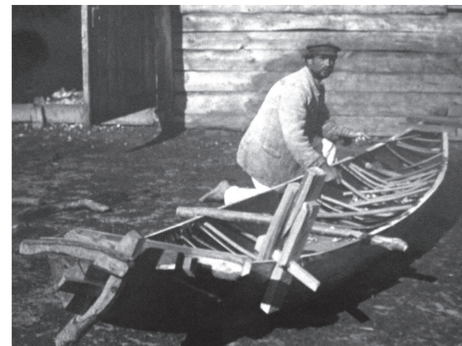
Рис. 14. ««Розвернений човен» (у середині багато встав- лено «цурок», а на боці та носі причеплені «лисиці»), с. Старосілля, Жукинська волость, Остерський повіт, Чернігівщина, 1922 р.»

11. «Розвернений човен» (усередині вставлено багато «цурок», а на боці та носі причеплені «лисиці»). (Рис. 14) 88