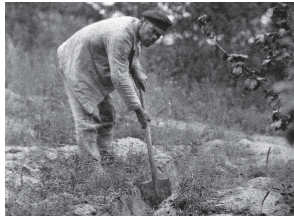
Рис. 9. Фото Д. Демуцького «Викопування рівчака для розкладання во- гнища, с. Старосілля, Жукинська волость, Остерський повіт, Чернігівщина, 1922 р.» (АНФРФ ІМФЕ)