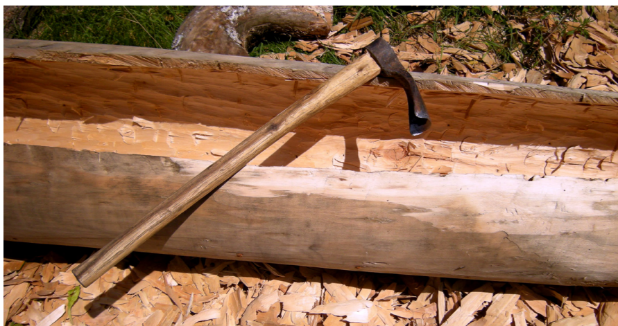
Рис. 2. «Копил, який лежить на заготовці, с. Мньов, Чернігівський р-н, Чернігівська обл., 2010 р.»

Перевернувши заготовку (верхом догори), майстер притискав одним коліном або сідав на неї і, тримаючи обома руками копил ( Рис. 2 ), починав видовбувати середину («борт»). Роботу розпочинали з носа, видовбуючи вузько і поступово щораз ширше. Цей етап виробництва іменується «борткуванням» 47 . Під час довбання на носа і корму накладали спеціальні планки («лисиці»), які запобігали розколу 48 . На поч. ХХІ ст. замість «лисиць» використовують смолу (обмащують носа і корму, а потім їх накривають тканиною) 49 .