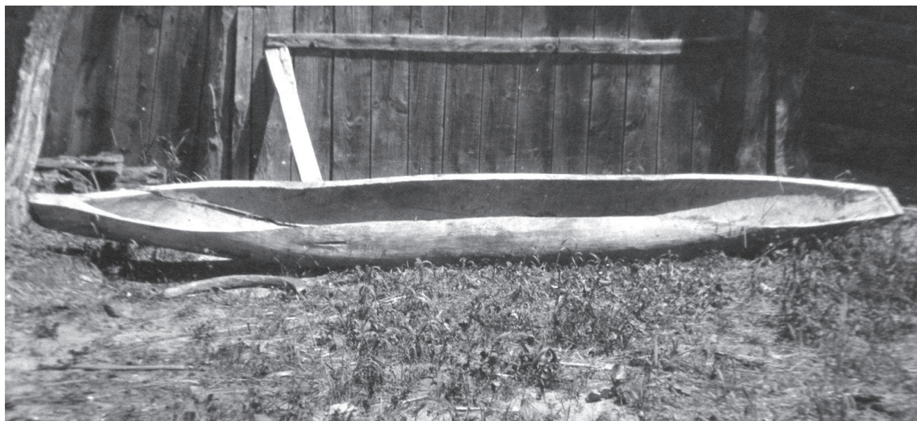
Рис. 8. «Готовий «човен у колоді», який ще не розвернений, с. Старосілля, Жукинська волость, Остерський повіт, Чернігівщина, 1922 р.»