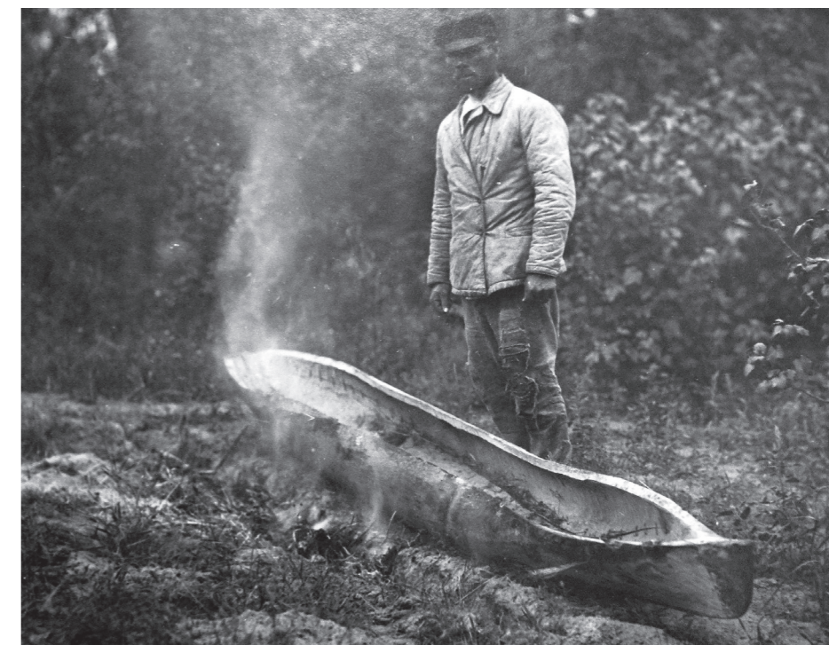
Рис. 10. Фото Д. Демуцького «Розпарює човна, прикрив- ши ним рівчака з жаром, с. Старосілля, Жукинська волость, Остерський повіт, Чернігівщина, 1922 р.» (колекція НМІУ)