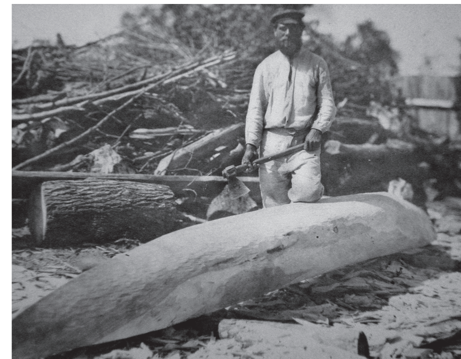
Рис. 6. Фото Д. Демуцького «Сокирою колоді надає форму човна, с. Старосілля, Жукинська волость, Остерський повіт, Чернігівщина, 1922 р.» (АНФРФ ІМФЕ)