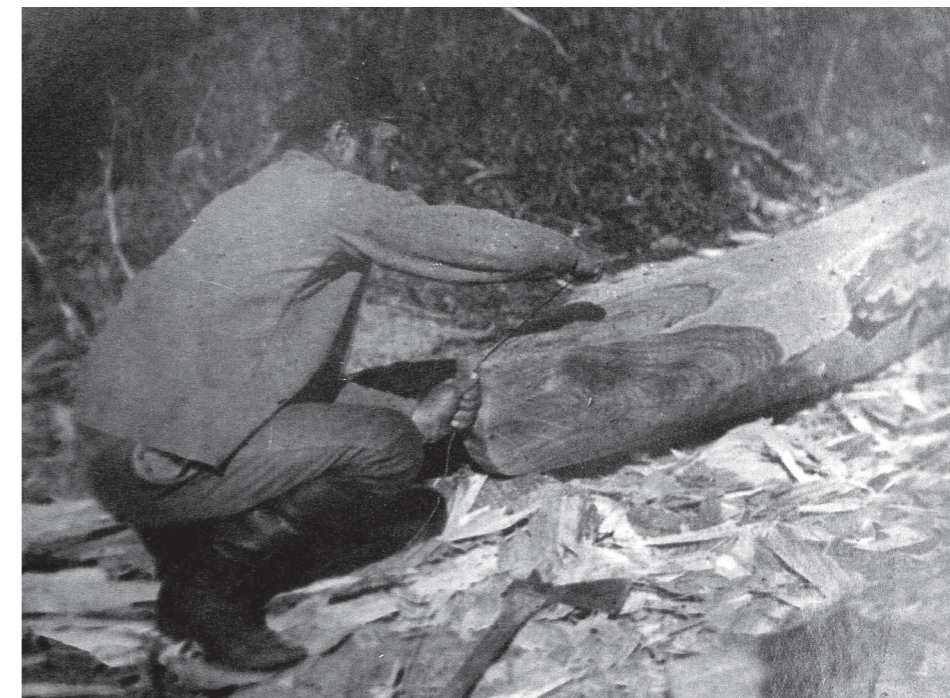
Рис. 5. Фото Д. Демуцького «Майстер відбиває шнуром по середині заготовки «правду», с. Старосілля, Жукинська волость, Остерський повіт, Чернігівщина, 1922 р.» (колекція НМІУ)