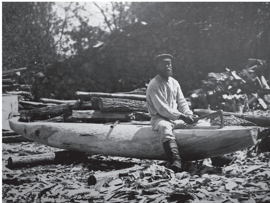
Рис. 7. Фото Д. Демуцького «Майстер «бортує» копилом човна, с. Ста- росілля, Жукинська во- лость, Остерський повіт, Чернігівщина, 1922 р.» (колекція НМІУ)