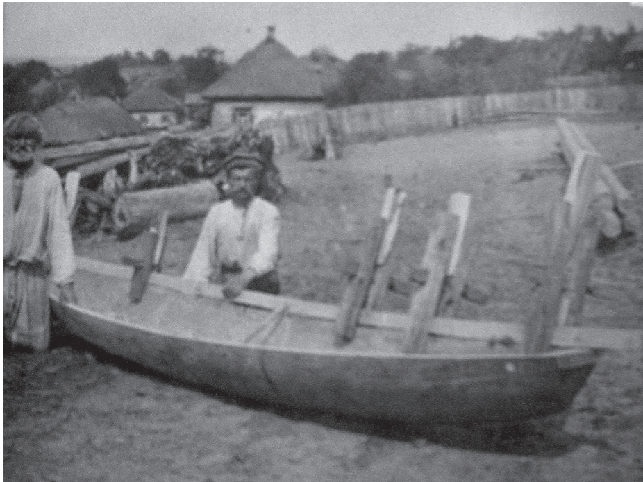
Рис. 15. Фото Д. Демуцького «Встановлення «нашивки» на стіни довбанки, с. Старосілля, Жукинська волость, Остерський повіт, Чернігівщина, 1922 р.» (АНФРФ ІМФЕ)

Щоб ознайомити відвідувачів із виробництвом «дуба» (великим човном, який робили з дощок у Старосіллі), на стенді висіло фото «виріб дуба з дощечок». (Рис. 16) 90