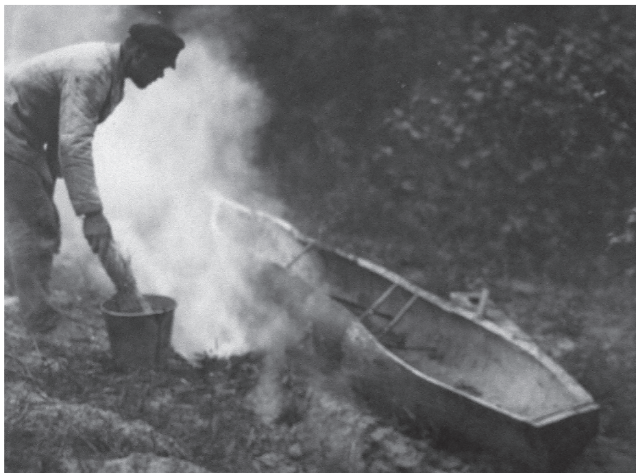
Рис. 11. Фото Д. Демуцького «Поставивши човна біля рівчака з вогнищем, намочує віхоть у відрі з водою, с. Старосілля, Жукинська волость, Остерський повіт, Чернігівщина, 1922 р.» (АНФРФ ІМФЕ)

8. Поставивши човна біля рівчака з вогнищем, намочує віхоть у відрі з водою. (Рис. 11) 85