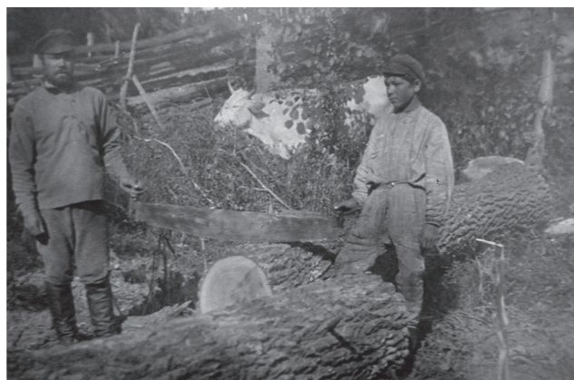
Рис. 4. Фото Д. Демуцького «Пиляння колоди на човна, с. Старосілля, Жукинська волость, Остерський повіт, Чернігівщина, 1922 р.» (колекція НМІУ)