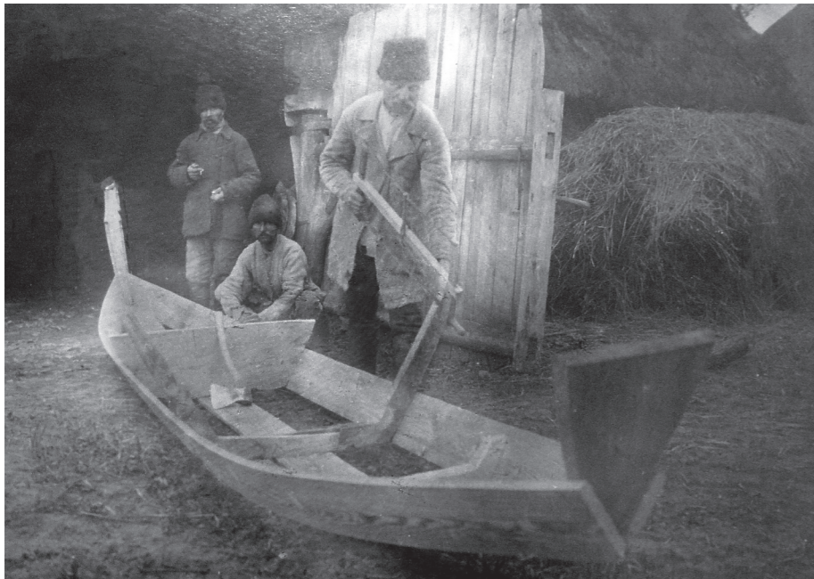
Рис. 16. Фото А. Онищука «Виробництво «дуба» (човна з дощок), с. Старосілля, Жукинська волость, Остерський повіт, Чернігівщина, 1929 р.» (колекція НМІУ)

Щоб ознайомити відвідувачів із виробництвом «дуба» (великим човном, який робили з дощок у Старосіллі), на стенді висіло фото «виріб дуба з дощечок». (Рис. 16) 90