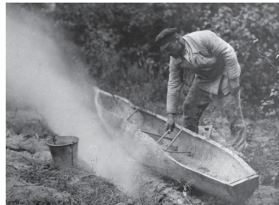
Рис. 13. ««Роздає човна», втискаючи в середину «цурки», с. Старосілля, Жукинська волость, Остерський повіт, Чернігівщина, 1922 р.»

10. «Роздає човна», втискаючи всередину «цурки». (Рис. 13) 87