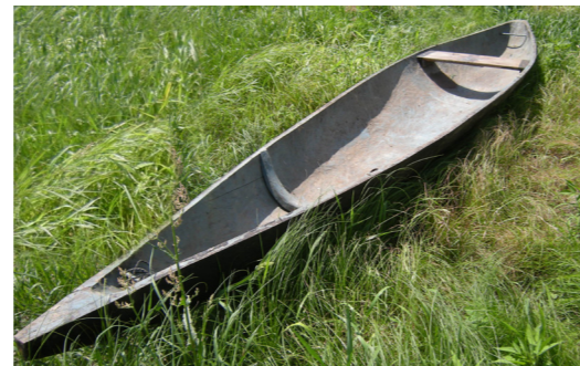
Рис. 3. «Довбанка, с. Мньов, Чернігівський р-н, Чернігівська обл., 2010 р.»

Після завершення «нашивки» (а якщо довбанка без них) робили і встановлювали «боті» («ботіна» 63 ), «поріжок», «снізки». «Боті» – це дуга, яку вставляли між стінками човна, прикріпивши до дна та боків. Її переважно виробляли з сосни. «Поріжок» – дошка, яку перпендикулярно встановлювали до дна і прикріплювали до стінок. Він служив сидінням для рибалки 64 . У сучасних довбанок «поріжок» відсутній, а замість нього використовується сидіння. (Рис. 3) 65 У кермо та в ніс вставляли дерев'яні палки («снізки»), щоб братися за них рукою, витягаючи човна з водойми. До передньої снізки чіпляли ланцюг для прив'язування на березі човна 66 .