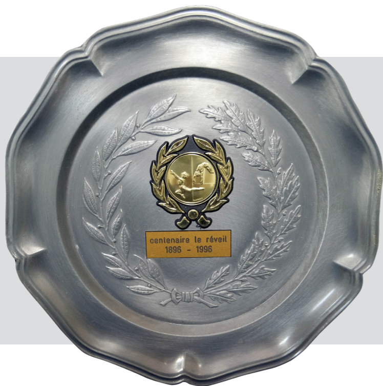
Рис. 10. Сувенірна таріль, подарована дворазовій чемпіонці зі спортивної гімнастики XXVI літніх Олімпійських ігор Лілії Подкопаєвій до 100-річчя відродження Олімпійського руху (1896–1996). 1996 р.

Лілія Подкопаєва передала комплекс матеріалів із атрибутикою столітньої Олімпіади. Зокрема, вручену їй сувенірну таріль до 100-річчя відродження олімпійського руху 19 . (Рис. 10) Цікавим експонатом є вимпел «Україна * Ukraine * Atlanta 1996» з автографом Лілії 20 . (Рис. 11)