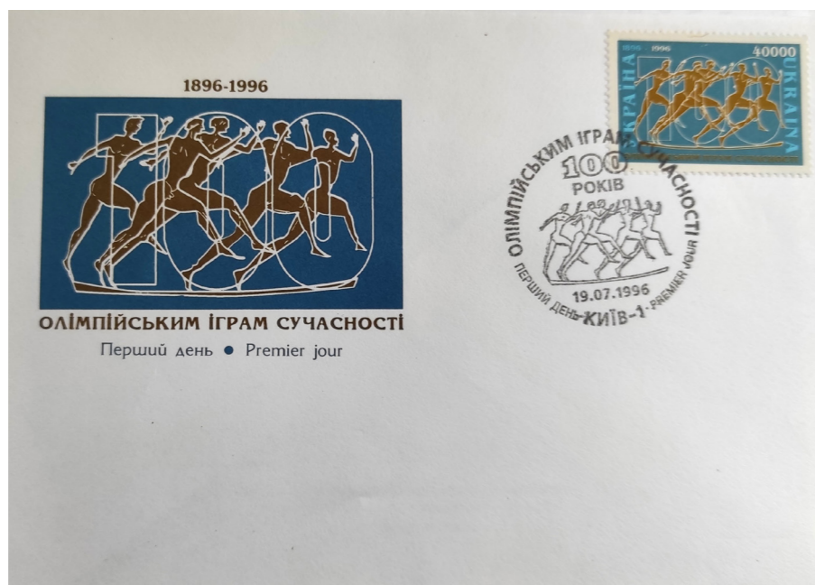
Рис. 5. Конверт «Першого дня» «Олімпійським іграм сучас- ності 100 років» із маркою номіналом 40 000 купонокарбованців та штемпелем спецпогашення. АТ «Конві», 1996 р., Київ, Україна