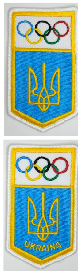
Рис. 7. Нагрудна нашивка члена Олімпійської збірної України XXVI Олімпійських ігор. 1996 р., Київ, Україна