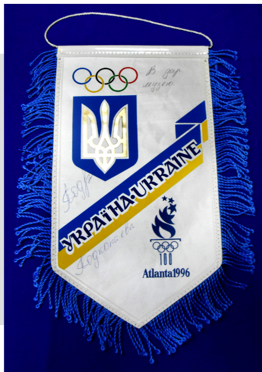
Рис. 11. Пам'ятний вимпел «Україна * Ukraine * 100 * Atlanta 1996» з автографом дворазової чемпіонки зі спортивної гімнастики XXVI літніх Олімпійських ігор Лілії Подкопаєвої. 1996 р.

У фондовому зібранні Столітню Олімпіаду ілюструють 118 одиниць зберігання, з яких 59 належать основному фонду (документи, речові експонати, фотографії). Частина вищезазначених предметів неодноразово експонувалися як на виставках, так і експозиціях. До проведення Чемпіонату Європи-2012 відділ «Історії незалежної України» підготував виставку «Спортивна слава України», де окремим блоком представили участь України в Олімпійських іграх. У статті висвітлено експонати з колекції музею (нагрудні значки, конверти з марками «Першого дня» із символікою XXVI літніх Олімпійських ігор, сувеніри ручної роботи,