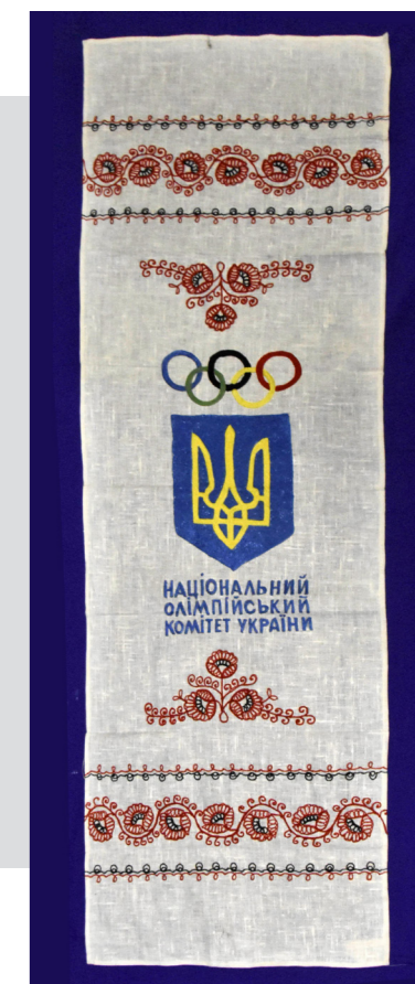
Рис. 9. Пам'ятний вишитий рушник «Національний Олімпійський Комітет України», виготовлений до XXVI Олімпійських ігор. 1996 р., Київ, Україна