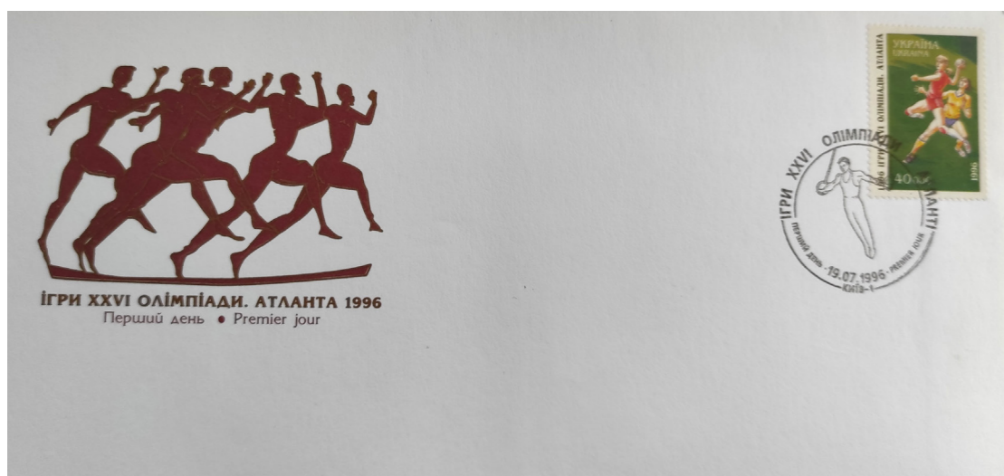
Рис. 6. Конверт «Першого дня» «Ігри XXVI Олімпіади. Атланта 1996» із маркою номіналом 40 000 купонокарбованців та штемпелем спецпогашення. АТ «Конві», 1996 р., Київ, Україна