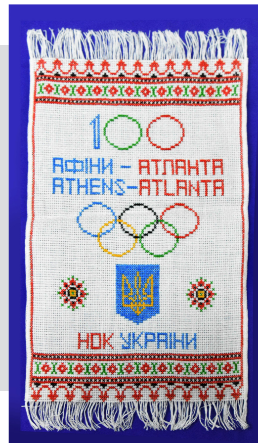
Рис. 8. Вишита сувенірна серветка «100 * Афіни – Атланта * НОК Україна», виготовлена на замовлення Національ- ного олімпійського комітету України до XXVI Олімпійських ігор. 1996 р., Київ, Україна