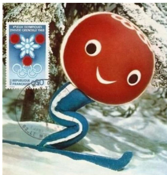
Рис. 3. Талісман X зимових Олімпійських Ігор на ім'я Schuss (Шус). 1968 р., Гренобль, Франція

ім'я Schuss (Шус) – фігура чоловічка на лижах із червоно-білою головою та синім тільцем і олімпійськими кільцями на лобі. (Рис. 3)