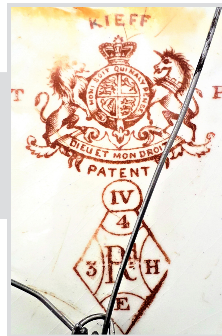
Рис. 6. Торгова марка «Wedgwood & Co» для «Trachtenberg & Panthes» на тарілці. 1869 р. НМІУ

(«Сором тому, хто подумає про це погано») й девізом королівської монархії («Бог і моє право») в тому вигляді, в якому означений завод застосовував зображення британського герба – як деколь 23 . Обабіч герба містяться літери «Т» та «Р» («Trachtenberg & Panthes»), зверху та знизу – написи «Kieff» та «PATENT». Під гербом зображено ромбічний «diamond mark» із написами: «Rd» («Registered Design»), «IV» (клас, що позначав вироби з кераміки); «H» (літерне позначення року патентування – 1869), «E» (літерне позначення місяця патентування – травень) та «4» (числове позначення дня патентування). Нанесення на виріб «діамантового знаку», 1842 р. впровадженого Британським патентним відомством, мало захищати власників запатентованого дизайну від підробок та наслідувань 24 .