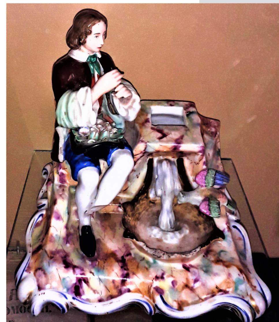
Рис. 1. Чорнильниця. 1840-ті – 1850-ті рр. Волокитинський порцеляновий завод. НМІУ

Один із цих предметів – фігурна настільна чорнильниця з умовною назвою «Юнак, який грає на сопілці біля джерела» (інв. № К-261), виготовлена в 1840-х – 1850-х рр. на Волокитинському порцеляновому заводі.