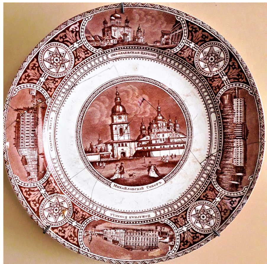
Рис. 2. Тарілка із малюнком «Kieff». 1869 р. Wedgwood & Co. НМІУ

Другим предметом є фаянсова тарілка із зображенням архітектурних пам'яток Києва (інв. № К-1090), виготовлена 1869 р. на заводі «Wedgwood & Co» на замовлення одеської торгової фірми «Трахтенберг та Пантес» для реалізації на українському ринку.