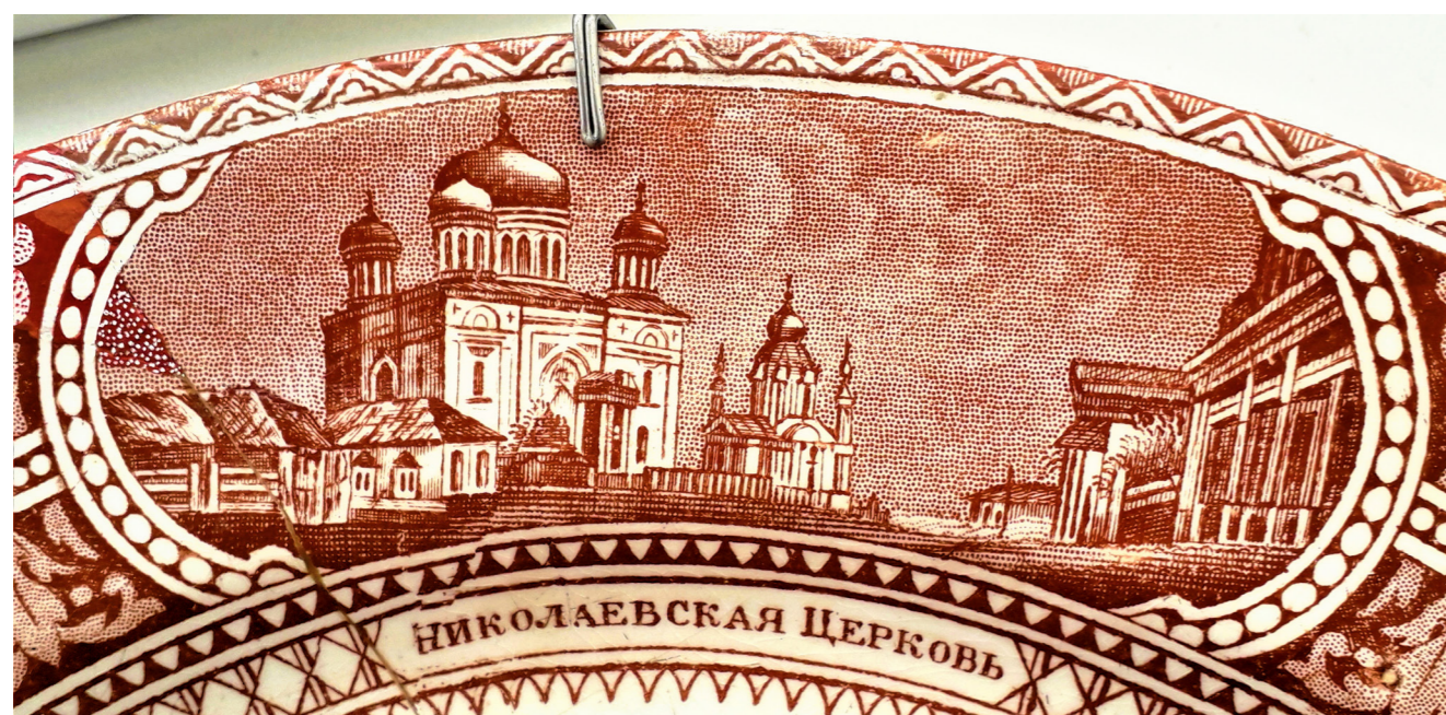
Рис. 5. Зображення церкви Миколи Десятинного на тарілці. 1869 р. НМІУ

(«Сором тому, хто подумає про це погано») й девізом королівської монархії («Бог і моє право») в тому вигляді, в якому означений завод застосовував зображення британського герба – як деколь 23 . Обабіч герба містяться літери «Т» та «Р» («Trachtenberg & Panthes»), зверху та знизу – написи «Kieff» та «PATENT». Під гербом зображено ромбічний «diamond mark» із написами: «Rd» («Registered Design»), «IV» (клас, що позначав вироби з кераміки); «H» (літерне позначення року патентування – 1869), «E» (літерне позначення місяця патентування – травень) та «4» (числове позначення дня патентування). Нанесення на виріб «діамантового знаку», 1842 р. впровадженого Британським патентним відомством, мало захищати власників запатентованого дизайну від підробок та наслідувань 24 .