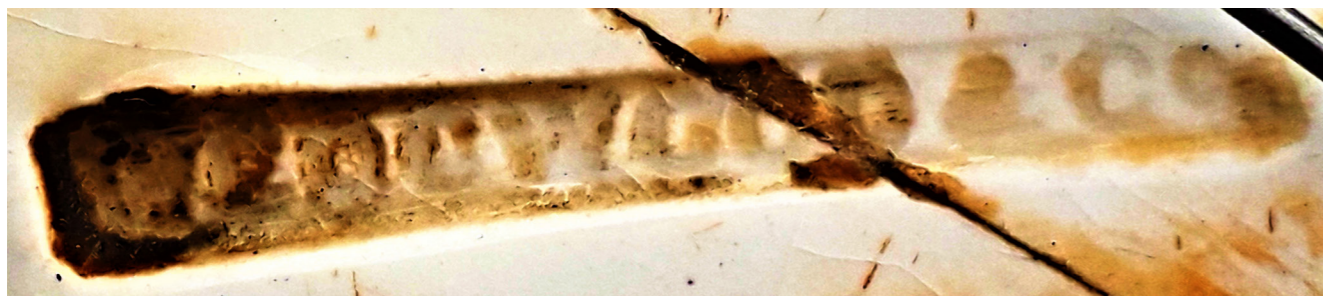
Рис. 3. Клеймо «Wedgwood & Co» в тісті тарілки. 1869 р. НМІУ

Відбиток рельєфного штампа в керамічному тісті та маркувальний деколь на денці засвідчують, що означену тарілку виготовили 1869 р. на замовлення одеської фірми «Трахтенберг та Пантес» («Trachtenberg & Panthes») на керамічному підприємстві «Wedgwood & Co», що діяло з 1860 р. в м. Танстоллі (з 1910 р. перебуває у складі м. Сток-на-Тренті) у Великій Британії.