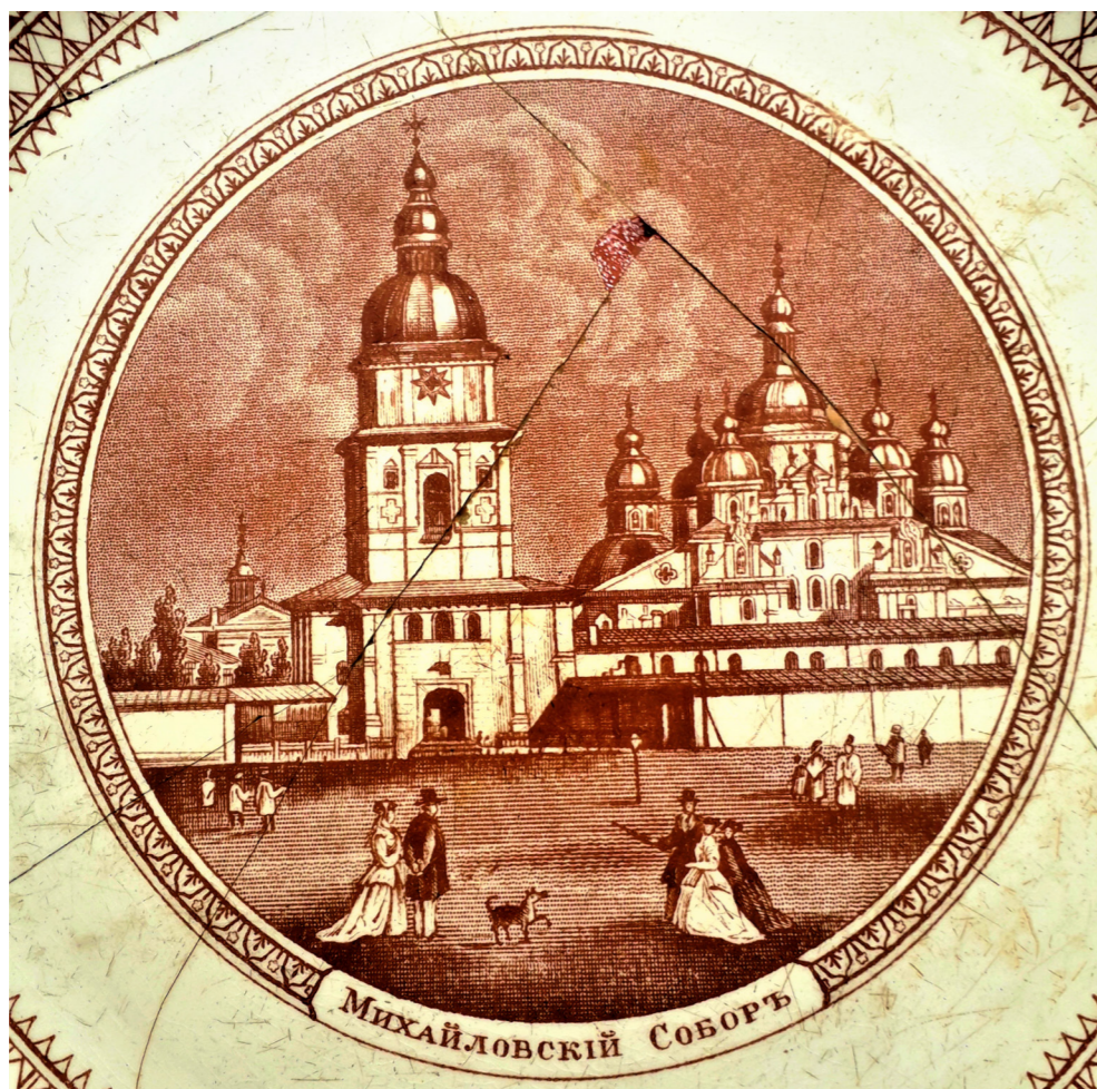
Рис. 4. Зображення Михайлівського монастиря на тарілці. 1869 р. НМІУ