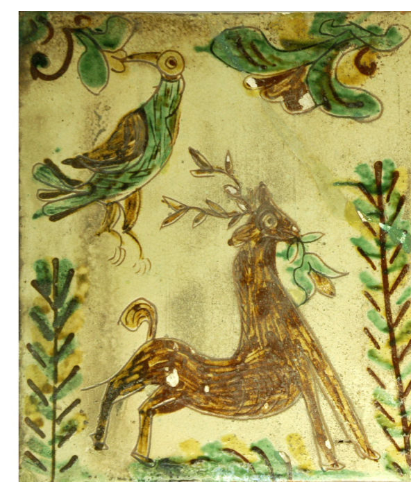
Рис. 12. Кахля. Поч. ХІХ ст. фонд НМНАПУ КВ - 58, А - 2/31 Акт приймання № 30 від 22.07.1971 р.