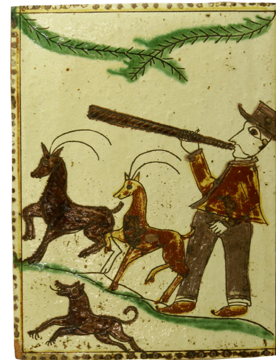
Рис. 10. Кахля. Поч. ХІХ ст. фонд НМНАПУ КВ - 58, А - 2/7 Акт приймання № 30 від 22.07.1971 р.