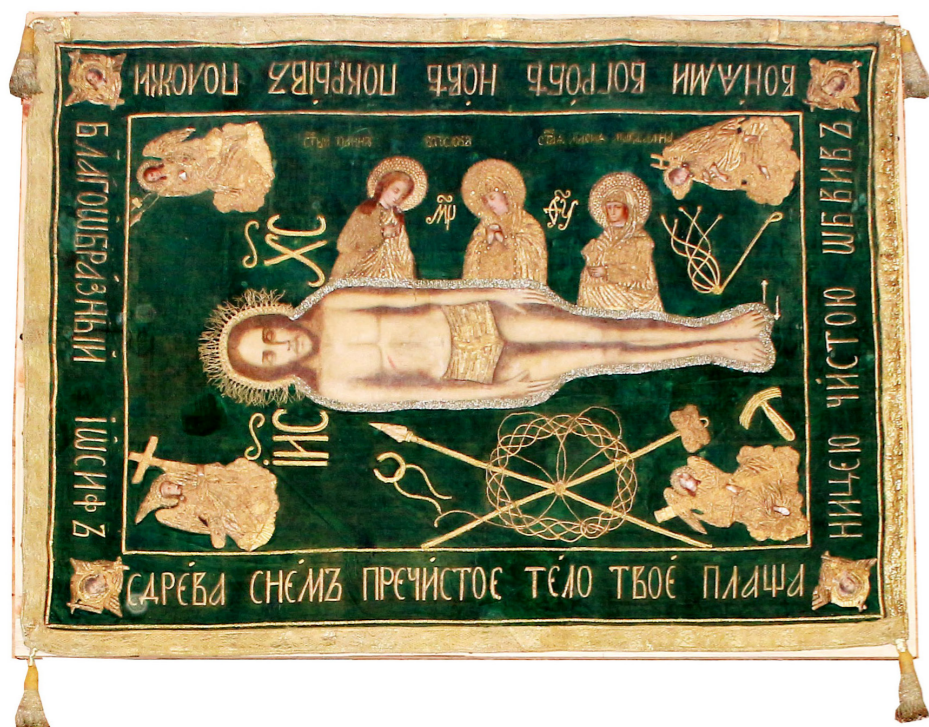
Рис. 3. Плащаниця. Кін. XVIII ст. фонд НМНАПУ КВ – 220/63, ЦН – 318 Акт приймання № 772 від 22.12.1972 р.