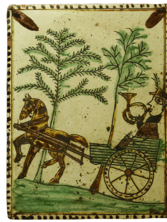
Рис. 11. Кахля. Поч. ХІХ ст. фонд НМНАПУ КВ - 58, А - 2/10 Акт приймання № 30 від 22.07.1971 р.