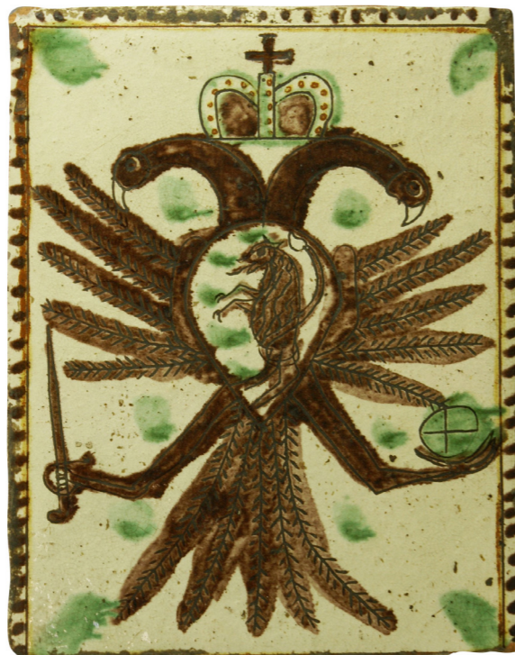
Рис. 6. Кахля. Поч. ХІХ ст. фонд НМНАПУ КВ - 58, А - 2/9 Акт приймання № 30 від 22.07.1971 р.