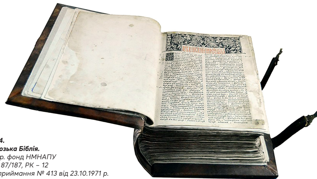
Рис. 4. Острозька Біблія. 1581 р. фонд НМНАПУ КВ – 87/187, РК – 12 Акт приймання № 413 від 23.10.1971 р.