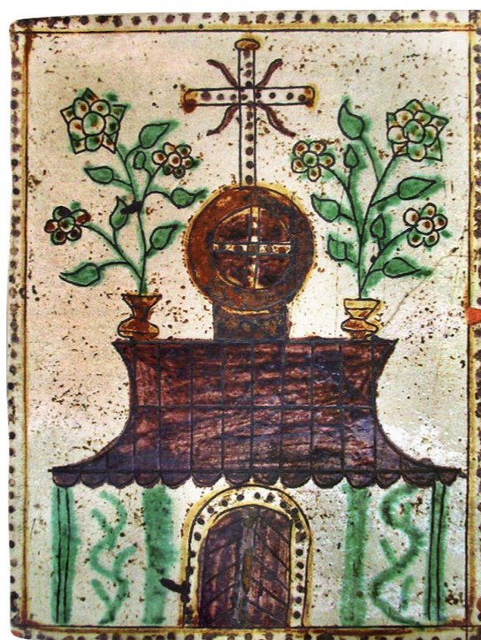
Рис. 8. Кахля. Поч. ХІХ ст. фонд НМНАПУ КВ - 58, А - 2/1 Акт приймання № 30 від 22.07.1971 р.