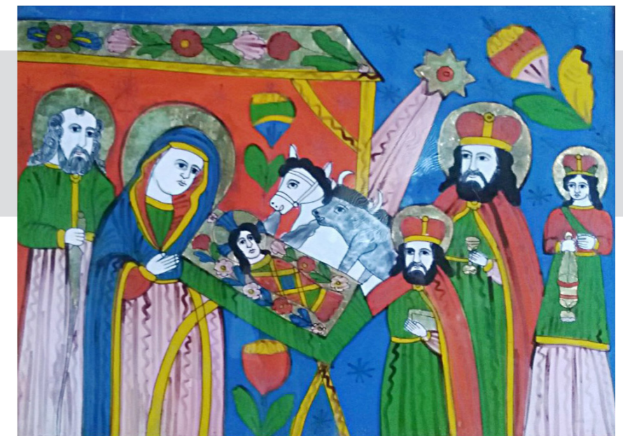
Рис. 1. 1. Ікона «Різдво Христове». Поч. XIX ст. фонд НМНАПУ КВ – 141/16, Ж – 370. Акт приймання № 781 від 24.10. 1972 р.

Унікальною є ікона «Різдво Христове» поч. XIX ст. (Рис. 1) Виконаний на склі біблійний сюжет вкрай своєрідний, елементи орнаменту споріднюють ікону з народною картинкою відповідного періоду.