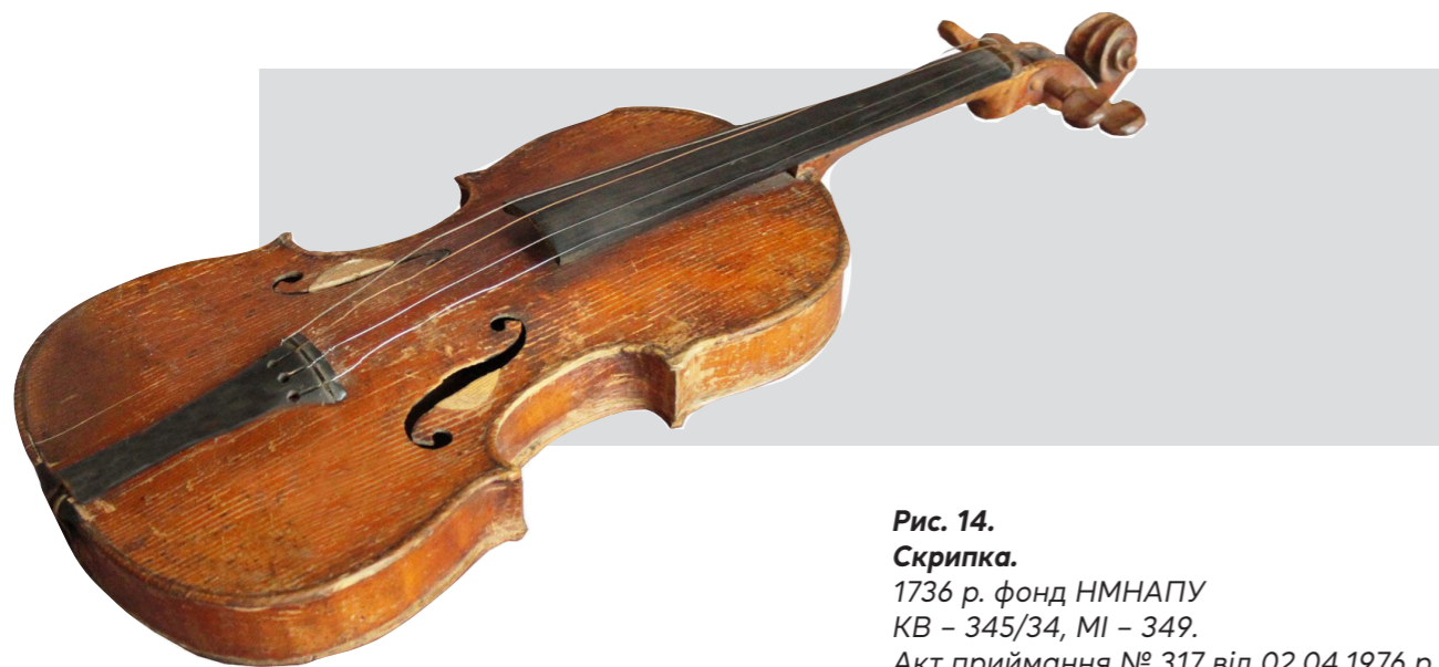
Рис. 14. Скрипка.

Серед раритетних музейних предметів, які через свою унікальність не можуть бути представлені в експозиції, – скрипка, виготовлена в майстерні Йозефа (Джузеппе) Гварнері та датована 1736 роком. (Рис. 14) Зрозуміло, що цей музичний інструмент ніколи не потрапить до експозиції музею, а експонування його на виставках вимагатиме спеціальних умов і охоронних заходів, з огляду на унікальність.