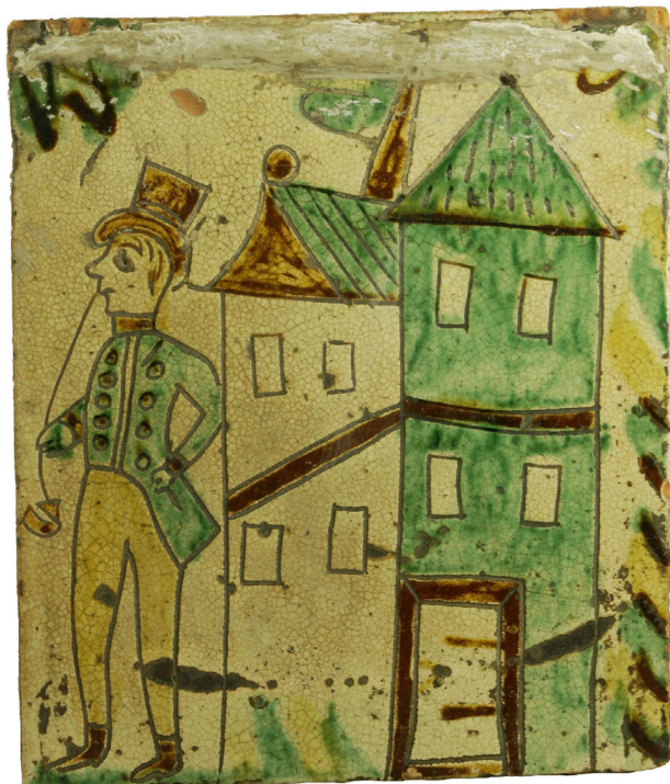
Рис. 5. Кахля. Поч. ХІХ ст. фонд НМНАПУ КВ - 58, А - 2/17 Акт приймання № 30 від 22.07.1971 р.