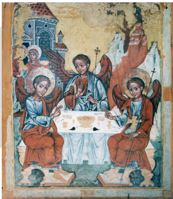
Рис. 2. Ікона «Трійця». II пол. XVII ст. фонд НМНАПУ КВ – 1058/5, Ж – 2265 Акт приймання № 8746 від 15.04.1987 р.

Яскравим та рідкісним зразком волинської іконографії II пол. XVII ст. є ікона «Трійця». (Рис. 2)