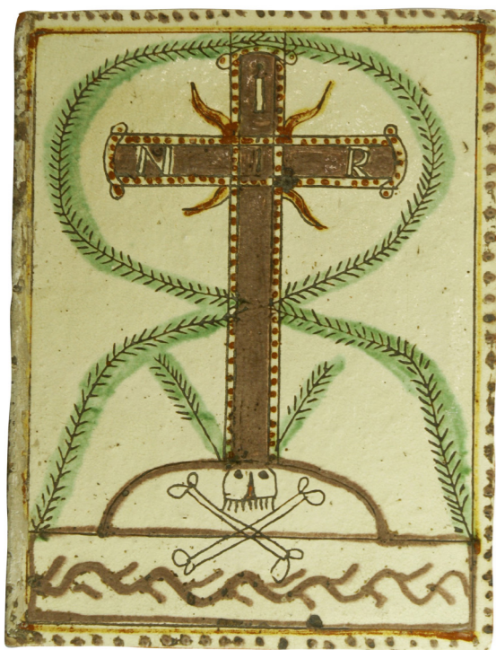
Рис. 7. Кахля. Поч. ХІХ ст. фонд НМНАПУ КВ - 58, А - 2/8 Акт приймання № 30 від 22.07.1971 р.