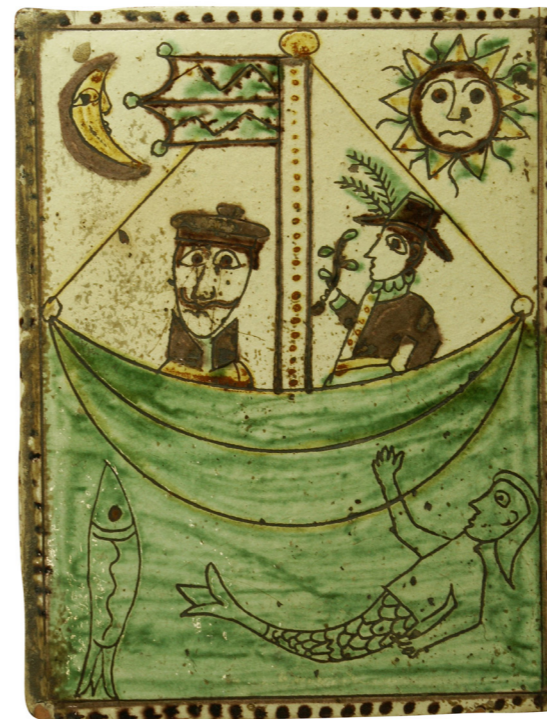
Рис. 9. Кахля. Поч. ХІХ ст. фонд НМНАПУ КВ - 58, А - 2/4 Акт приймання № 30 від 22.07.1971 р.