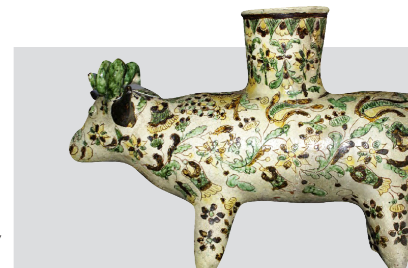
Рис. 19. Баранець-підвазонник. Авт. Цвілик П. Й. Сер. ХХ ст. Глина, ангоб, полива. Випалювання, розпис. Інв. № КН-143/158 КС-744. НМНАПУ

У фондовій колекції НМНАПУ також зберігаються скульптурні роботи художниці, виконанні з тими самими майстерністю та художнім смаком, що особливо простежуються в майстерному поєднанні форми з орнаментальним оформленням. Цікавими є форма й розпис декоративного баранця-підвазонника (КН-143/158 КС-744). (Рис. 19)