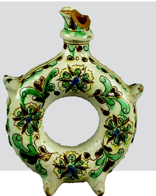
Рис. 10. Колач (куманець). Авт. Цвілик П. Й. Сер. ХХ ст. Глина, ангоб, полива. Випалювання, розпис. Інв. № КН-143/135 КС-726. НМНАПУ

Схожий орнамент бачимо й на колачі (куманці) (КН-143/135 КС-726). Віночок створено зі стилізованих листків та квіток, обрамлених орнаментом із кульок та півкульок, з'єднаних у подвійні лінії. (Рис. 10)