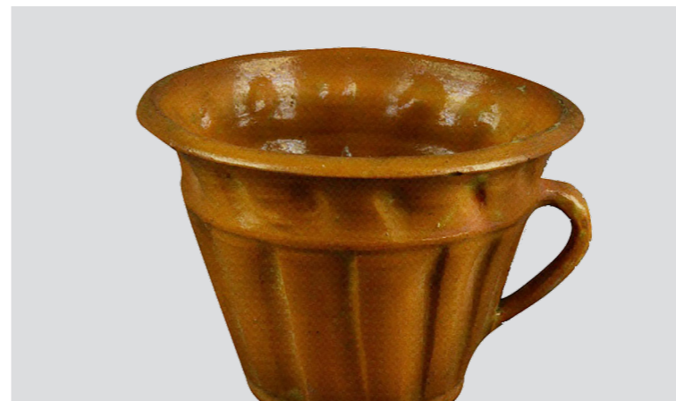
Рис. 18. Бабчер (пасківник). Авт. Цвілик П. Й. 1930-ті рр. Глина, полива. Випалювання. Інв. № КН-409/159 КС-3427. НМНАПУ

корпус посудини гармонійно переходить у пластичну витончену вузьку ручку, а рельєфний орнамент, поєднуючись із вальцеподібною формою бабчера, створює злагодженість пластичних мас, надаючи художньої довершеності всьому виробу. (Рис. 18)