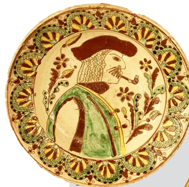
Рис. 12. Таріль настінний. Авт. Цвілик П. Й. Поч. ХХ ст. Глина, ангоб, полива. Випалювання, розпис. Інв. № КН-143/104 КС-696. НМНАПУ

Цікавим є таріль із поясным зображенням гуцула з люлькою в капелюсі та кептарі (КН-141/104 КС-696). (Рис. 12)