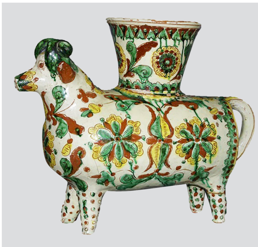
Рис. 5. Скульптура-кашпо «Баран». Авт. Цвілик П. Й. Сер. XX ст. Глина, ангоб, полива. Випалювання, розпис. Інв. № КН-143/157 КС-743. НМНАПУ

Після Другої світової війни асортимент виробів подружжя Цвіликів став ще різноманітнішим. Декоративно-побутовий та скульптурний посуд, настінні прикраси, скульптуру малих форм вони збагачували новими пластичними формами та орнаментально-квітковими розписами, що символізували життя народу на Прикарпатті. (Рис. 5)