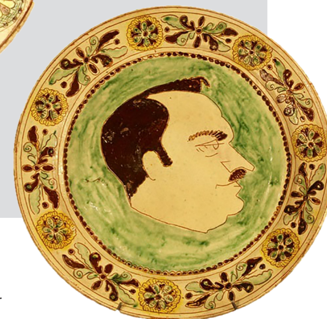
Рис. 13. Тарілка декортивна. Авт. Цвілик П. Й. Сер. ХХ ст. Глина, ангоб, полива. Випалювання, розпис. Інв. № КН-143/313 КС-755. НМНАПУ

На берегах виробу міститься характерний для П. Цвілик ажурний стилізований рослинний орнамент із напівквітів, виконаний із притаманною для майстрині точністю та вигадливістю.