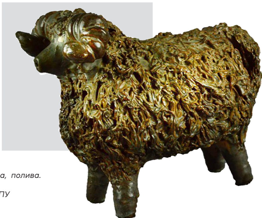
Рис. 7. Скульптура «Баран». Авт. Цвілик П. Й. Сер. ХХ ст. Глина, полива. Випалювання. Інв. № КН-216/45 КС-1812. НМНАПУ

Нова грань таланту майстрині розкрилася 1955 р. у скульптурно-декоративній пластиці. Це умовно трактовані зображення тварин і птахів – оленів, баранців, півників, павичів 22 . (Рис. 7)