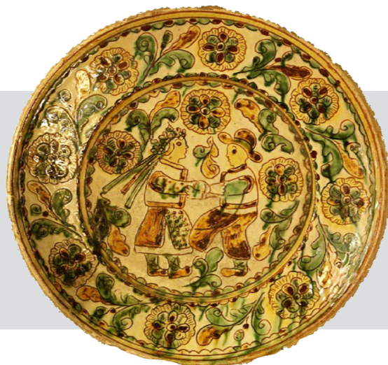
Рис. 2. Таріль настінний. Авт. Цвілик П. Й. 1960 р. Глина, ангоб, полива. Випалювання, розпис. Інв. № KH-216/89 KC-1849. НМНАПУ

Невеликі за розміром вироби (баранчики, півники, дзбанки, миски, тарілки, баклаги, двійняки, колачі тощо) декорувала рослинним розписом (розетки, квітучі галузки), зображенням тварин і традиційними сюжетними сценами (гуцульські танці, музики, мисливці тощо) 12 . (Рис. 2)