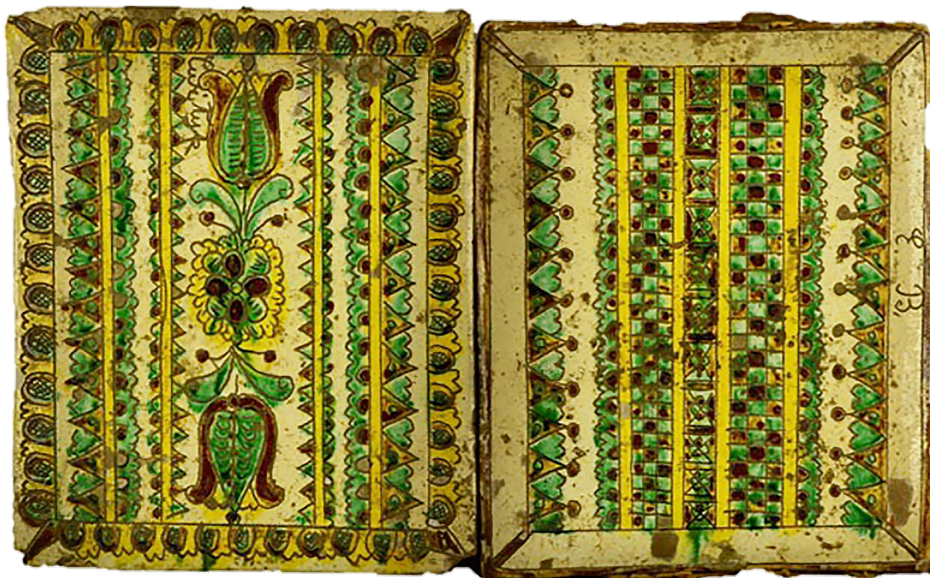
Рис. 17. Обкладинки до альбому. Авт. Цвілик П. Й. 1930-ті рр. Глина, ангоб, полива. Випалювання, розпис. Інв. № КН-216/66 КС-1832. НМНАПУ

Рідше майстриня обирала геометричні орнаменти. Так, для оздоблення обкладинок до альбому (КН-216/66 КС-1832) П. Цвілик використала із властивим їй відчуттям ритму, рівноваги, симетрії поєднання геометричних орнаментів із флористичними мотивами. (Рис. 17)