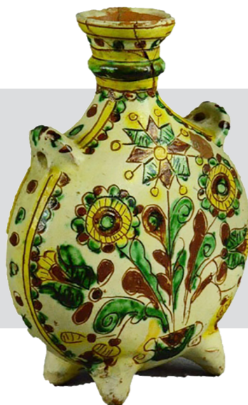
Рис. 1. Баклажок. Авт. Цвілик П. Й. Сер. XX ст. Глина, ангоб, полива. Випалювання, розпис. Інв. № KB-143/298 KC-749. НМНАПУ

Талановита майстриня виготовляла миски, полумиски, глечики, баклаги, свічники, скульптури, дитячі іграшки 11 . (Рис. 1)