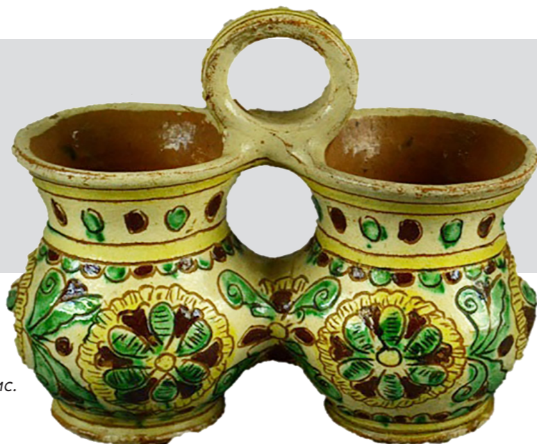
Рис. 11. Близнята. Авт. Цвілик П. Й. Сер. ХХ ст. Глина, ангоб, полива. Випалювання, розпис. Інв. № КН-143/301 КС-752. НМНАПУ

Вигадуєчи численні композиції із простих елементів, Павлина Йосипівна щоразу створювала нові квіткові візерунки. Так, близнята (КН-143/301 КС-752) оздоблені великими кулястими квітами, а на шийці зображена орнаментальна смужка з кульок. (Рис. 11)