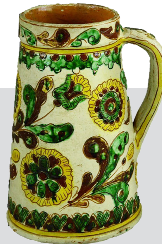
Рис. 8. Кухоль. Авт. Цвілик П. Й. Сер. ХХ ст. Глина, ангоб, полива. Випалювання, розпис. Інв. № КН-143/141 КС-732. НМНАПУ

У колекції НМНАПУ зберігається декілька декоративних робіт майстрині, створених на основі традиційних для українського гончарства форм: куманець, близнята, боклажок, сметанники, глечики, горщики. Кухоль (КН-143/141 КС-732) прикрашений характерним для П. Цвілик орнаментом із листя, квітів, заячих вушок та очок, обрамлений смугою тарничок. (Рис. 8)