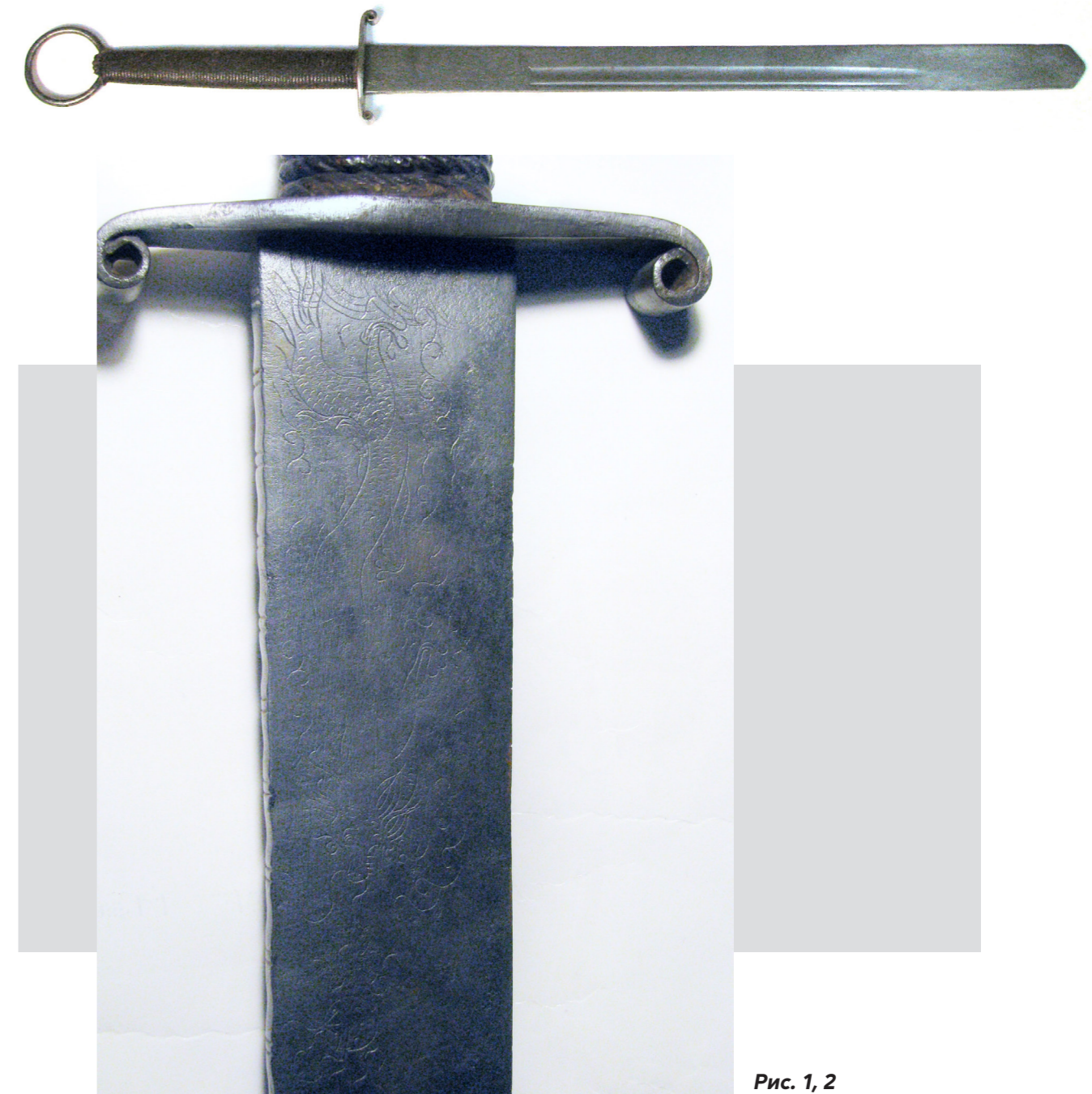
Рис. 1, 2

а з боку леза – довша. Довжина руків'я – 34 см. Клинок – дводольний однолезовий без п'яти. Доли різної ширини: вузький біля обуха та широкий під ним. Довжина долів – 40 см. Ширина клинка по всій довжині однакова – 5 см. На відстані 2 см від вістря краї клинка сточені під кутом 45 градусів. Товщина клинка поступово зменшується, становлячи 10 мм біля перехрестя та 2,5–2 мм – біля вістря. Довжина клинка – 72 см. Загальна довжина меча – 106 см. На клинку між перехрестям і початком долів із обох боків нанесені однакові гравійовані зображення: дракон, що летить у хмарах, перед ним – круглий предмет, схожий на китайський паперовий ліхтарик. (Рис. 1, 2)