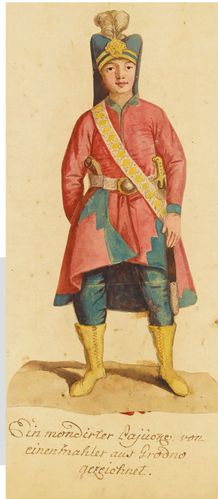
Рис. 14. Малюнок польського яничара. Худ. Йоахім Даніель фон Яух. XVIII ст. Бібліотека Народова. Варшава

Схожий на той, що відтворено на полотні, яке досліджується, головний убір із такою самою невеликою латунною бляхою є на малюнку польського яничара із замальовок архітектора Йоахіма Даніеля фон Яуха (Рис. 14)