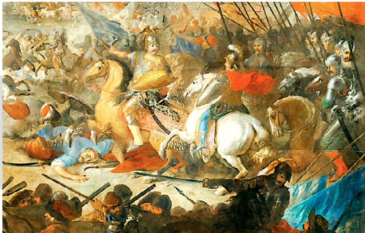
Рис. 7. Битва під Парканами.

Худ. Мартин Альтомонте. Кінець XVII ст. Полотно, олія. ЛНГМ, Золочівський замок (фрагмент)