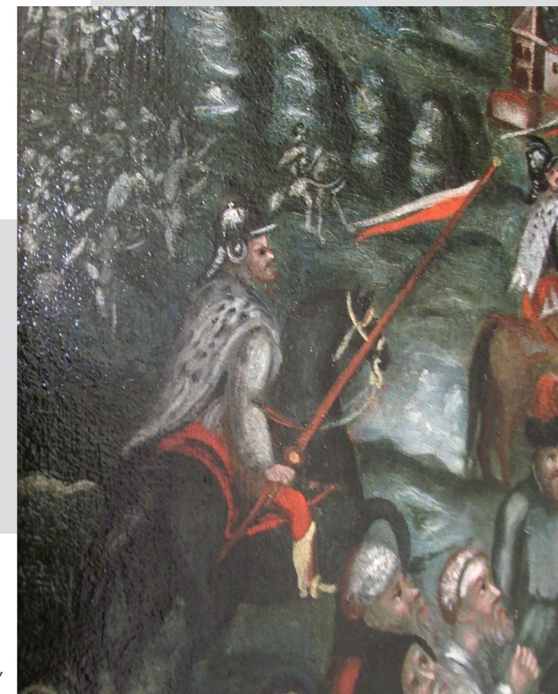
Рис. 11. Портрет Сигізмунда III. Худ. Шимон Богушевич. Полотно, олія. Початок XVII ст. ЛНГМ, Олеський замок (фрагмент)