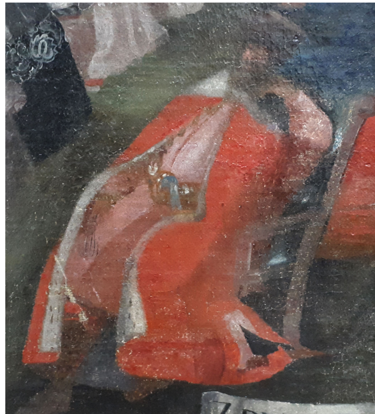
Рис. 3. Сандомирський рокош 1606 року. Автор невідомий. Полотно, олія. XVIII ст. НМІУ (фрагмент)

У персонажа із центральної частини картини, зображеного в довгополому одязі червоного кольору (делії чи опанчі), який куняє на стільці з булавою в руці, визирає руків'я шаблі, яке нагадує аналогічні зразки, характерні для кінця XVII – початку XVIII ст. (Рис. 3) Шаблі яничара та вершників також схожі на зразки кінця XVII ст. (Рис. 4)