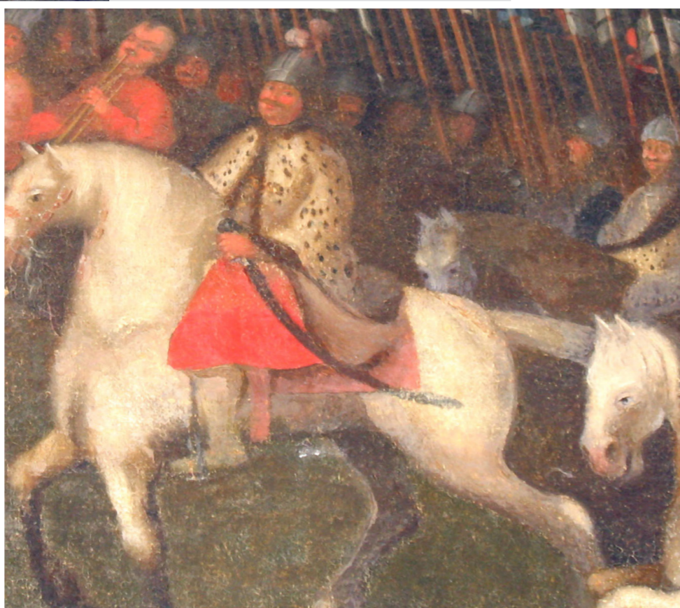
Рис. 5. Сандомирський рокош 1606 року. Автор невідомий. Полотно, олія. XVIII ст. НМІУ (фрагмент)

Ефектна група підрозділу вершників, озброєних по-гусарськи, зображених праворуч поряд із панцерними в нижній частині полотна, також викликає питання 7 . (Рис. 5)