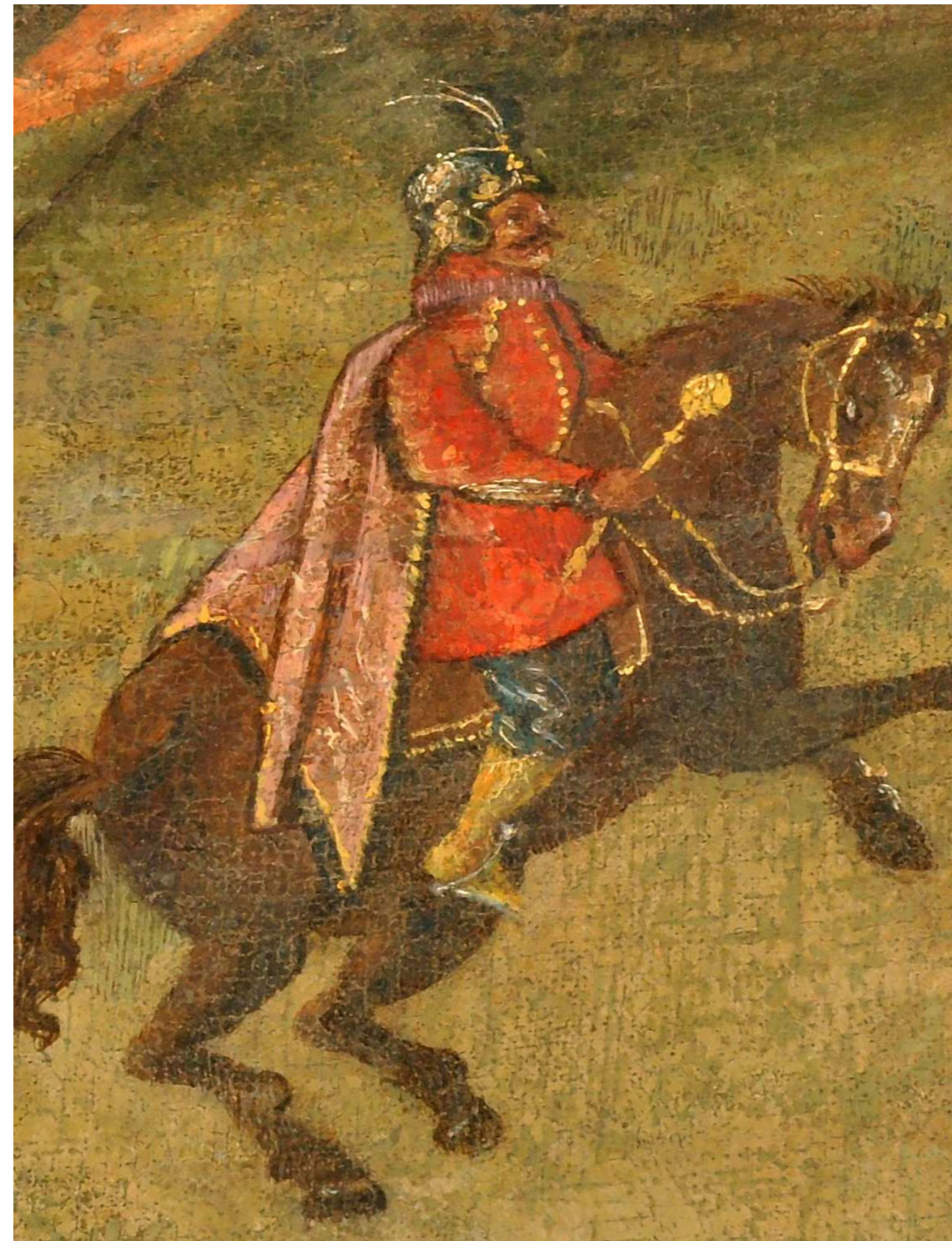
Рис. 8, 9. Битва під Клушино 1609 року.

Худ. Шимон Богушевич. Полотно, олія. Початок XVII ст. ЛНГМ, Олеський замок (фрагменти)