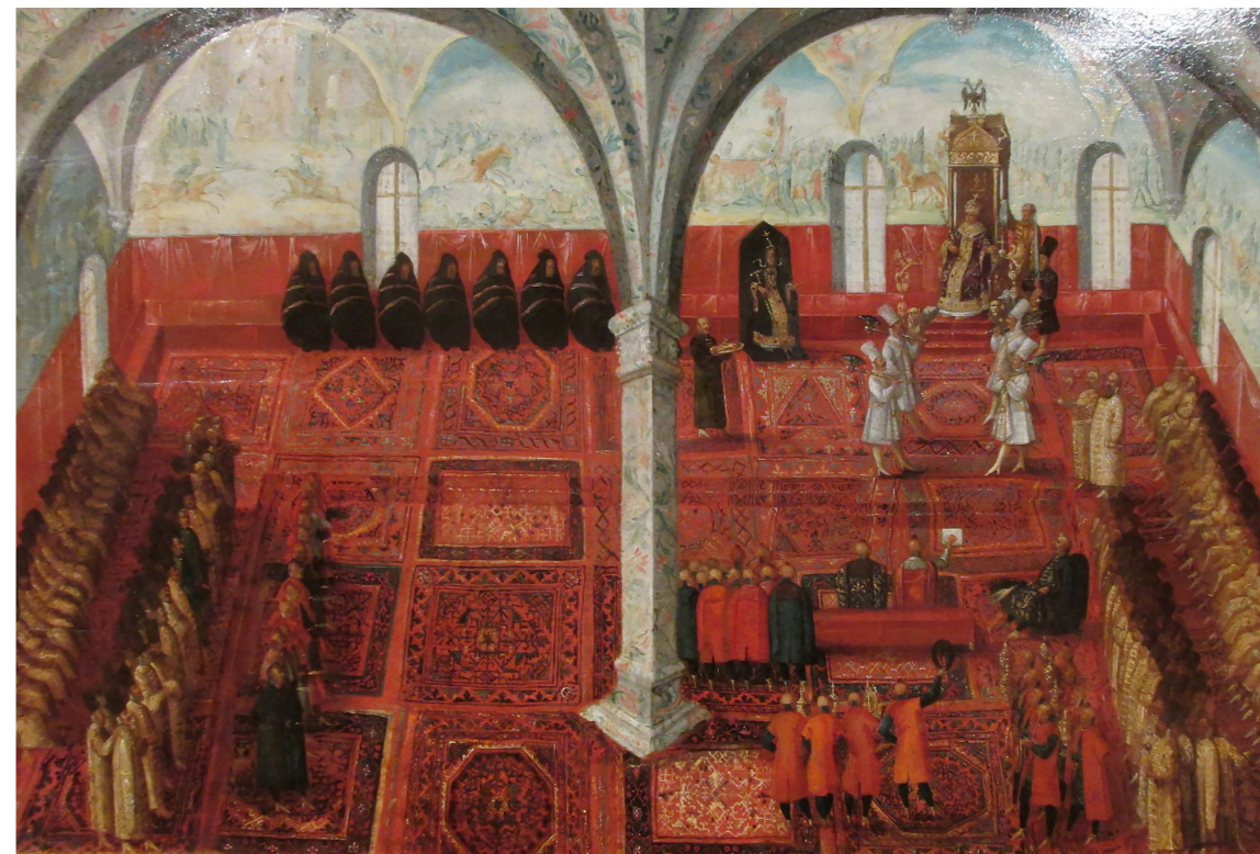
Рис. 10. Прийом польських послів у кремлівських палатах. Худ. Шимон Богушевич. Полотно, олія. Початок XVII ст. Будапештський національний музей

Третя – портрет Сигізмунда III, теж із зібрання Олеського замку (ЛНГМ ім. Б. Г. Возницького). Окремо звертаємо увагу на фрагмент із зображенням гусара в характерному стилі. (Рис. 11)