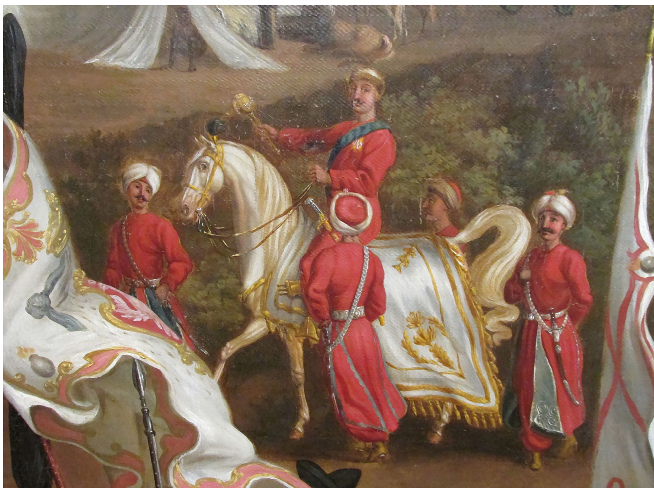
Рис. 15. Компамент військ польських, саксонських та литовських у Чернякові 1732 року. Худ. Йоганн Самуель Мок. 1735 р. Музей Війська Польського у Варшаві (фрагмент)

Те саме спостерігаємо й на прикладі персонажа «Сандомирського рокошу 1606 року», одягнутого як магнатський паук початку XVIII ст. Бачимо типові одяг та спорядження, схожі на ті, що зображені на полотні Йоганна Самуеля Мока «Компамент військ польських, саксонських та литовських у Чернякові 1732 року», написаному 1735-го, та інших тогочасних картинах, що демонструють річпосполитських і саксонських яничар та пауків. (Рис. 15)