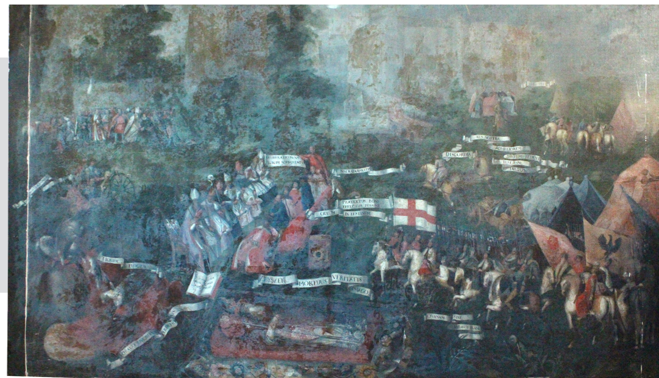
Рис. 1. Сандомирський рокош 1606 року. Автор невідомий. Полотно, олія. XVIII ст. НМІУ (вигляд в ультрафіолетовому діапазоні)

На відміну від оригінального покривного лаку, який має зеленувате світіння (флуоресценцію), властиве старим лакам на основі натуральних смол, реставраційне тонування має вигляд коричнево-фіолетових плям, темніших за тоном, що характерно для флуоресценції доповнень, здійснених щонайменше 50–60 років тому. Помітно, що сильно реставровані ділянки полотна здебільшого вирізняються спрощеним, схематичним рівнем відтворення початкових оригінальних зображень. Це стосується як відтворення деталей та рисунку облич, частин людського тіла, так і предметів та елементів одягу, озброєння та спорядження.