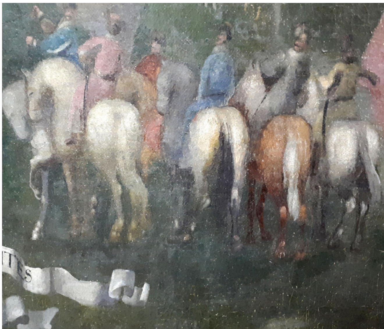
Рис. 2. Сандомирський рокош 1606 року. Автор невідомий. Полотно, олія. XVIII ст. НМІУ (фрагмент)

Такий тип одягу став популярним наприкінці XVII – початку XVIII ст.