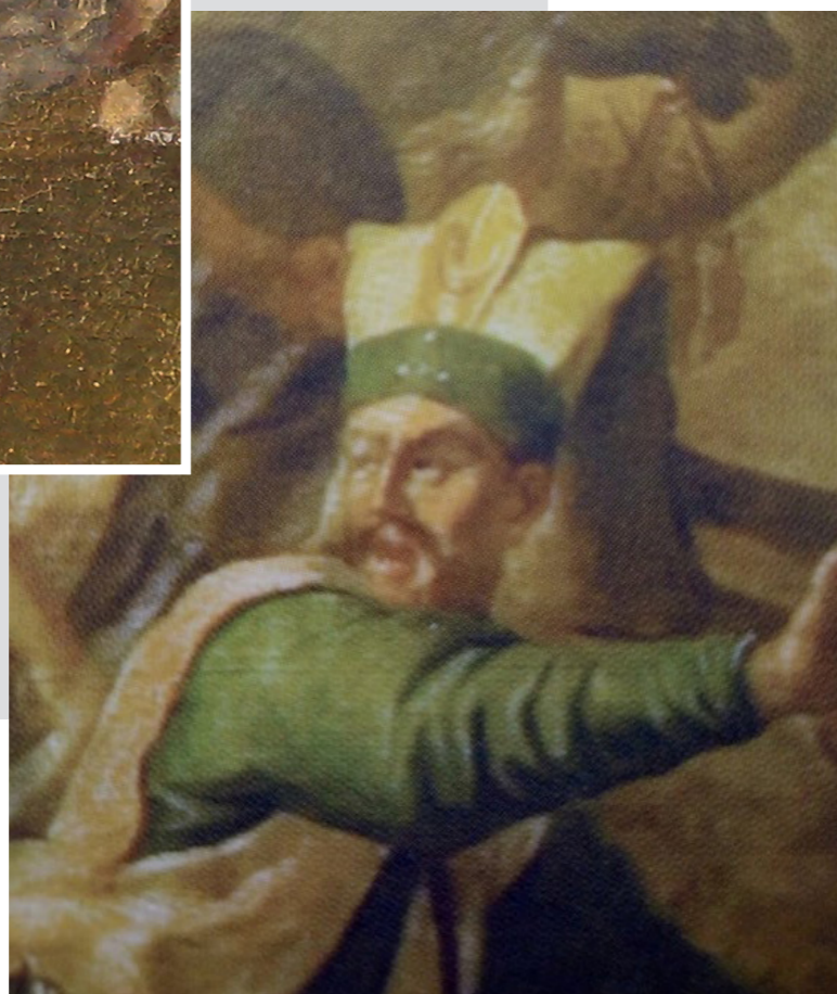
Рис. 13. Битва під Віднем (Перемога під Віднем 12 вересня 1683 року). Худ. Мартин Альтомонте. Кінець XVII ст. Полотно, олія. ЛНГМ, Одеський замок (фрагмент)

А турецькі яничари початку XVII ст. мали на шапках єнлуки великі й довгі, чеканні з орнаментом, інкрустовані камінням чи зображеннями, напівсферичні, які часто зображались з пір'ям та ложкою всередині.