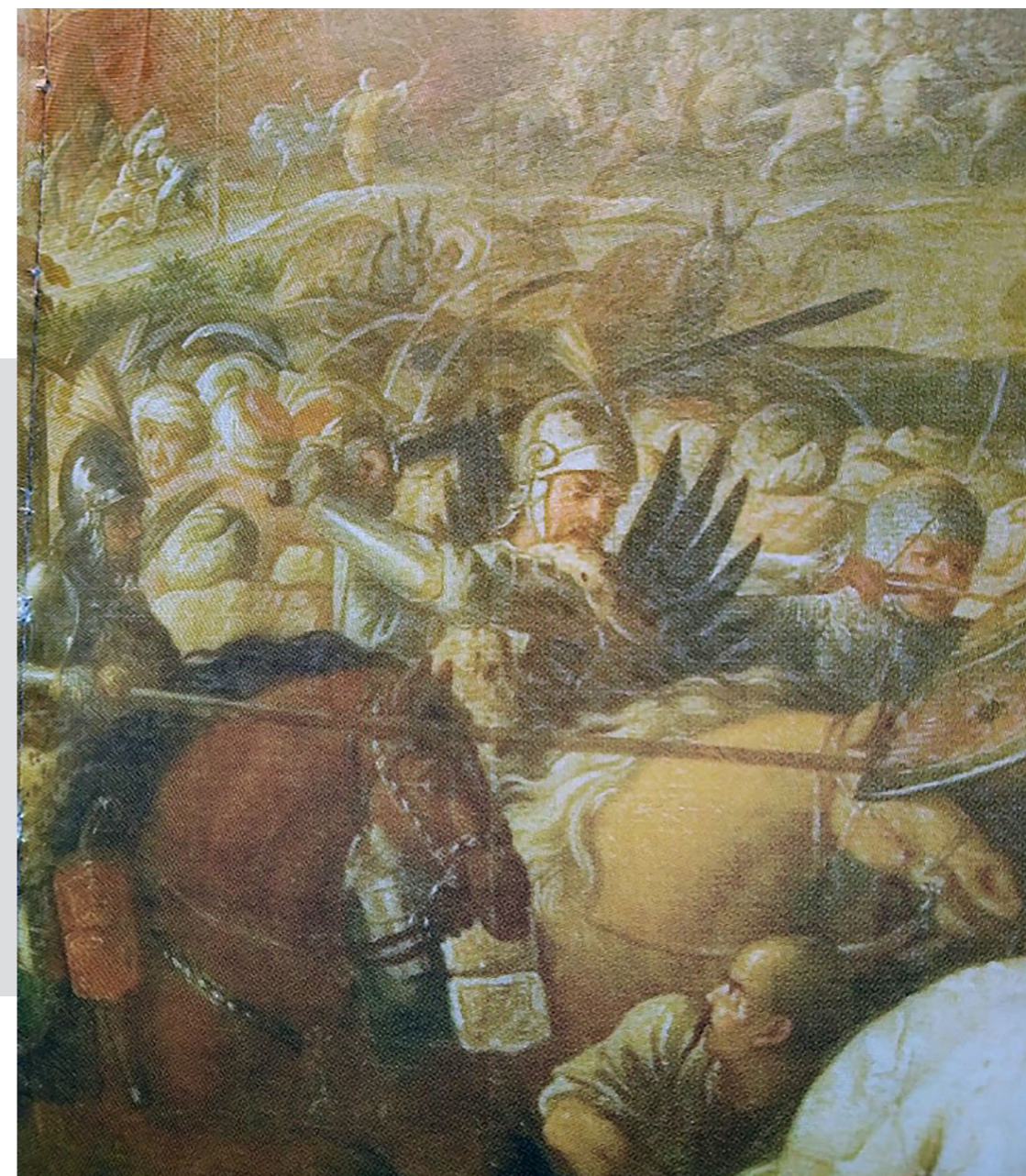
Рис. 6. Битва під Віднем (Перемога під Віднем 12 вересня 1683 року). Худ. Мартин Альтомонте. Кінець XVII ст. Полотно, олія. ЛНГМ, Олеський замок (фрагмент)

З одного боку, гусари та панцерні XVII ст. показані начебто типово. Але за деталями вони більше схожі на аналогічні зображення гусар (звертаємо, зокрема, увагу на гусарські шоломи!) та панцерних на картинах Мартина Альтомонте 1694 р. «Битва під Віднем» та «Битва під Парканами» 8 . (Рис. 6, 7)