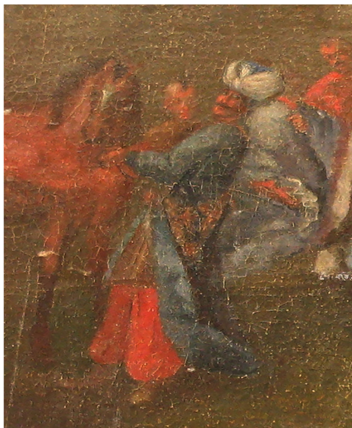
Рис. 12. Сандомирський рокош 1606 року. Автор невідомий. Полотно, олія. XVIII ст. НМІУ (фрагмент)

Деталі одягу вказують на пізніші часи. У яничара на голові – яничарська шапка з невеликою бляхою попереду (єнлук) у тому самому декоративному стилі, як і в турецького яничара, зображеного М. Альтомонте на полотні «Битва під Віднем 1683 року», а також вже у польських яничар 1720–1730-х рр. (Рис. 13)