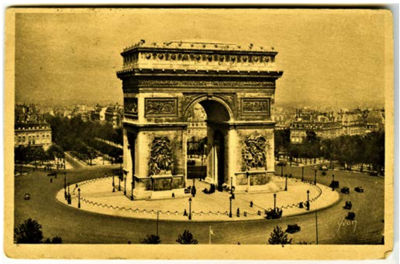
Рис. 4, 5