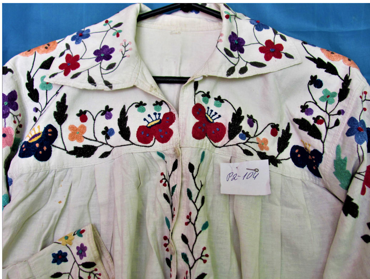
Рис. 3, 4