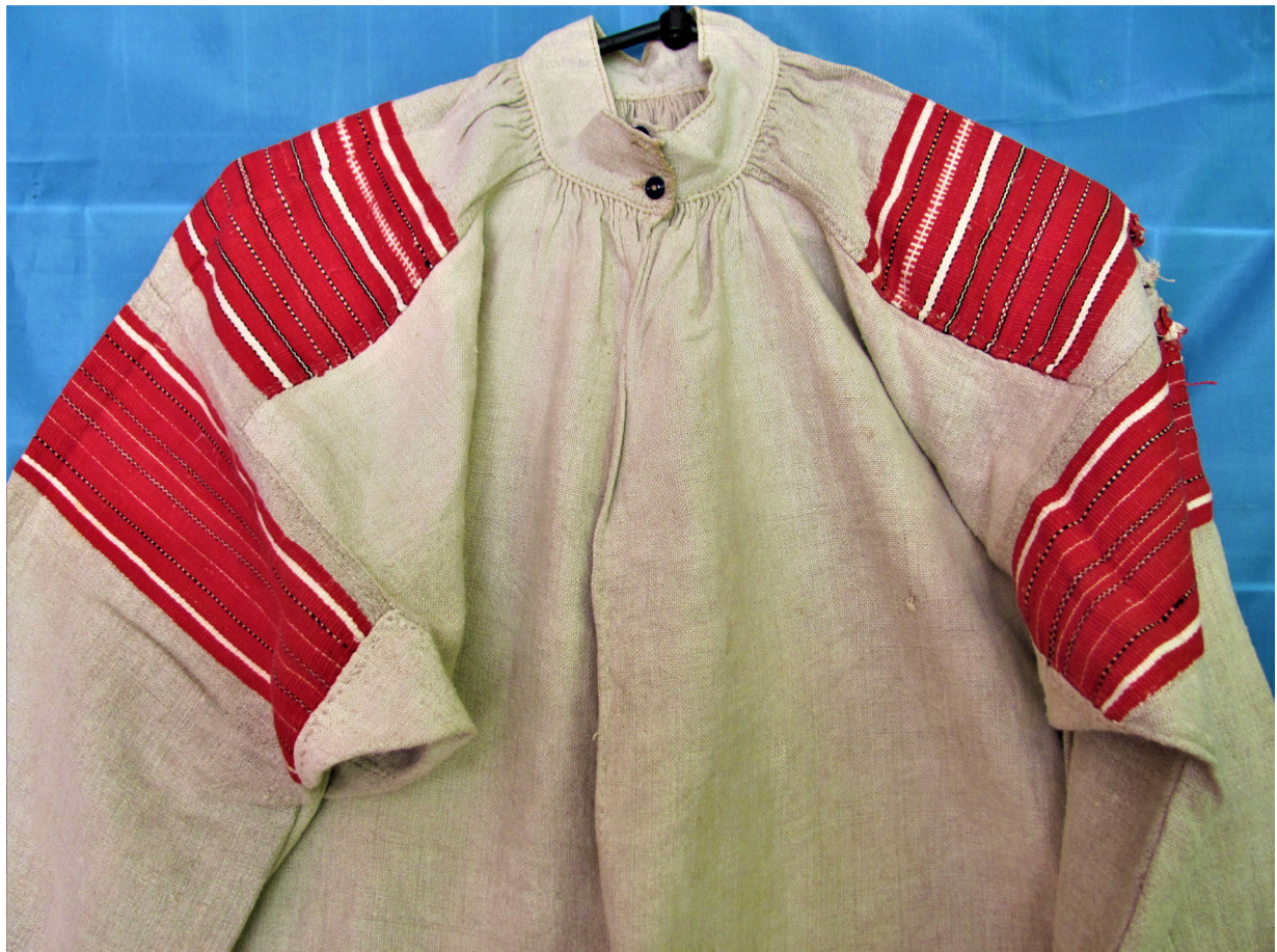
Рис. 1, 2