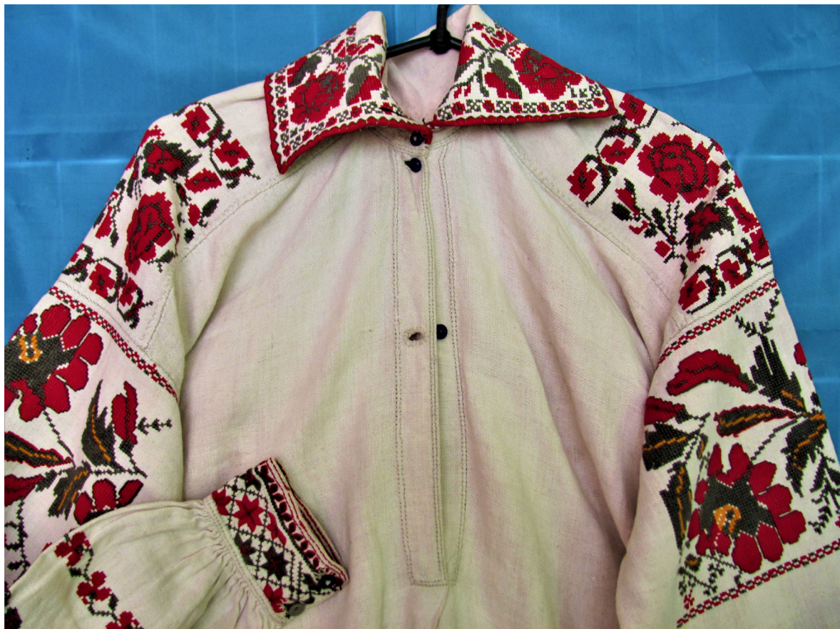
Рис. 9, 10