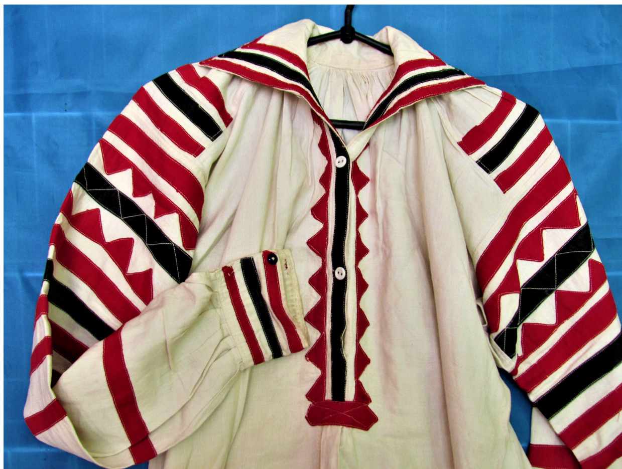
Рис. 7, 8