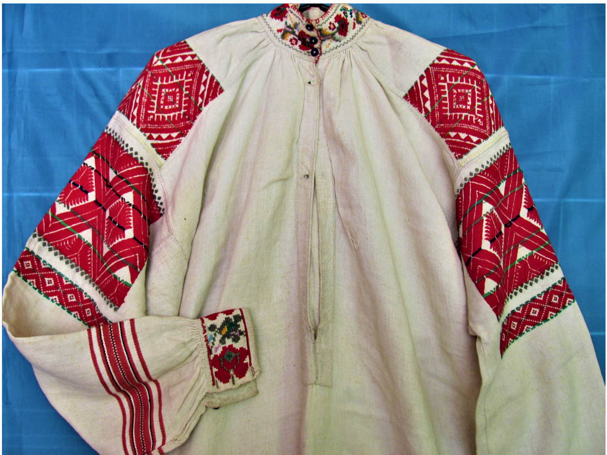
Рис. 5, 6