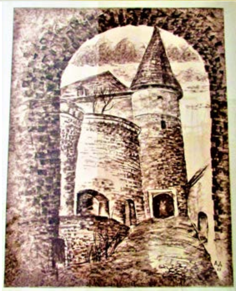
Рис. 4, 5