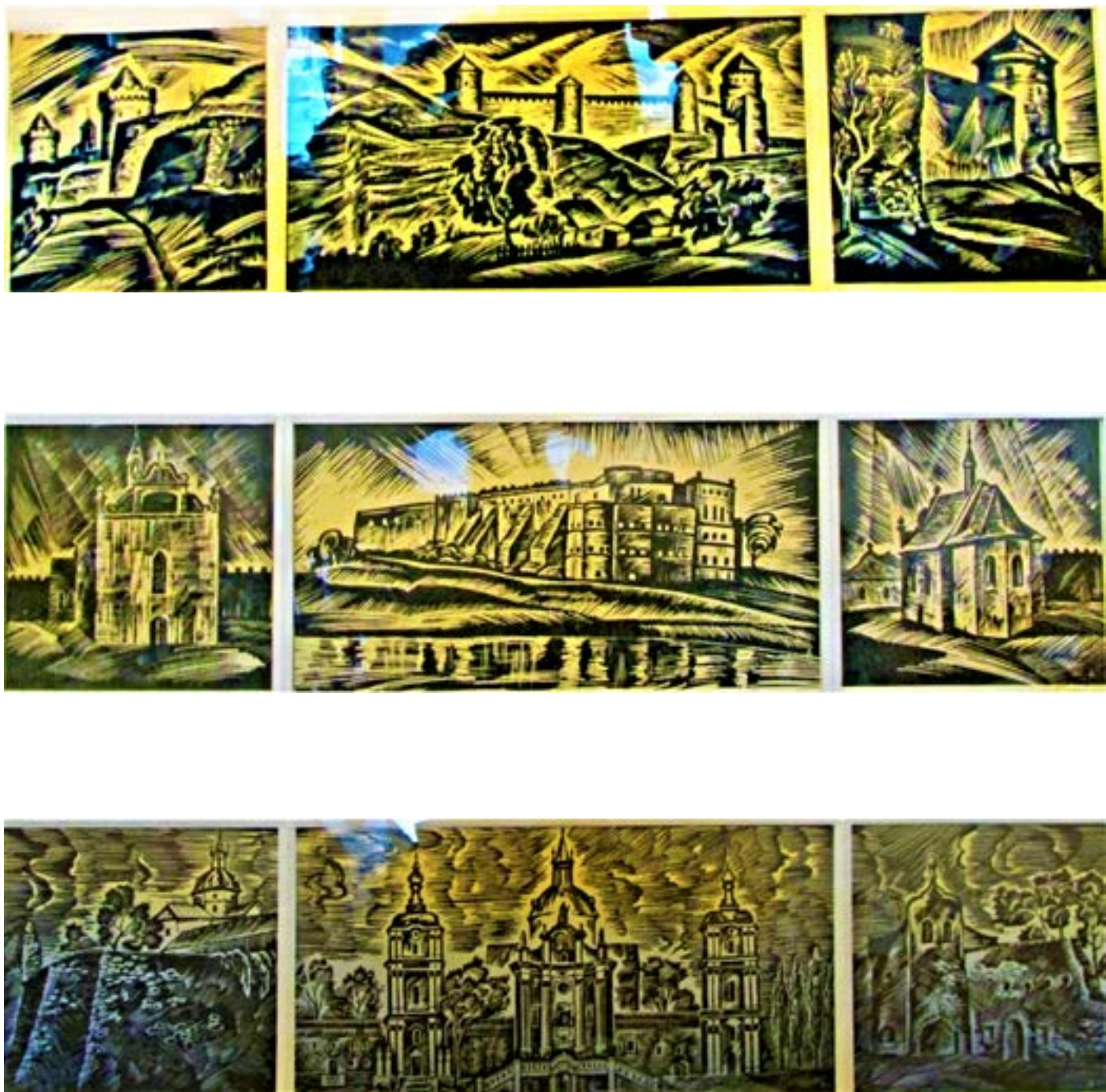
Рис. 6, 7, 8