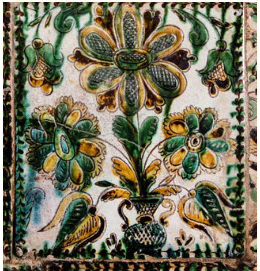
Рис. 5, 6