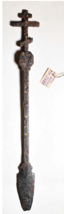
Рис. 1, 2, 3