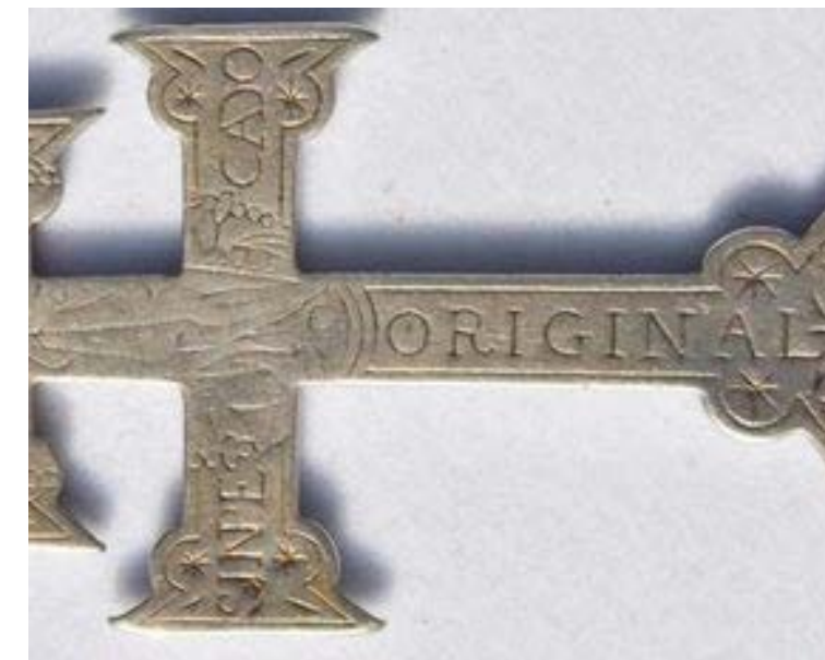
Рис. 5, 6