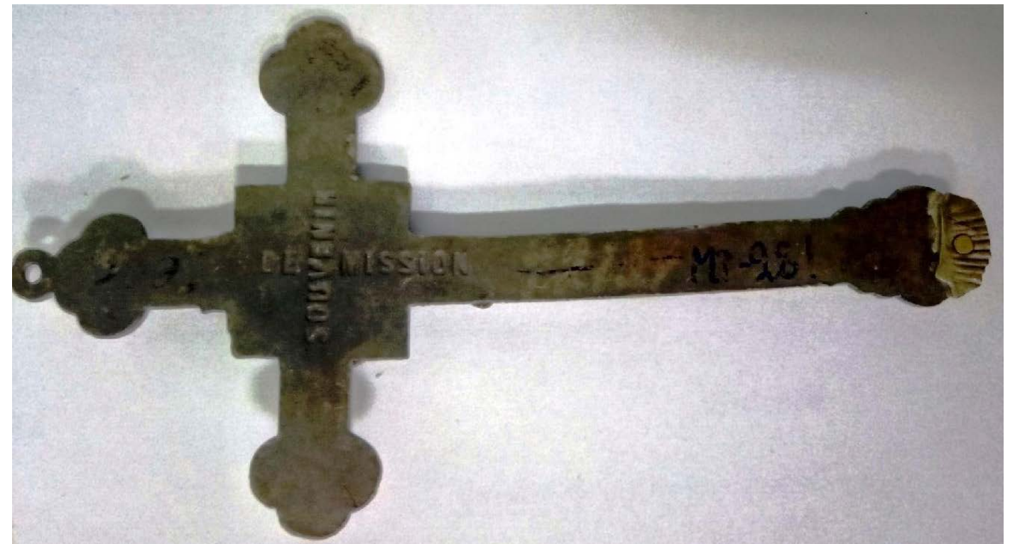
Рис. 16, 17