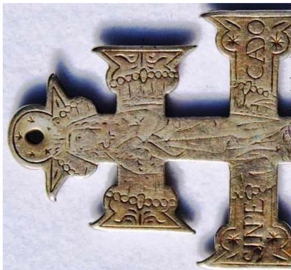
Рис. 7, 8