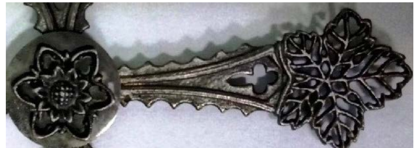
Рис. 10, 11