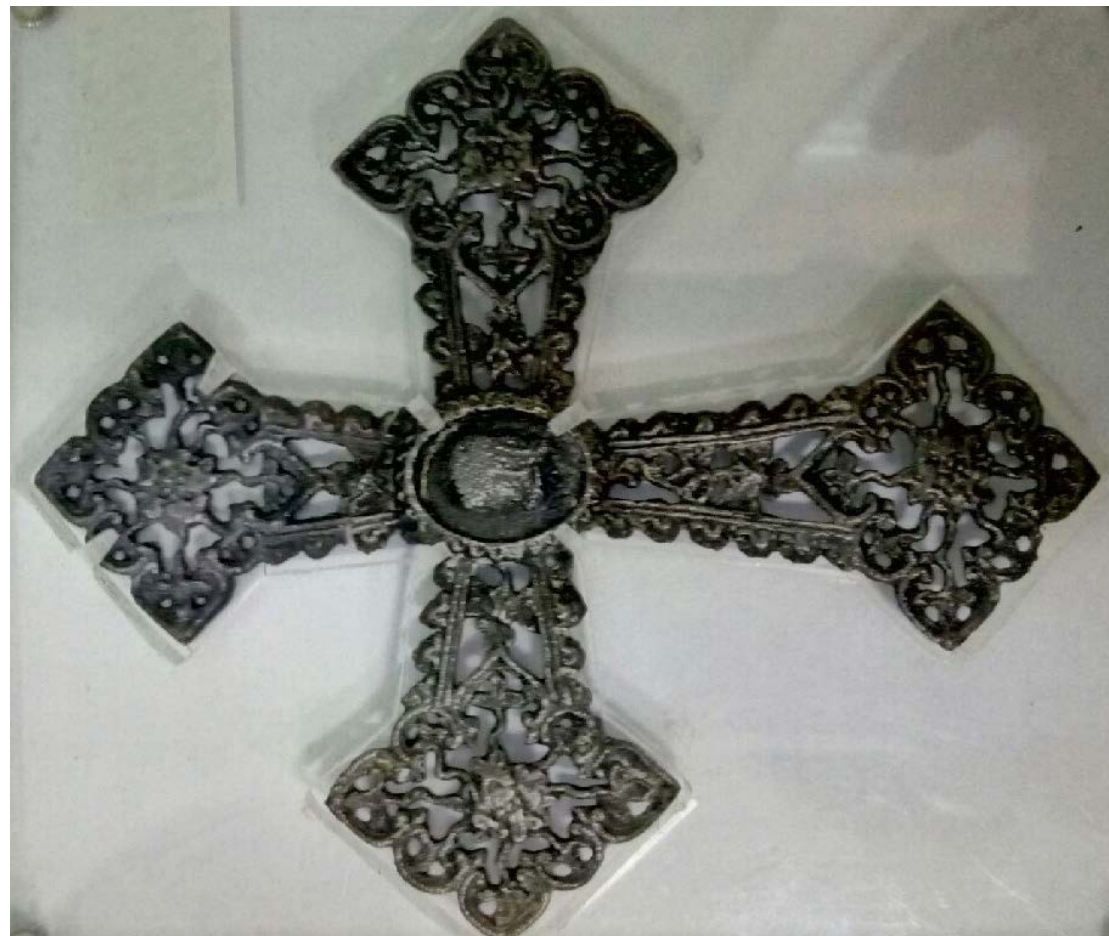
Рис. 14, 15