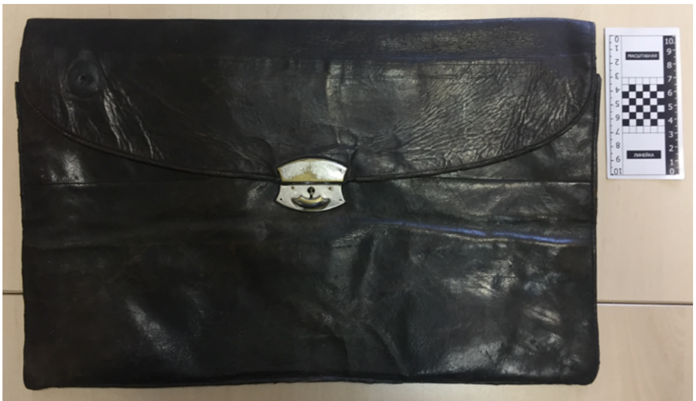
Рис. 1, 3