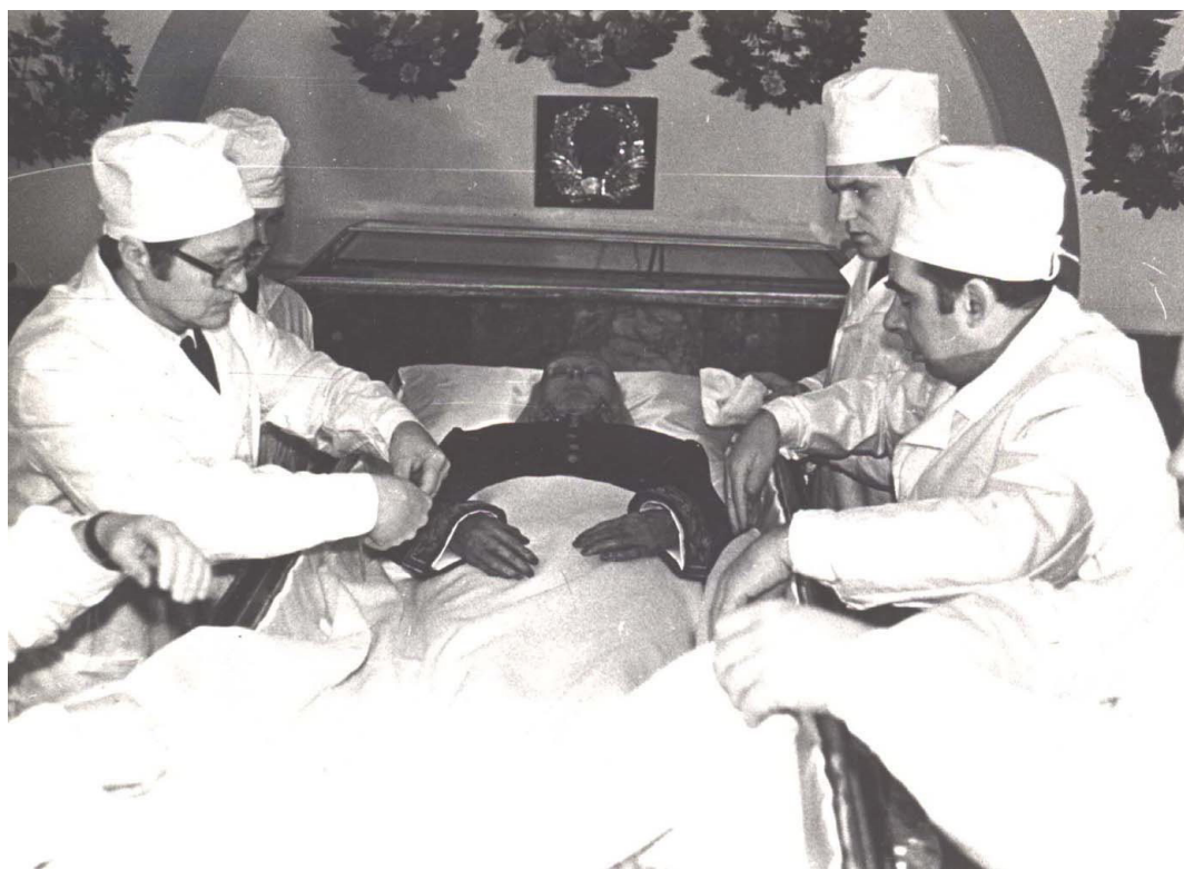
Рис. 6 та 8