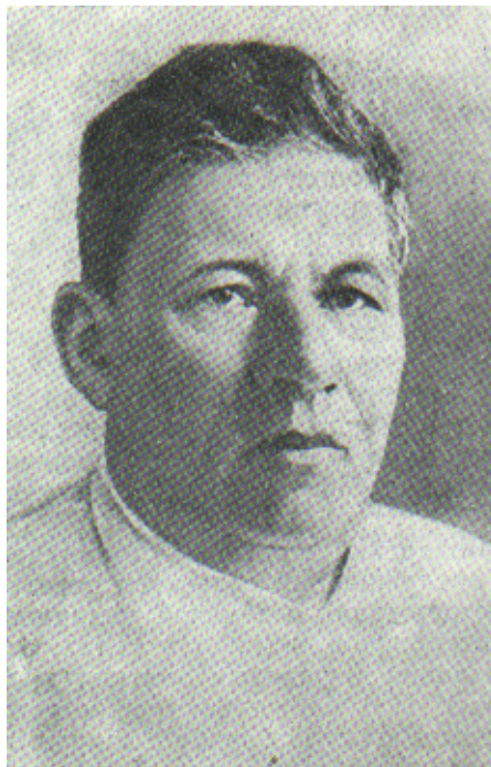
Рис 2 та 4