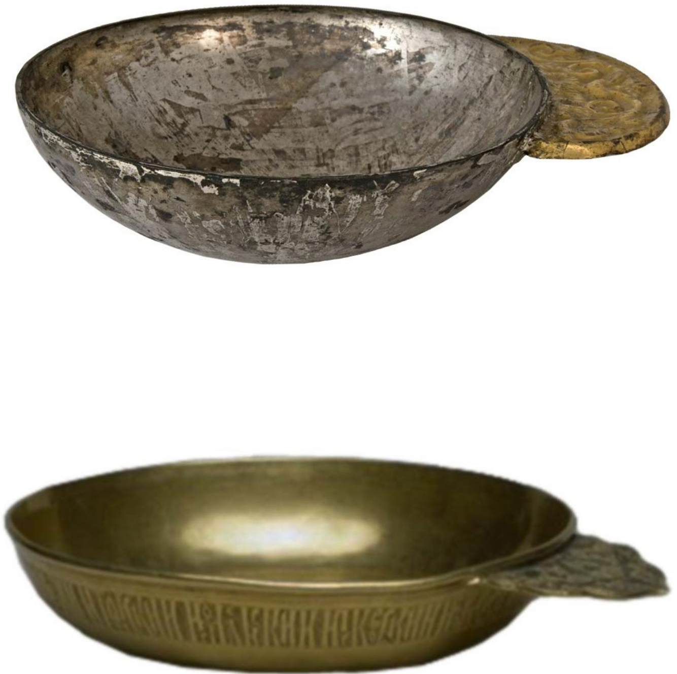
Рис. 1, 2