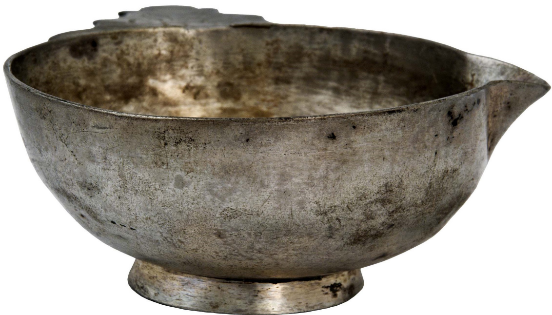
Рис. 5, 6