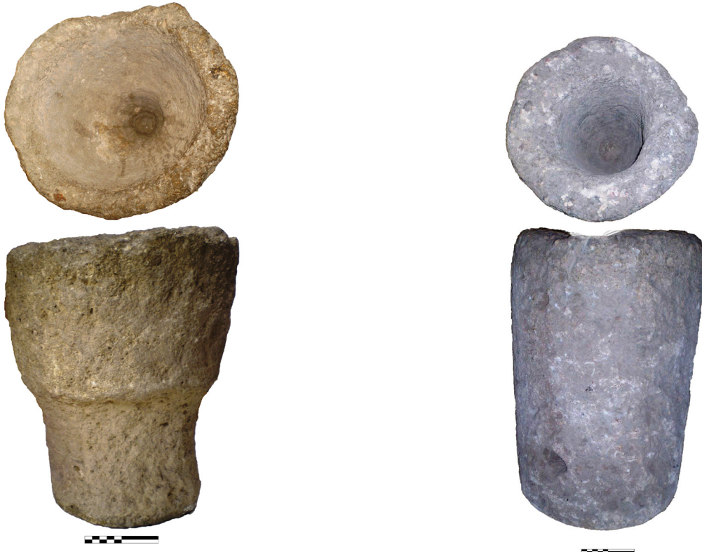
Рис. 1, 3