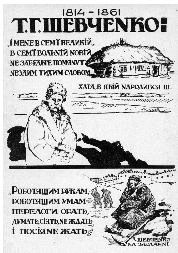
Рис. 2. Картка поштова «Т.Г. Шевченко. 1814–1861». УРСР, 1920-ті рр. (ФК-1530).

1923 р. була випущена перша поштова марка УСРР з портретом Т. Шевченка номіналом 20 крб. та написом «На допомогу голодуючим» (рис. 1). Частина коштів, перерахованих з продажу, йшла на допомогу українцям, котрі постраждали від неврожаю. Марка виконана в теплій коричневій гамі, а портрет поета оточений традиційним українським рослинним орнаментом.