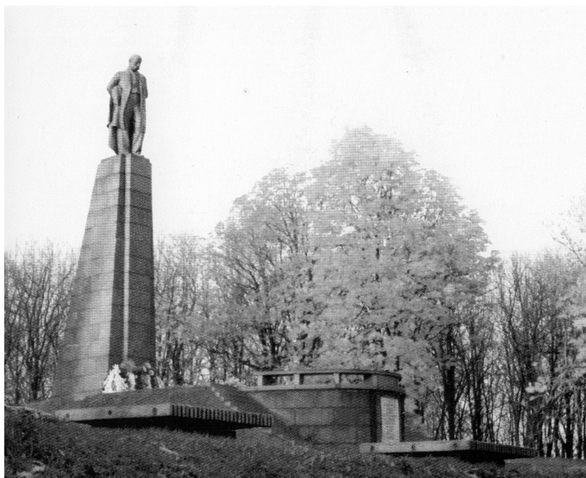
Рис. 9. Картка поштова «Пам'ятник Т.Г. Шевченку». Україна, Канів, 2010-і рр. (ФК-1474).

Інші поштові картки з колекції НМІУ (ГРЛ-3598/38; ФІЛ-306, ФІЛ-1254-1255; ФК- 1474) зображують краєвиди Канева та пам'ятник Т. Шевченку, встановлений в 1939 р. скульптором М. Манізером. Завдяки цим карткам, конвертам та маркам можна простежити історію місця, де було поховано Т. Шевченка: від чавунного пам'ятного хреста (ГРЛ- 3598/38) до сучасного пам'ятника (рис. 8, 9).