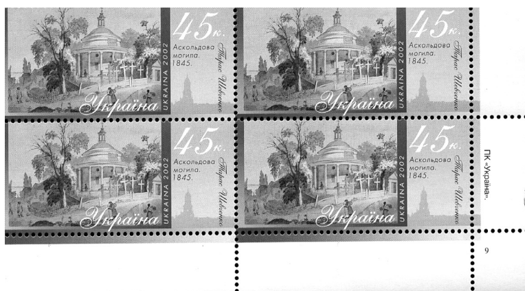
Рис. 6. Блок марок поштових «Аскольдова могила» серії «Київ очима художників». Україна, 2002 р. (ФІЛ-2018-2021).

2001 р. був виданий конверт на честь 12-річчя відновлення Тернопільського обласного Товариства української мови ім. Т. Шевченка, заснованого у 1868 р. в Галичині.