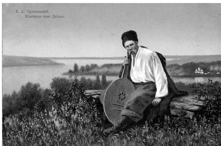
Рис. 3. Картка поштова «Шевченко коло Дніпра». Російська імперія, поч. ХХ ст. (ГРЛ-3598/40).

На початку 1920-х рр. Київський музей революції з нагоди святкування пам'яті Тараса Григоровича видав так багато поштових карток [1, 185–187], що потім їх нереалізовані екземпляри у музеї використовували як каталожні картки. На цих картках зображені хата, де народився Кобзар, і поет на засланні в Орській фортеці (рис. 2).