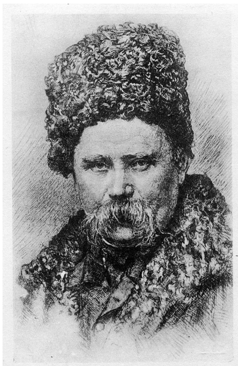
Рис. 4. Картка поштова з портретом Т.Г.Шевченка. Худ. В. Мате (за автопортретом Т. Шевченка). РСР, Москва, 1939 р. (ФК-1032).

1939 р. була надрукована художня картка з гравюри В. Мате (1856–1966), що відтворює фотографію А. Ден'єра, де Т. Шевченко представлений в шапці зі смушка і в кожусі (рис. 4).