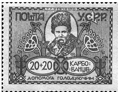
Рис. 1. Марка поштово-добродійного випуску «Допомога голодуючим». Худ. О. Моренков. УСРР, червень 1923 р. (ФІЛ–1861).

У колекції НМІУ у групах «Філокартія» (ФК), «Філателія» (ФІЛ) і «Гравюра та літографія» (ГРЛ) зберігається 35 творів шевченкіани. Поштові художні картки та марки, присвячені Кобзарю, за змістом можна поділити на оригінальні художні твори (ФК–593, ФК–1461, ФК–1462, ФК–1032, ФК–1530; ФІЛ–303, ФІЛ–329, ФІЛ–364, ФІЛ–432, ФІЛ–800, ФІЛ–857, ФІЛ–1091, ФІЛ–1211, ФІЛ–1155, ФІЛ–1257, ФІЛ–1861; ГРЛ–3598/40); репродукційні – відтворення творів живопису і графіки Шевченка (ФІЛ–747, ФІЛ–1918, ФІЛ–1919, ФІЛ–1920, ФІЛ–2018–2021; ГРЛ–3591/2) та фотонатурні – фотографії шевченківських місць (ФК–14, ФК–1021, ФК–1474; ФІЛ–306, ФІЛ–382, ФІЛ–1255, ГРЛ–3598/38).