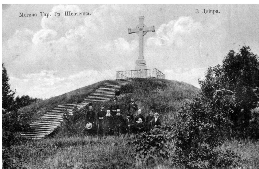
Рис. 8. Картка поштова «Шевченківська могила у Каневі». Поч. ХХ ст. (ГРЛ-3598/38).

2007 р. вийшла марка з одним з перших автопортретів Кобзаря (ФІЛ-1920), написаним в 1840 р. [6, 11]. На поштовому блоці 2013 р. «Автопортрет» (ФІЛ-2580) бачимо Т. Шевченка на засланні в Орську.