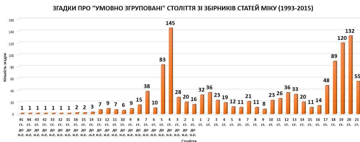
Рис. 5. Згадки про “умовно згруповані” століття зі збірників статей МІКУ (1993-2015)

Ситуація з датами зі статей у збірниках НМІУ дещо інша: про 5 тис. до н. е. – 9 згадок, 4 тис. до н. е. – 36 згадок (трипільська культура), 3 тис. до н. е. – 39 згадок (трипільська культура), 2 тис. до н. е. – 40 згадок. Автори статей приділили увагу 6–4 ст. до н. е., 1–5 ст. (зарубинецька, черняхівська культури тощо), 10–13 ст. (Русь), 16–18 ст. (козацтво), 19 ст. (демографічний вибух в Україні, швидка урбанізація, промислова революція), та особливо 20 ст. і 21 ст. Ґрунтуючись на темах досліджень, зрозумілим є переважання у статтях згадок (649) про 20 ст., адже це – час становлення української музейної справи, національного відродження, кардинальних політичних і суспільних змін, руйнівних війн, створення і розбудови незалежної України. Однак очевидними є прогалини в дослідженнях до 9 ст. до н. е. (до появи кіммерійців), 3–1 ст. до н. е., 6–9 ст. (розселення слов'ян), 14–15 ст. (Литовсько-польська доба). Відповідно, дослідникам (особливо археологам та музейникам) варто звернути увагу на ці “темні” періоди. Водночас варто зазначати, що науковцям НМІУ слід вивчати різні періоди української історії, а не лише 20 ст.