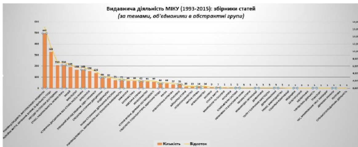
Рис. 3. Видавнича діяльність МІКУ (1993–2015) за темами, об'єднаними в абстрактні групи

Оскільки конкретних тем виявилось багато, деякі теми статей зі збірників МІКУ, якщо вони мали спільні родові ознаки, було об'єднано в абстрактні групи (рис. 3; перші 20 груп представлено в табл. 4, курсивом позначено теми, які НЕ зустрічаються у збірниках НМІУ), які дають можливість зрозуміти, що саме вивчали науковці, розвідки яких публікували у збірниках МІКУ. Найбільше статей присвячено: різновидам виготовлених людиною предметів (16,56% статей); темам, пов'язаним із релігійним життям, віруваннями, храмами та їхньою діяльністю, культом тощо (10,96%); методам і способам досліджень (7%); етносам, етнічним групам, націям та національностям, мовним групам (7%); власне музеям і їхній історії (6,40%); питанням мистецтва (5,6%); історичним наукам, історичним дисциплінам та історії конкретної науки (5,6%); археології та її історії, археологічним розкопкам і дослідженням (5,2%) тощо. Деякі теми з перших 20 абстрактних груп зі збірників МІКУ не збігаються з темами, об'єднаними в абстрактні групи, зі збірників НМІУ. Рідкісними темами в збірниках МІКУ є: економіка та економічні науки, міська історія, міжнародні організації, демографія, театр і театральне мистецтво, держуправління, право і законодавство, соціальні комунікації, медицина, культурологія, бібліографія, торговельна діяльність, транспорт, час, вимірювання часу та календар, державні фінанси, політика, сільськогосподарська діяльність. На нашу думку, дослідникам слід звернути увагу на них.