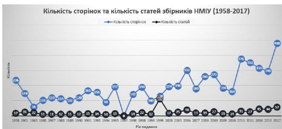
Рис. 1. Кількість сторінок та кількість статей у виданнях НМІУ за 1958–2017 рр. 3

У кожному новому виданні збільшувалася кількість сторінок і статей. Це – єдиний параметр, безперервність якого можна простежити. Кількість обліково-видавничих аркушів також збільшувалася, але маємо інформацію лише за деякі роки, що не дає можливості з’ясувати реальний обсяг матеріалу для всіх видань.