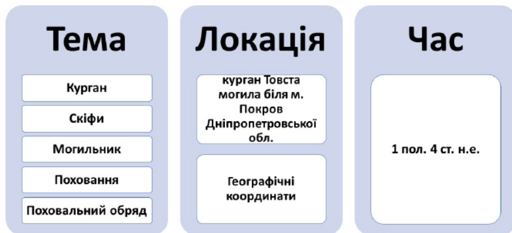
Рис. 2. Приклад основних даних, що збиралися, відповідно до гіпотези “тема – локація – час”

Одним із результатів нашого дослідження стала розробка двох відкритих онлайн баз даних: а) статей зі збірників НМІУ (659 за 1958–2016 рр.) 5 та б) матеріалів конференцій МІКУ (606 статей за 1993–2015 рр.) 6 . Обидві бази даних розроблені і створені нами для користування як співробітниками НМІУ, так і для широкого загалу. Паралельно було оцифровано всі збірники статей і матеріалів наукових конференцій, включені до цих баз даних 7,8 . Це, зокрема, має сприяти популяризації серед наукової спільноти опублікованих видань НМІУ, які виходили переважно невеликим накладом. Бібліографічні дані всіх статей були додані нами до наукометричної бази Google Scholar, що також сприятиме поширенню наукового доробку музею серед наукової спільноти.