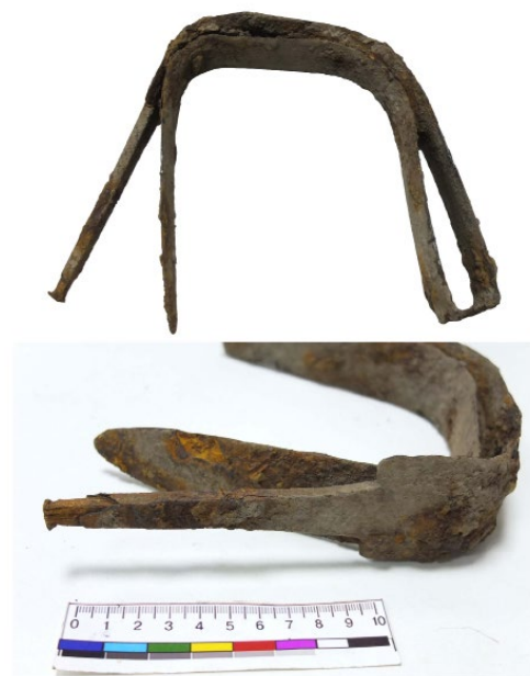
Рис. 4. Меч з поховання у Волиці.