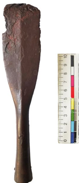
Рис. 2. Наконечник списа з поховання у Волиці.

Отже, перейдемо до опису знахідок. Обидва наконечники списів були спеціально поламані. Перший із них – ромбічний у перерізі, масивний видовжений листопадібний наконечник (довжина – 210 мм, максимальна ширина – 44 мм) (рис. 2) має загнутий край вістря. Наконечник плавно переходить у масивну втулку із розширеним кінцем (довжина – 80 мм, діаметр – 16–22 мм). На відстані 10 мм від її кінця зберігся цвях, яким втулка прикріплювалася до дерев'яного древка. За класифікацією списів пшеворської культури П. Качанівського, волицький наконечник належить до типу XIII, поширеного у фазах В2 / С1 (150–270 рр. н. е.) 5 .