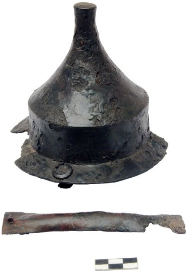
Рис. 6. Умбон та держак з поховання у Волиці.

Форму щитів германських воїнів дослідники 26 реконструюють за зображеннями на римській скульптурі. Мініатюрні копії щитів були знайдені в жіночих та дитячих похованнях пшеворської культури 27 . Так, у похованні в Надколе (Мазовія) виявлено виготовлену із залізної бляхи товщиною 1 мм модель видовженого шестикутного щита, розмірами 71 x 41 мм. У центрі платівки видавлена конічна опуклість, що імітує умбон, на звороті є імітація держача (рис. 7). На території Польщі та в інших регіонах Європи відомі нечисленні мініатюрні копії щитів інших форм 28 .