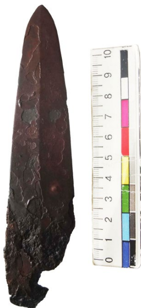
Рис. 3. Наконечник списа з поховання у Волиці.