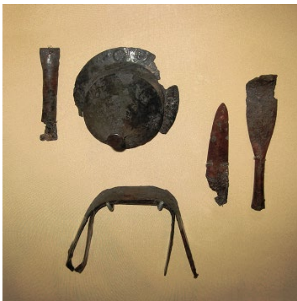
Рис. 1. Комплекс озброєння з поховання пшеворської культури у Волиці у експозиції НМІУ.

Отже, перейдемо до опису знахідок. Обидва наконечники списів були спеціально поламані. Перший із них – ромбічний у перерізі, масивний видовжений листопадібний наконечник (довжина – 210 мм, максимальна ширина – 44 мм) (рис. 2) має загнутий край вістря. Наконечник плавно переходить у масивну втулку із розширеним кінцем (довжина – 80 мм, діаметр – 16–22 мм). На відстані 10 мм від її кінця зберігся цвях, яким втулка прикріплювалася до дерев'яного древка. За класифікацією списів пшеворської культури П. Качанівського, волицький наконечник належить до типу XIII, поширеного у фазах В2 / С1 (150–270 рр. н. е.) 5 .