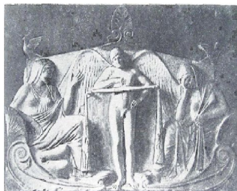
Рис. 7-8. Зображення ваг на кам'яному рельєфі. VI–V ст. до н. е.