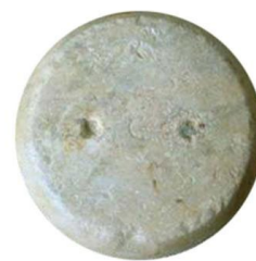
Рис. 3. Антична вагова гиря. VI–III ст. до н. е. Музей у Галілеї (Італія).