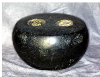
Рис. 4. Антична вагова гиря. VI–III ст. до н. е. Італія.