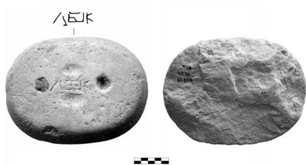
Рис. 1. Важка контрольна вагова гиря. VI–III ст. до н. е. Ольвія. Б 5–2 935.