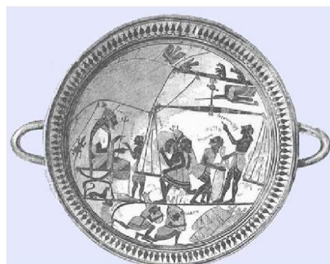
Рис. 6. Зображення ваг на посуді. VI–V ст. до н. е.