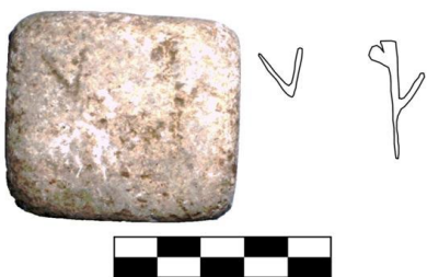
Рис. 2. Легка мармурова гиря. VI–III ст. до н. е. Ольвія. Б 5–1 834.