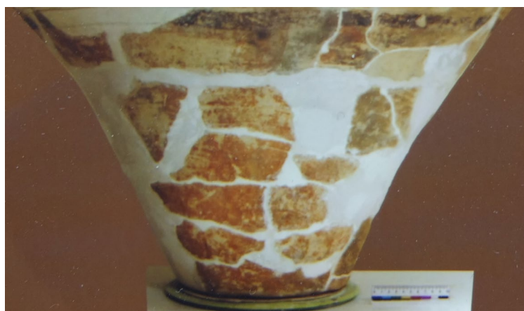
Рис. 3. Шари глиняних смуг.

Всі етапи реставрації супроводжувалися фотофіксацією. Після реставрації розміри посудини становили 68 см у висоту та 73 см у діаметрі (Рис. 5).