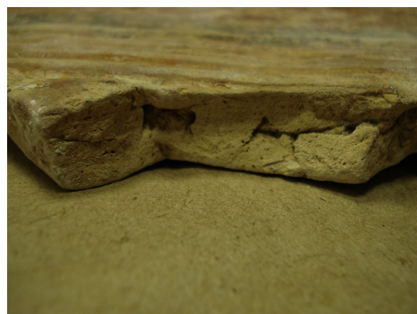
Рис. 4. Повітряні пустоти на стиках.