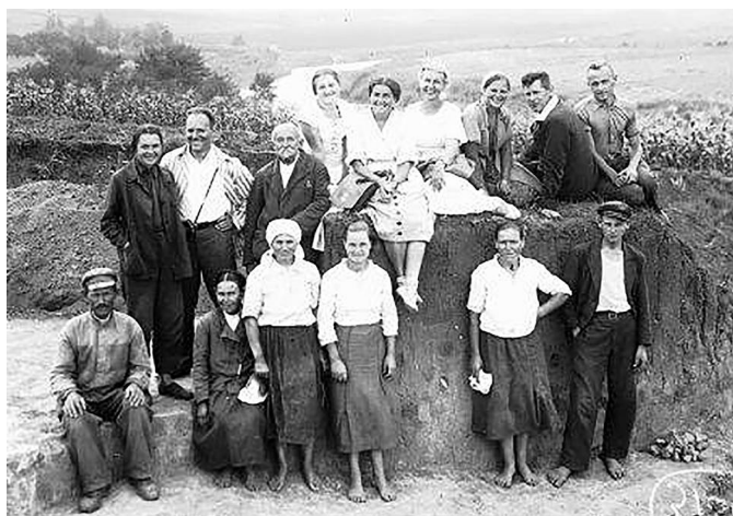
Рис. 11. Учасники розкопок у Володимирівці. 1936 р.