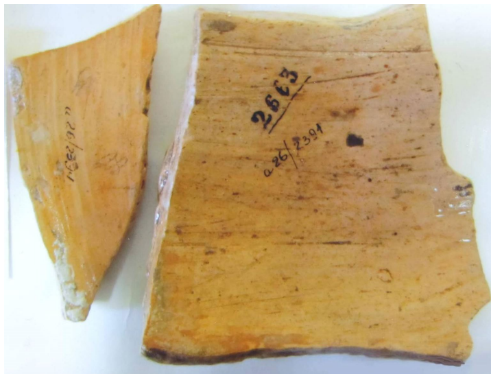
Рис. 2. Фрагменти зі старими номерами.

Під час реставраційних робіт у фондах НМІУ було знайдено ще 2 фрагменти означеної посудини, на одному з яких чорною тушшю був написаний старий номер – № 2 663, що, як згодом з'ясувалося, належав Уманському краєзнавчому музею (Рис. 2).