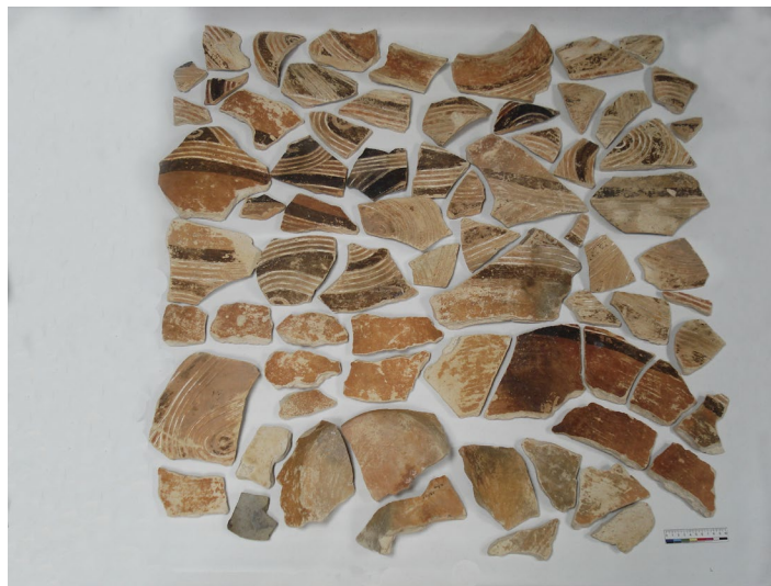
Рис. 1. До реставрації.

Пам'ятка надійшла на реставрацію у вигляді розвалу (Рис. 1). На деяких із 72 фрагментів чорною тушшю в 1970-х рр. було зазначено: "а 212 / 815 Волод. 46" (с. Володимирівка, розкопки 1946 р.).