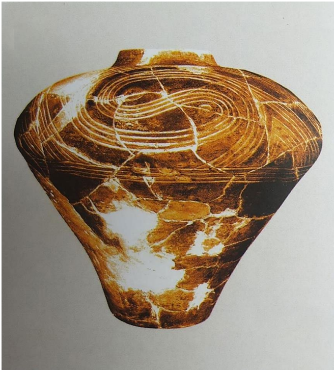
Рис. 13. Архівне фото.

Перед вивезенням до Німеччини для зменшення об’ємів посудин їх було розбито або демонтовано. Після Другої світової війни, в 1947 р. ешелон із пам’ятками повернувся в Україну – до Державного республіканського музею УРСР у Києві (нині – НМІУ) 12 . Зерновик надійшов до музею у фрагментованому стані та без паспортних даних і десятиліттями чекав на реставрацію. Нині цей унікальний експонат прикрашає експозицію музею.