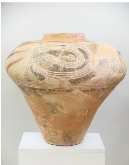
Рис. 5. Після реставрації.