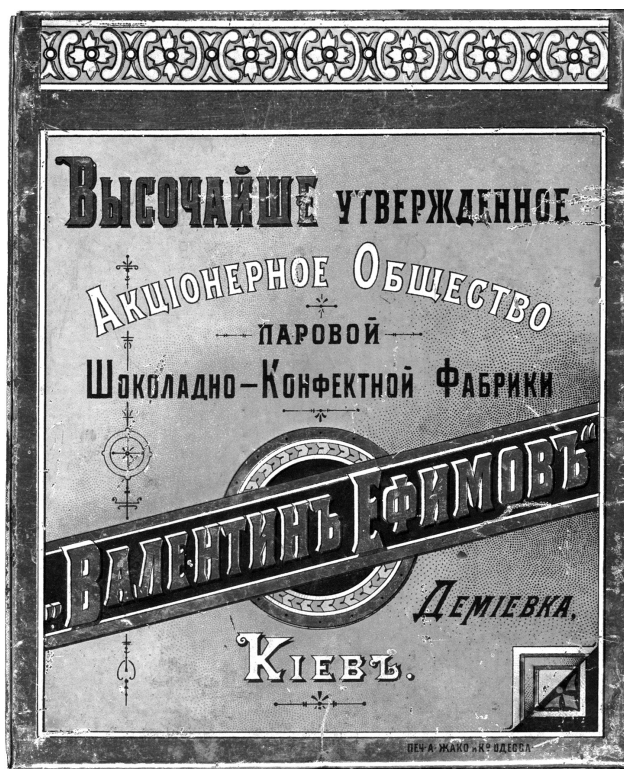
Рис. 4. Зразок пакувального матеріалу фірми «Метал. изд. А. Жако и Ко, Одесса».

Інша сувенірна коробка із з'йомною кришкою призначена для цукерок або печива. Вона має форму паралелепіпеда, грані якого прикрашені фоторепродукціями з видами Києва, виконаними у блакитно-зеленій кольоровій палітрі. На кришці зображено Олександрівський узвіз. На двох бічних гранях представлені зображення будівлі Університету св. Володимира та вулиці Хрещатик. Кожна репродукція облямована золотистою рамкою, на якій розміщено назву малюнка. На торцях коробки золотистими, чорними та білими літерами у кілька рядків зазначено назву виробника солодошів (рис. 4): «Височайше утвержденное / Акционерное Общество / паровой / Шоколадно-Конфектной Фабрики / «Валентинъ Ефимовъ» / Деміевка / Киевъ». Напис «Валентин Ефимовъ» розміщений на чорній діагональній смужі, яка перетинає медальйон чорно-золотистого кольору із блакитним орнаментальним краєм. Унизу праворуч на золотій рамці дрібним шрифтом зазначена назва виробника коробки: «ПЕЧ. А. ЖАКО и К о Одесса». По верхньому краю коробки і бічними гранями кришки нанесено орнаментальний пояс стилізованого рослинного орнаменту, візерунок якого складається із чотирипелюсткової квітки, обрамленої завитками.