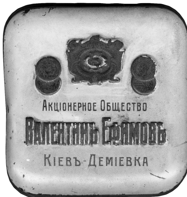
Рис.3. Зразок пакувального матеріалу фірми «Метал. изд. А. Жако и Ко, Одесса».

Одночасно з будівництвом фабрики вакси у 1880 р. було організовано виробництво пакувальних виробів для її продукції: жерстяних коробок, декорованих друкованими зображеннями та узорами. У 1881 р. було налагоджене залізо-лудильне виробництво та випуск білої жерсті [19].