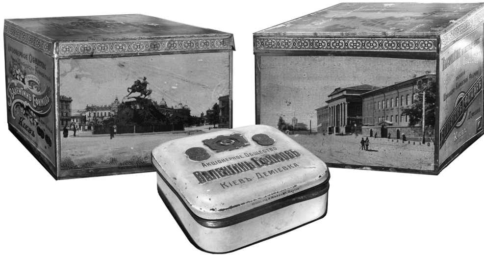
Рис. 2. Зразки пакувальних матеріалів фірми «Жако і Ко» і «М. Кока і М. Бірман».

В фондах НМІУ також зберігаються три зразки пакувальних матеріалів для продукції фабрики В. Єфімова – металеві коробки для цукерок та печива, виготовлені на заводах жерстяних виробів фірми «Жако і Ко» в Одесі та «М. Кока і М. Бірман» в Санкт-Петербурзі (рис. 2).