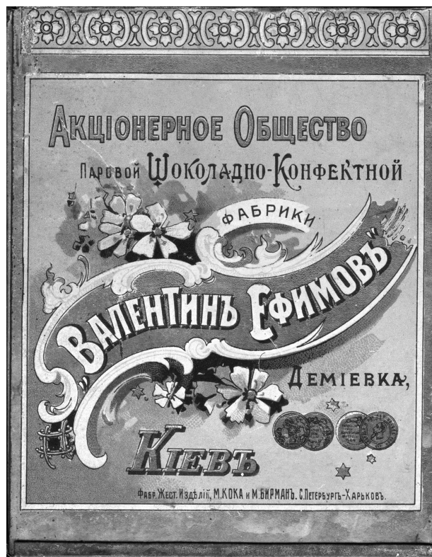
Рис. 5. Зразок пакувального матеріалу фірми «М. Кока і М. Бірман».

Сувенірна коробка фірми «М. Кока і М. Бірман» з зібрання НМІУ за формою та оздобленням подібна до одеської. На кришці коробки розміщена фоторепродукція зображення Володимирського собору у Києві, на двох бічних гранях – будинку міської Думи та пам'ятник Б. Хмельницькому. На торцях коробки золотистим, темно-синім і білим кольорами зазначено назву кондитерської фірми: «Акционерное общество / паровой Шоколадно-Конфектной / фабрики / «Валентин Ефимов» / Демієвка / Київъ» (рис. 5). Напис «Валентинъ Ефимовъ» виконано на квітковому тлі на золотистій стрічці, обрамленій білими завитками. Унизу дрібним шрифтом розміщено напис: «Фабр. Жест. Издѣлій, М. Кока и М. Бирманъ. С.-Петербургъ-Харьковъ». Під словом «Демієвка» розміщені зображення медалей виставок 1904 р. у Парижі та Брюсселі.