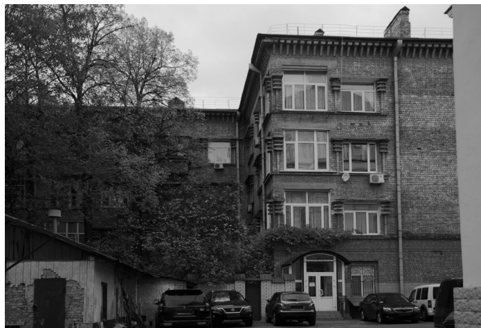
Рисунок 3. Багатоквартирний житловий будинок (ОСББ “Науковець”). Побудований 1937 р. Фото І. Зосько, 2016 р.

міум Груп” 18 , Центральна Багетна майстерня 19 , Дизайнерський тату-салон TST 20 , офіс компанії Pack&Go 21 , Інтернет-магазин “Все для ноутбуків” 22 та ТОВ “Арбуз”, що надає послуги з організації свят та урочистостей 23 .