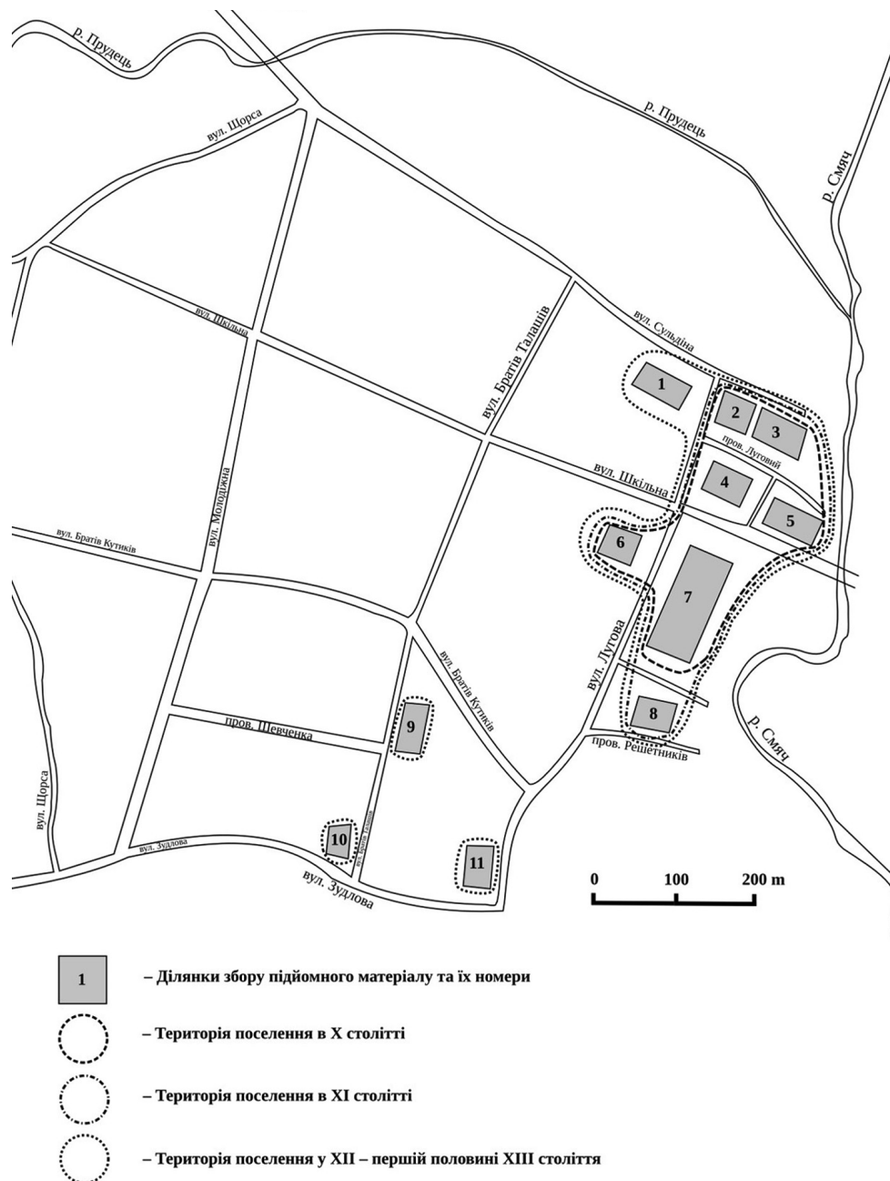
Рис. 3. Схема поселення та розташування ділянок збору підйомного матеріалу.

Поселення має ознаки прирічного, розташованого у гирлі ручаю, що впадає у річку (типи I та IV за О. Шекуном та О. Веремейчик [14, 103]). Територія поселення становить не менше 5 га і є однією з найпоширеніших за площею [14, 105].