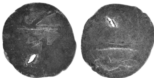
Рисунок 8. Локальна імітація монет Кримського ханства XVII–XVIII ст. № ТКВ-5884-8. Розмір: 9,1/9,7 мм. Вага: 0,14 г.