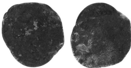
Рисунок 7. Тогочасна приватна підробка османського акче XV–XVI ст. Читабельний фрагмент легенди: “[...] лтан” від назви титулу Султан. № ТКВ-5884-70. Розмір: 10,1/10,3 мм.