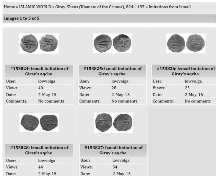
Рисунок 9. Скрін-шот електронної Бази даних монет Сходу (сайт www.Zeno.ru ). Локальні імітації акче Кримського ханства з околиць Ізмаїлу.