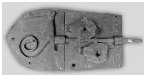
Фото 6. Замок. XVIII ст.

Із речей господарського вжитку в зібранні зберігаються накладні ковані замки XVIII ст., придбані під час експедицій 1913 р. в Чернігівську та Київську губернії. Один із них (Мт-1, ст. інв. № і 1613) з м. Барішівка Переяславського пов. Чернігівської губ. Другий – (Мт-2, ст. інв. № 1614) з с. Баландіно Чигиринського пов. Київської губ. (фото 6). Основа замків прямокутної форми, з фігурним боком та відкритим механізмом. Подібні замки були у вжитку населення європейських країн XVIII ст. Нерідко вони мали художнє оздоблення 14 . Декоративну обробку деталей механізму у вигляді невибагливого орнаменту мають і вище згадані музейні замки. Ці два предмети із зібрання Д. Щербаківського стали першими експонатами фондової групи “Метал” (записані в інвентар 15.10.1951 р.).