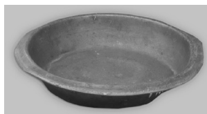
Фото 9. Тарілка олов'яна. XVII–XVIII ст.