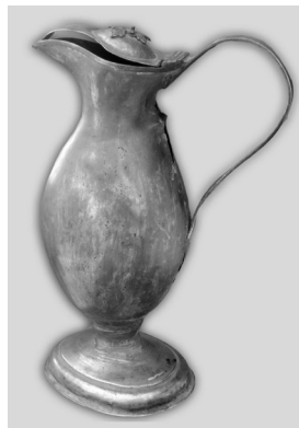
Фото 7. Глек. XVII ст.

З речей хатнього вжитку, привезених з експедицій 1912, 1913, 1914 рр., в колекції зберігаються всього три предмети. Міднокарбований, вкритий полудою глек XVII ст. овальної форми з кришкою, на піддоні (Мт-987, ст. інв. № 1132) з с. Селець Речицького пов. Мінської губ.