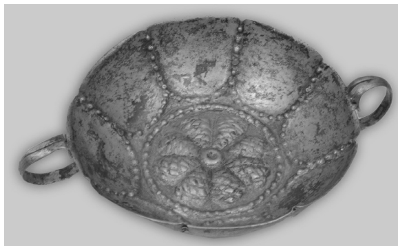
Фото 3. Сільничка. XVIII ст.

телював в Уманській гімназії. До дослідження Уманщини він залучив багатьох гімназистів та місцевих краєзнавців, створивши цілу школу фахівців у галузі музейництва та етнографії 5 . Д. Щербаківський не обмежувався дослідженням лише Уманщини. Він збирав речі і в інших місцевостях. Зібрані матеріали передавав до Київського міського музею. З переданих виробів художнього металу (бл. 40 од.) збереглися лише два предмети: сільничка XVIII ст. (Мт–2312, ст. інв. № И 404) з Полтавської губ. та лампада XVIII ст. (Мт–1078, ст. інв. № 523) з с. Марковка Ямпольського пов. Подільської губ., які були записані у 1906 та 1908 рр. (фото 3, 4) 6 .