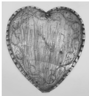
Фото 11. Вотум. XVIII ст.

Вотум (Мт–195, ст. інв. № 1758) серцевидної форми, з хвилястими краями, гравірованим оздобленням та монограмою Ісуса Христа: “INRI” (“Ісус Назарянин Цар Іудейський”). Монограма обрамлена пагоном, що в’ється, з завитками, на кінцях яких квіти, що нагадують дзвіночки. Придбаний в с. Мелени Радомишльського пов. Київської губ. у 1913 р. (фото 11).