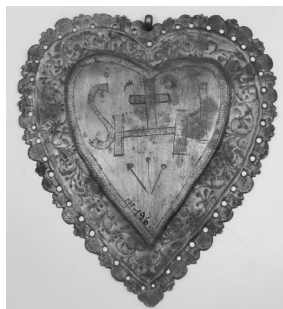
Фото 10. Фотум. XVIII ст.

У зібранні культових речей є невелика колекція вотумів, серед яких два XVIII ст. із зібрання Д. Щербаківського. Вотуми – це дари, які приносять віряни на знак прохання або подяки до чудотворних ікон. Цей звичай прийшов в Україну із Західної Європи у XVI–XVII ст. Міднокарбовані у формі серця вотуми за своїм стилем виконання відносяться до роботи народних майстрів і є виразними зразками народного мистецтва. Оздоблені бароковим орнаментом, з латинськими монограмами Ісуса Христа.