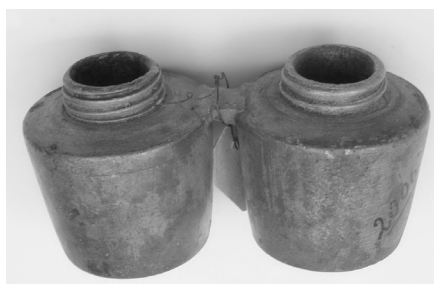
Фото 13. Посудина для миру і елею. Поч. XX ст.

Отже, проведені дослідження зібрання художнього металу НМІУ дали змогу виявити предмети зібрані Д. Щербаківським. Вони складають невелику частину з того значного загалу виробів художнього металу, який дбайливо збирав Данило Михайлович. У цій невеликій колекції зберігаються різні за призначенням побутові та культові предмети, що були у вжитку протягом XVII–XIX ст. Ця дослідницька робота – скромна данина пам'яті незвичайній людині, яка поклала своє життя на вітер музейної справи, на збереження пам'яток рідної землі.