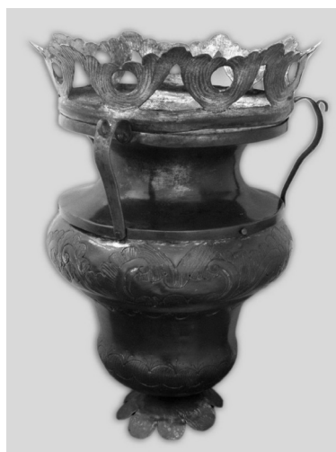
Фото 4. Лампада. XVIII ст.