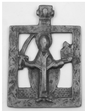
Фото 5. Іконка “Святий Микола Можайський”. XVIII–XIX ст.

Д. Щербаківський також купував для музею цікаві речі за власні кошти. Однією такою покупкою, записаною до інвентаря у 1925 р., є міднолита старообрядницька іконка XVIII–XIX ст. з прорізним зображенням Миколи Можайського на повний зріст з піднятим мечем та градом у руках (Мт–452/1, ст. інв. № 11374) (фото 5) 12 . Це одне з іконографічних зображень Миколи Мірлікійського Чудотворця. Виникнення цього образу відноситься до XIV ст. і пов'язане з легендою про спасіння м. Можайська від нападу ворогів. Захисникам міста з'явився Св. Миколай Чудотворець з мечем в руці, що налякало нападників, і вони відійшли.