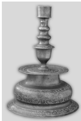
Фото 8. Свічник. XVIII ст.

(фото 7). Свічник XVIII ст. (Мт-959, ст. інв. № 1871), виготовлений з латуні та оздоблений в бароковому стилі з елементами народного мистецтва. Він придбаний в с. Вязовок Лубенського пов. Полтавської губ. (фото 8). Тарілка олов'яна XVII–XVIII ст. (Мт-970, ст. інв. № 2652) з с. Велика Бугаївка Київського пов. Київської губ. (фото 9). Це типовий зразок олов'яного посуду, який широко використовували у побуті до XIX ст., коли його почали витісняти вироби з фаянсу та порцеляни.