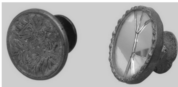
Фото 2. Запонки. Кін. XIX – поч. XX ст.

Київський міський музей був задуманий як крайовий загальнодоступний музей, де зосереджуються для наукового дослідження пам'ятки української землі з найдавніших часів до сучасності 2 . Важливе значення в популяризації українського народного мистецтва серед широкого загалу мала Перша південноросійська кустарна виставка 1906 р. У збиранні матеріалу для неї брав участь і Д. Щербаківський. Після її закриття "...мало не весь матеріал, що був на виставці, поступив у власність Київського музею старожитностей і мистецтв" 3 . Ці надходження заклали основу етнографічного відділу. Серед цього матеріалу були 20 гуцульських художніх металевих виробів др. пол. XIX – поч. XX ст.: чепраги (застібки для одягу і жіночих прикрас), пряжки до поясів, шкіряних виробів і кінської збруї та дві бойківські запонки з с. Мшанця в Галичині 4 . В їхньому оздобленні використані звичайні вжиткові речі, що надає певної своєрідності виробам. Голівка однієї запонки (Мт-586, ст. інв. № 5683) виготовлена з австро-угорської монети (2 гелери) кін. XIX – поч. XX ст., на щитку якої зображений двоголовий гербовий орел. Друга (Мт-587, ст. інв. № 5682) – з великою круглою голівкою, в яке вставлене люстерко, обрамлене вузьким латунним декорованим обідком (фото 2).