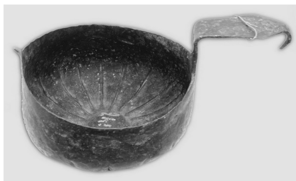
Фото 1. Ківш залізний. XVIII ст.

ської губ., який надійшов до музею у 1905 р. (фото 1) 1 .