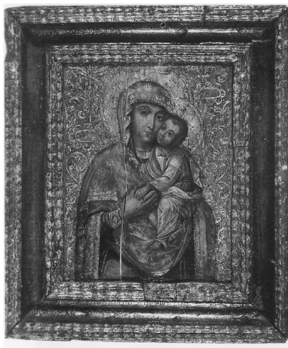
Ілюстрація 6. Богородиця Братська. Друга половина XVIII ст. З колекції Дніпропетровського художнього музею (м. Дніпро). Іл. з вид.: Українська ікона кінця XVII – початку XX століття у зібранні Дніпропетровського художнього музею. – Дніпропетровськ, 1997. – С. 31.

Попереднє припущення можна підтвердити візуальним порівнянням зображень силуетів Христа і Богородиці на іконах т. зв. зрілого бароко, зокрема на іконі Христа і Богородиці із Сорочинського іконостасу 1732 р. 50 . На ній спостерігаємо набагато вільніше трактування ликів і жестів обох фігур з одночасним відходом від іконографічної умовності (іл. 5). Крім того, на місній іконі зі Спасо-Преображенської церкви (с. Великі Сорочинці) притаманна колористика, невласлива творам попереднього часу. Тут, як і в інших творах зрілого бароко XVIII ст., за визначенням В. Овсійчука, зникає надмірність насиченого червоного, натомість з'являється рідкісна раніше блакить. Так, на згаданій іконі одяг Богородиці темно-вишневий (а не яскраво-червоний, як раніше, і як на образі з НМІУ), більше того, "художник різної сили світлом змушує мерехтіти бганти на одязі, що справляють враження вальорного збагачення" 51 . Варто також відзначити більш декорований драперій, що є рисою пізнішого часу, не властивою для ікони з НМІУ.