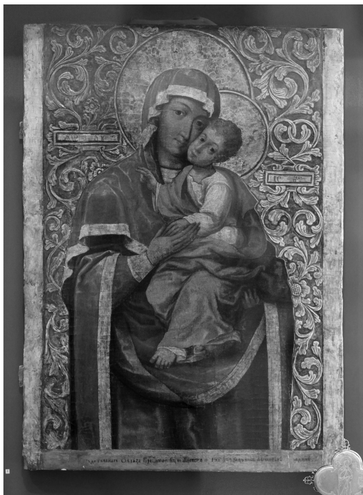
Ілюстрація 1. Богоматір Братська в експозиції НМІУ (М-1374). 2016 р.

з мотивом “вкладеної руки” походить з XII ст., однак іконографія такого типу у Візантії не набула поширення і збереглася в поодиноких неусталених зразках (наприклад, створена бл. 1350 р. намісна ікона монастирської церкви в Дечанах та дещо пізніша Богородиця з Верії у зібранні Візантійського музею в Афінах) 23 .