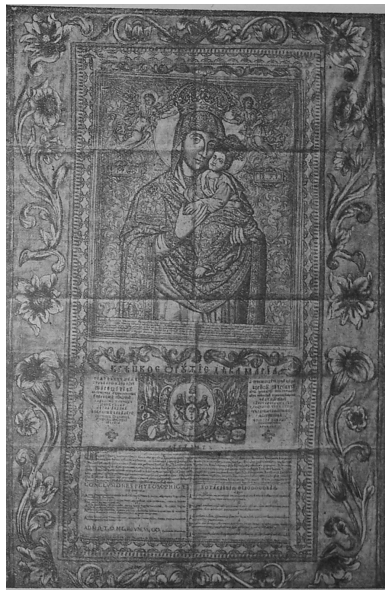
Ілюстрація 3. Гравюра з Академічних тез 1713 р. із зображенням Братської Богородиці. Іл. з вид.: Титов Ф. Типография Киево-Печерской лавры. Исторический очерк (1606–1721). – Т. 1. – К., 1918. – С. 473.

Ще одна художня деталь на іконі НМІУ має “київське походження” – акантовий орнамент на тлі ікони, що має аналогію до орнаменту образу Братської Богородиці на гравійованій ілюстрації Академічних тез 1713 р. “київського виробництва”. Ці тези були призначені для дарування за посередництва “священного богослов’я та філософії слухача” Гавриїла Михайловича сподвижнику Петра I графу Б. П. Шереметеву – покровителю київської школи, а можливо, і її колишньому студенту. Б. Шереметев на чолі російської армії готувався вирушити на війну з турками, що визначило наповнення Академічних тез. У них проголошувалося, що Братська Богородиця буде захищати життя полководця на війні з “невірними агарянами”. З цієї нагоди було вміщено її зображення 41 . На жаль, гравюра із ликом Богородиці збереглася у пізнішому друкарському відтворенні поганой якості 42 , проте її порівняння з іконою з НМІУ виявляє збіг пропорцій і форми орнаментального тла 43 (іл. 3). Така аналогія 44 вказує на уподобання митців київського кола – автор ікони з НМІУ мав відношення до київської художньої школи.