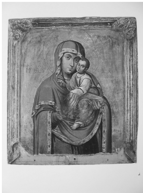
Ілюстрація 8. Богородиця Братська. XVIII ст., с. Шпитьки Київської області. Іл. з вид.: Православна ікона Росії, України, Білорусі: каталог виставки. – К., 2008. – С. 123.

Останнє дає підстави для наступної реконструкції історії образу Братської Богородиці з колекції НМІУ. Його було виготовлено впродовж першої чверті XVIII ст. як список чудотворного образу Братської Богородиці для одного з храмів Полтавщини. Замовником списку міг бути хтось із випускників Києво-Могилянської академії, де ця ікона вважалася чудотворною. Вже на Полтавщині на образі (внизу під зображенням) було виготовлено вклейку з написом, який уточнював місцезнаходження оригінального твору. Ймовірно, між 1910–1930-ми рр. ікона стала надбанням Полтавського краєзнавчого, а з 1940 р. – Полтавського художнього музею. Під час Другої світової війни її було вивезено до Німеччини (про що нагадує замаскований іншою фарбою напис “Oltawa” на звороті ікони). Після репатріації цінностей ікона з 1955 р. потрапила до колекції НМІУ і нині є окрасою експозиції залу, присвяченого історії України XVII ст.