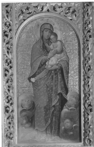
Ілюстрація 2а. Богоматір з немовлям. Ікона з іконостасу Троїцької надбрамної церкви. Поч. XVIII ст. Іл. з вид.: Скарби Києво-Печерської Лаври. Альбом. – К., 1997. – № 83. – С. 115.

з іконостасу Троїцької надбрамної церкви Києво-Печерської лаври (іл. 2а), виготовленого в 1730–1740-х рр. після пожежі в Лаврі 1718 р. 40 . Зі значним відсотком умовності можна говорити про подібність ікони НМІУ до ікони Братської Богородиці з колекції НХМУ, яка вважається найдавнішою з відомих списків чудотворного образу (іл. 2б).