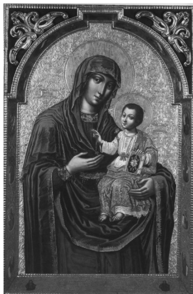
Ілюстрація 7. Ікона Богородиці “Дороговказниці” з іконостасу церкви Воздвиження Чесного Хреста монастиря Скиту Манявського. 1698–1705 рр.

Таким чином, особливості акантового орнаменту, співвідношення кольорів, трактування образів Христа і Богородиці на іконі з НМІУ демонструють художні смаки та уподобання періоду першої чверті XVIII ст. Верхньою хронологічною межею ікони можна вважати 1730-і рр.