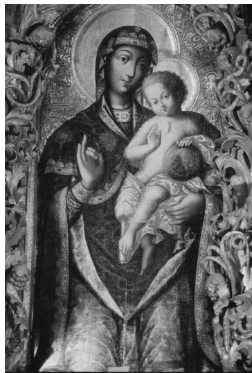
Ілюстрація 5. Богородиця намісна 1732 р. Іконостас Спасо-Преображенської церкви, с. Великі Сорочинці. Іл. з вид.: Овсійчук В. Українське малярство X–XVIII століть. Проблеми кольору. Львів, 1996. – С. 411.

Однією з ознак, за якою можна встановити приблизну дату образу з НМІУ, є типаж зображення Христа і Богородиці. Порівняно з Братською Богородицею з іконостасу Троїцької надбрамної церкви 1730–1740-х рр. в іконі з НМІУ витримано умовність силуетів обох фігур, що проявляється в лініях на одязі, драперіях і трактуванні ликів (іл. 1 і 2а). Згаданій лаврській іконі властивий більш вільний показ жестів і “руху” фігур: змінюються довжина фаланг пальців, а лики Христа і Богородиці подано в іншому взаєморозміщенні (зокрема, інша притуленість облич). Матір Божа правою рукою підтримує ніжку Христа – одна з перших “редакційних змін” в іконографії Братської Богородиці пізнішого часу. Натомість у образі з НМІУ цього ще немає: тут дотримана умовність силуету, традиційно довгі фаланги пальців і не відчувається свобода трактувань, властива творам зрілого бароко XVIII ст. Отже, ікона НМІУ з’явилася напередодні 1730–1740-ми рр. 49 .