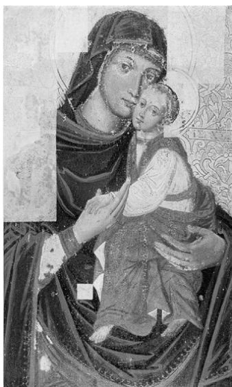
Ілюстрація 4. Образ Богоматері з Білостоцького Хрестовоздвиженського монастиря Волинської обл. Поч. XVIII ст.

фії із заміною “ять” на “ї” – Я. З.] 45 . Такий запис з уточненням топографії монастиря – рідкісний. Зазвичай при згадці Братського монастиря в документах чи у виданнях XVII–XVIII ст. обмежувалися позначенням “київський”. Уточнення “иже на Подолі” свідчить про те, що автор запису знав розташування Києво-Братського монастиря. Ця деталь також дає підстави стверджувати, що ікону створювали не для київських храмів, адже киянам і так відомо, що такий монастир у місті один. Ймовірно, образ призначався для Київщини, а, можливо, і для Полтавщини. Його могли замовити в Києві для певного місцевого храму і, відповідно, вже на місці підписати образ.