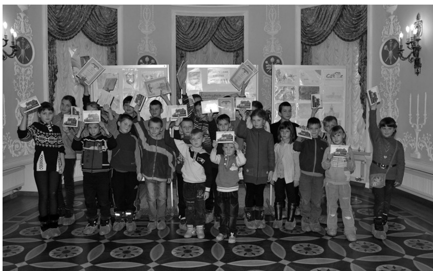
Рис. 7. Учасники конкурсу малюнка «Гетьманський Батурин – очима дітей» до Міжнародного дня музеїв, 14 травня 2014 р.