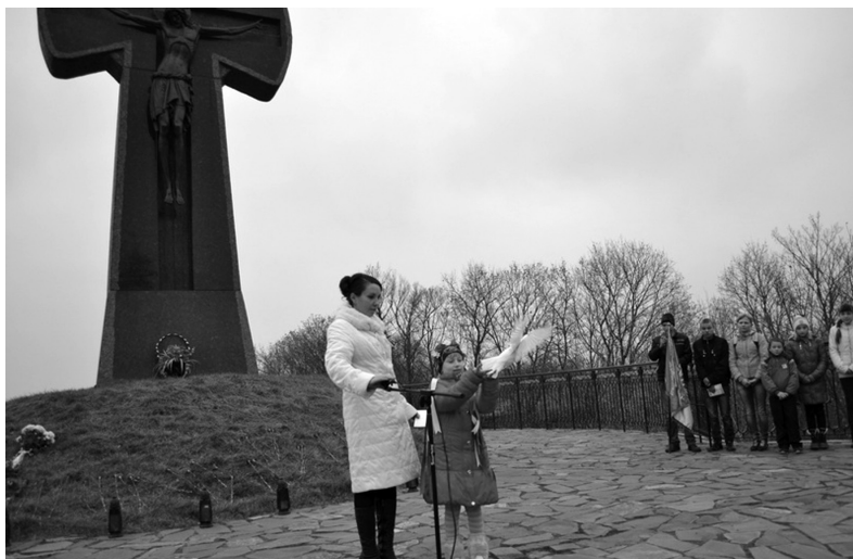
Рис. 4. День пам'яті Батурина, 13 листопада 2014 р.

З 2013 р. заповідник вийшов на новий, більш різноманітний, рівень співпраці із дитячою аудиторією, запропонувавши їй участь у проведенні науково-просвітницьких заходів. Від дитини вимагається не лише роль пасивного глядача/слухача, але і творча, комунікативна участь у проведенні заходу: підготовка виступу-розповіді, вивчення і декламування поетичних творів патріотичного спрямування, творів місцевих авторів, виконання музичних композицій (рис. 1). Кілька років триває творча співпраця заповідника із Батуринською філією Бахмацької районної школи мистецтв, Батуринським будинком культури, Батуринською філією №4 Бахмацької бібліотечної системи (рис. 2). Закладом щороку проводиться 20–27 науково-просвітницьких заходів, кількість глядачів і учасників сягає 3000 осіб, приблизно половина з яких – діти (рис. 3, 4), при тому, що населення Батурина становить всього 2400 осіб.