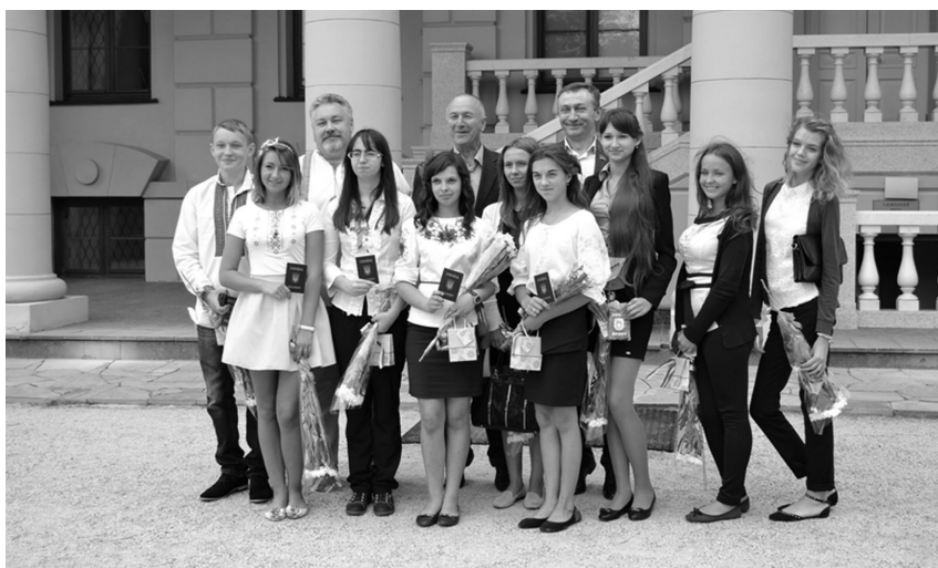
Рис. 10. Отримання паспортів з нагоди Дня прапора і Дня Незалежності України, 21 серпня 2014 р.

«... Развитие образовательной миссии музея неотделимо от процесса его участия в решении проблем современного общества» [2, 38]. Вважаючи своїм обов'язком говорити з дітьми про сучасну трагедію України, для учнів організовані два щорічні конкурси малюнка на асфальті біля палацу К. Розумовського «Козачата за мир!» та виготовлення дітьми молодших класів поштових листівок до Великодня для воїнів АТО (рис. 9).