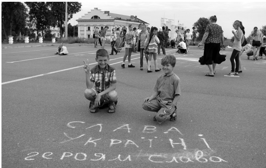
Рис. 9. Конкурс малюнка на асфальті до Дня захисту дітей «Козачата за мир!», 1 червня 2014 р.

Заповідником розроблені екскурсії для різних вікових категорій учнівської молоді. У період шкільних канікул, екскурсія-квест «Таємниці Цитаделі» та екскурсія-гра «Лицарі українських степів», були апробовані серед учнівських груп молодшого і середнього шкільного віку Конотопського і Бахмацького р-нів. Після екскурсій проводилося опитування учасників і більшість відгуків (як дітей, так і дорослих) була позитивною. Незначні зауваження автори екскурсій і науково-методична рада заповідника врахувала при остаточному затвердженні методичних розробок екскурсій.