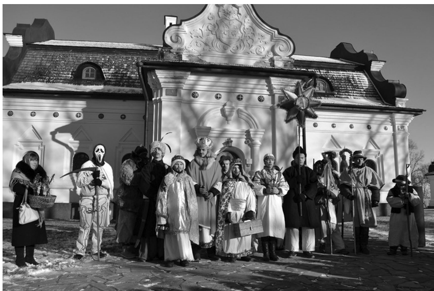
Рис. 11. Виступ вертепників на святковому заході «На гостинах у Гетьмана», 7 січня 2014 р.

«...Зазначимо, що музейна педагогіка в сучасному суспільстві знань у контролі і взаємодії із школою... створює нове середовище для навчання... є важливим засобом для розвитку толерантності і поваги до інших культур» [3, 6]. Виховуючи в дітях повагу до українських духовних національних традицій, не забуваємо виховувати повагу до європейських традицій. Вже чотири роки відзначаємо захід «На Різдво до Гетьмана» з участю колективів вертепників дитячих духовних центрів Батуринських Свято-Покровської та Воскресенської церков (рис. 11). Також було проведено захід «Нікого в світі не любив так» з нагоди Дня закоханих із залученням учнів-старшокласників, які відтворили сцену українського народного сватання (рис. 12). У нинішньому році заповідником започатковано традицію святкування Дня Європи в Україні.