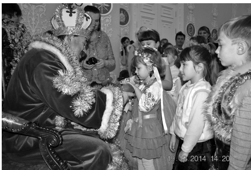
Рис. 3. Захід в палаці К. Розумовського «Ой, хто, хто Миколая любить?», 19 грудня 2014 р.

«...Одним из типов взаимодействия могут стать партнерские отношения с обязательными образовательными учреждениями» [2, 32]. З 2012 р. НІКЗ вирішив розширити і легалізувати співпрацю зі школами, уклавши угоди про гуманітарну співпрацю із ЗОШ I-III ст. та спеціальною ЗОШ I-II ст. У лютому 2012 р. було вирішено укласти аналогічну угоду з відділом освіти Бахмацької районної державної адміністрації. Кожний науковий відділ налагодив співпрацю із 1–2-ма сільськими школами Бахмацького р-ну і тепер «шефською» увагою охоплено сім сільських навчально-виховних комплексів.