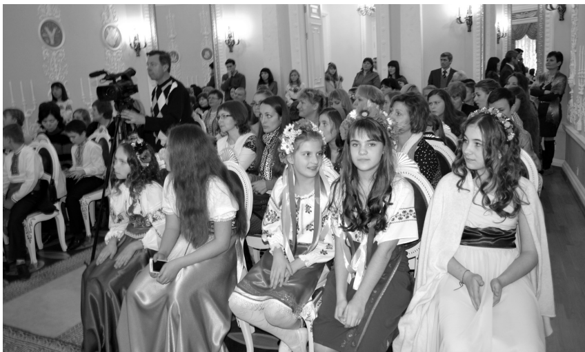
Рис. 6. Учасники IV Обласного музичного фестивалю молодих виконавців ім. А. Розумовського, 22 жовтня 2015 р.