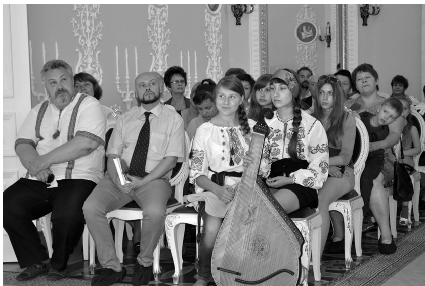
Рис. 2. Захід з нагоди Конотопської битви, 27 липня 2014 р.

ЗОШ розробив інтерактивну екскурсію-груемМузею археології Батурина «Музейні історії для найменших». Цікавинкою екскурсії стала можливість для дітей відчутися справжнім археологом: під керівництвом музейного педагога покопирсатися у «скрині скарбів», де у піску задалегідь підготовлені дрібні археологічні знахідки із відвалів розкопів. Щасливому «шукачу скарбів» дозволяється взяти знахідку з собою як сувенір. Наприкінці розповіді, адаптованої до психологічних і вікових особливостей дітей, екскурсивод роздає дітям домашнє завдання – розмалювати на відповідну тематику, щоб закріпити отримані знання.