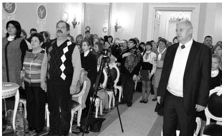
Рис. 5. III Обласний музичний фестиваль молодих виконавців ім. А. Розумовського, 22 жовтня 2014 р.