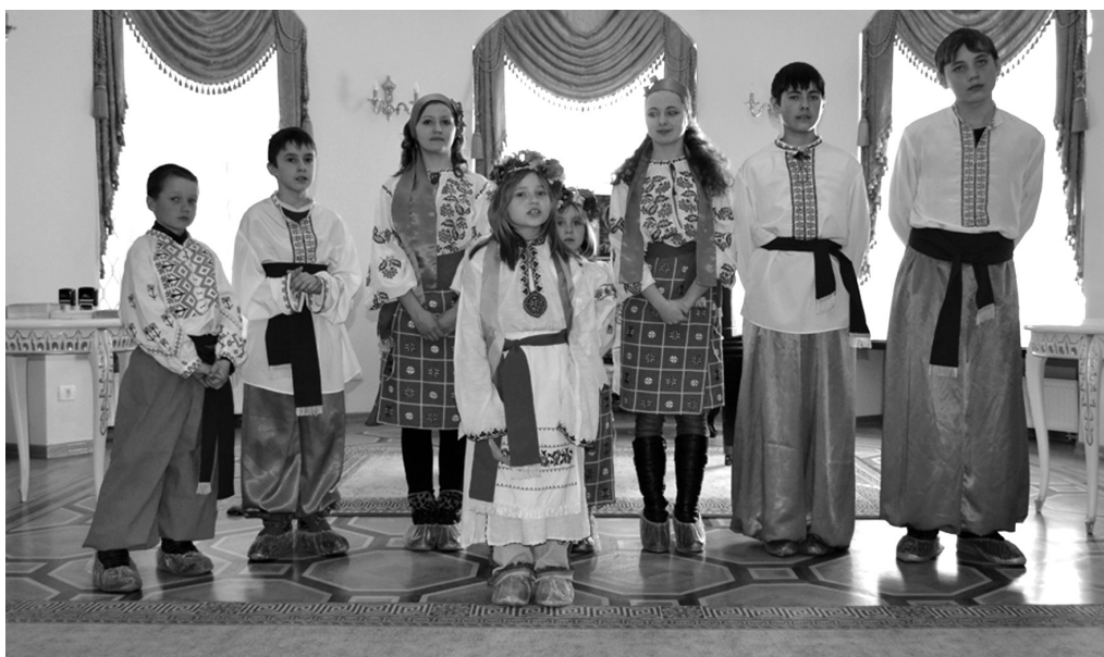
Рис. 1. Захід в палаці К. Розумовського «Ох, не однаково мені» до 200-річчя з дня народження Т. Шевченка, 9 березня 2014 р.

НІКЗ «Гетьманська столиця», створений 2007 р. на базі Батуринського державного заповідника «Гетьманська столиця», зробив все, щоб відповідати сучасним вимогам до музею як освітньо-виховного, комунікативного, рекреаційного закладу. У зв'язку з військовою агресією РФ за останніх два роки зростає суспільна потреба у виховній роботі молодого покоління і саме це питання вважаємо найбільш актуальним для сучасної музейної педагогіки.