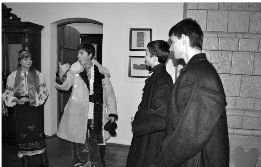
Рис. 12. Сценка українського сватання на заході «Нікого в світі не любив так», 14 лютого 2015 р.