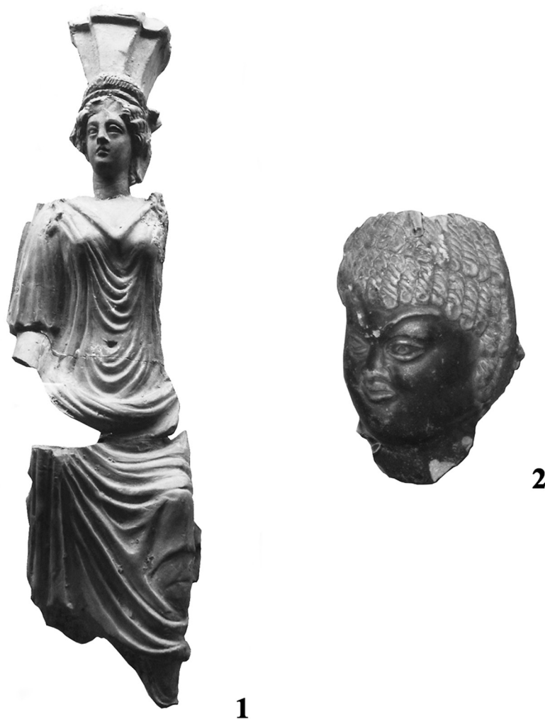
Рис. 4. Теракоти пізньоелліністичного та римського періодів.

8. Жіноче погруддя – Деметра(?) – БЗ–2828 (рис. 3-2). Обличчя з м'яко модульованими рисами: чоло високе; очі глибоко посаджені; нижні повіки згладжені; ніс масивний; рот великий з пухкими губами; щоки трохи вдавлені; підборіддя важке. Одягнений у хітон з глибоким трикутним вирізом на грудях. На голові – калаф у формі перевернутого зрізаного конуса, прикрашений рельєфним листям. Навколо голови – пов'язка, декорована поперечними насічками. Над чолом – вінець з наліпним листям та двома коримбами. Калаф, пов'язка, вінець є атрибутами богині Деметри. Поверхня фігури вкрита ангобом (висота 186 мм, ширина головного убору 80 мм). Аналогічна теракота, знайдена на агорі Ольвії, датується IV–III ст. до н. е. [10, 99; 5, 41].