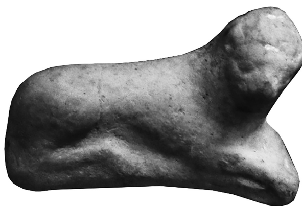
Рис. 1. Теракота пізньоархаїчного періоду.

Серед представлених в експозиції речей до пізньоархаїчного періоду (поч. VI – поч. V ст. до н. е.) належить: