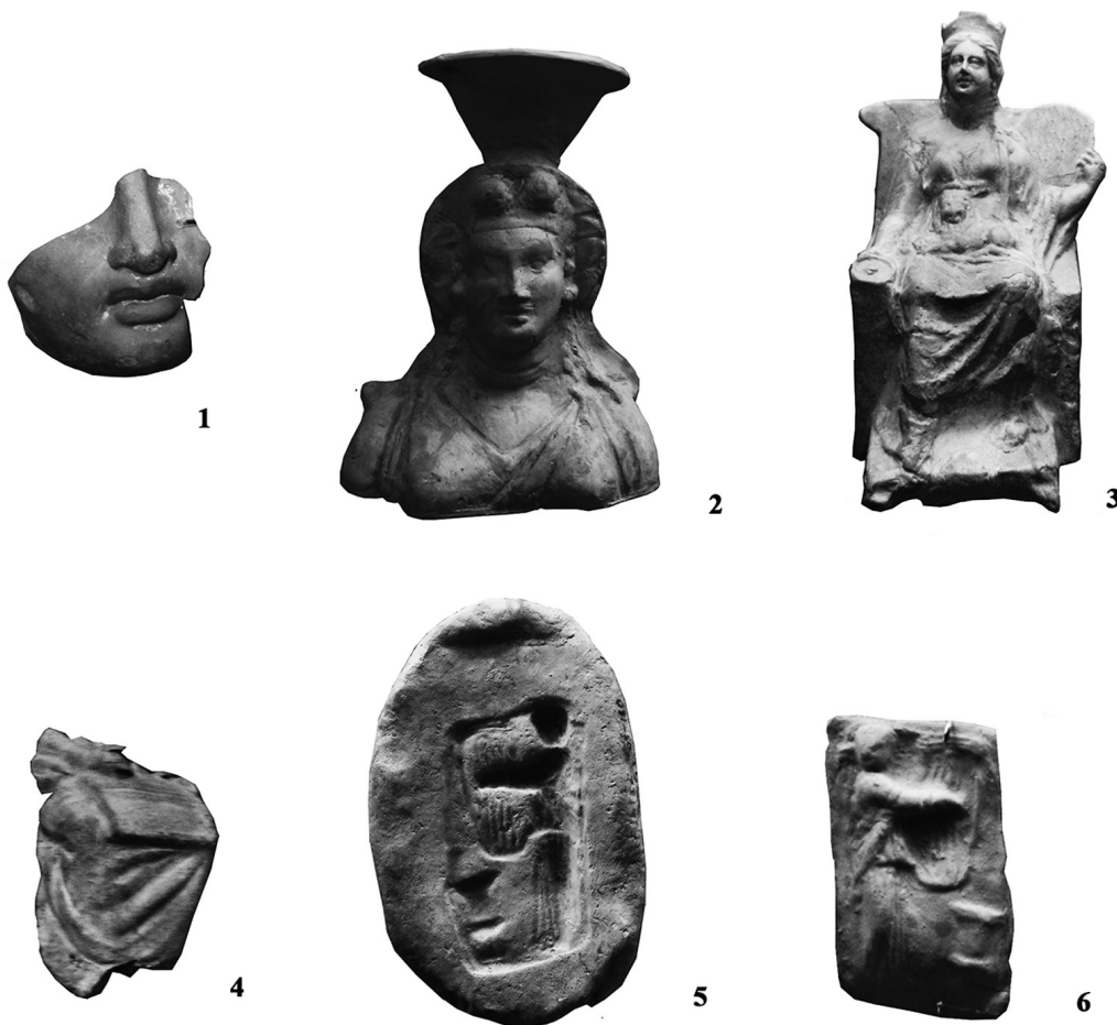
Рис. 3. Теракоти елліністичного періоду.

5. Жіноча голова – Деметра(?) – Б3–2831 (рис. 2. 4). У діадемі з трикутними виступами, з кучерявим волоссям, поділеним прямим проділом, з сережками у вухах. Обличчя овальне, трохи подовжене, з крупними, чіткими рисами; надбрівні дуги трохи заокруглені; очі невеликі; ніс прямий, масивний; рот великий з пухкими губами; підборіддя важке. На обличчі залишки білої фарби (висота 53 мм). Аналогічне зображення голови знаходиться у Державному Ермітажі і датується першою пол. IV ст. до н. е. [10, 87; 5, 54].