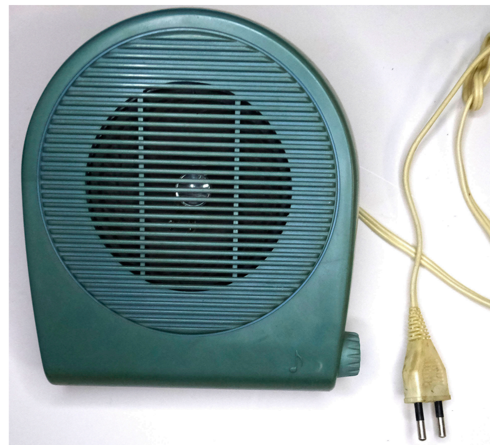
Рис. 9. Гучномовець «Полонина АГ-303». СРСР, УРСР, Ужгород, завод «Тиса», 1991 (НМІУ, Р-1341)

Наступним етапом стало виробництво із другої половини 1950-х років лампових радіоприймачів та радіол (радіола – пристрій, що поєднував можливості радіоприймача та програвача вінілових дисків, або ж платівок). Серед перших марок радіол українського виробництва були: «Донець» (1955 р. випуску), «Харків» (1957, Харківський приладобудівний завод ім. Т. Шевченка; Рис. 10 ), «Весна» (1957, Дніпропетровський радіозавод). Згодом цей перелік поповнився радіолами: «Дніпро-58», «Мрія», «Промінь», «Чайка» (Дніпропетровський радіозавод) та іншими 23 .