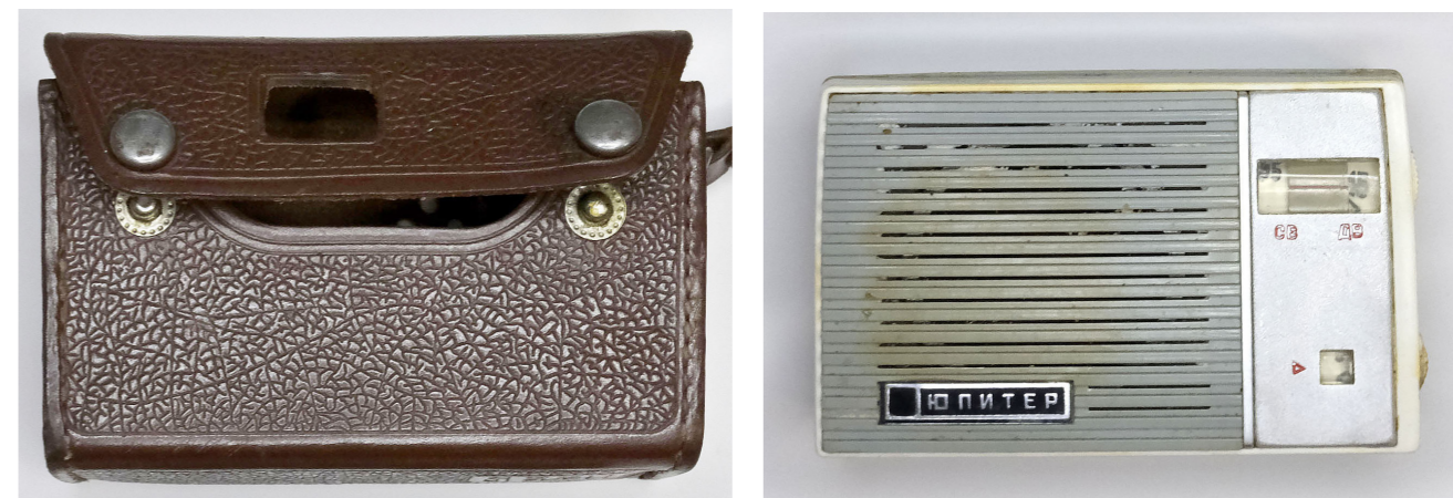
Рис. 13. Портативний радіоприймач IV класу «Юпітер». СРСР, УРСР, Дніпропетровськ, Дніпропетровський радіозавод, 1964 (НМІУ Р-1321)

У фондах НМІУ зберігається більш пізня модель – портативний радіоприймач «Юпітер». (Рис. 13) Під час додаткової атрибуції експоната вдалося з'ясувати, що його випуск було налагоджено у 1964 р. на Дніпропетровському радіозаводі 30 .