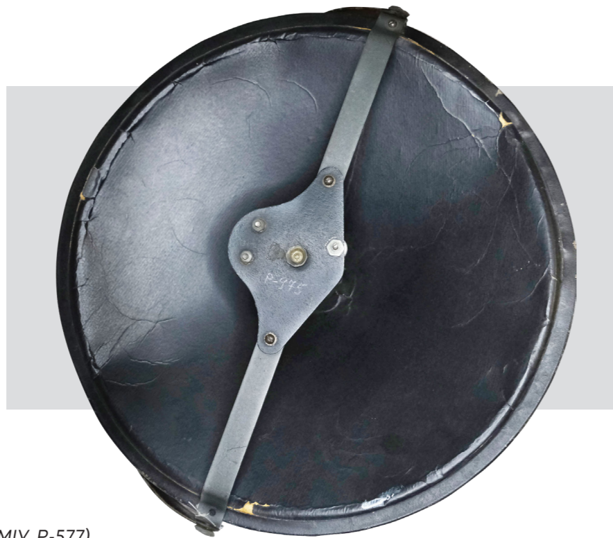
Рис. 7. Гучномовець. СРСР, Росія, Ленінград, 1940-і (НМІУ, P-577)

Для дротового радіомовлення найкраще підходили гучномовці. Встановлювалися вони переважно у центрах населених пунктів та місцях масового скупчення населення – біля колгоспних контор, клубів, шкіл, сільських рад тощо. Відповідно до технічної документації ці прилади зазначалися як абонентські гучномовці, проте в народі їх називали «репродукторами», «тарілками», а то й «брехунцями». Окрім агітаційної, розважальної та інформативної, «чорні тарілки» у роки Другої світової війни виконували ще одну важливу функцію – оборонну, попереджаючи населення про нальоти авіації противника. У фондах НМІУ зберігається кілька відповідних зразків, виробництва 1940-х – 1950-х рр. (Рис. 7)