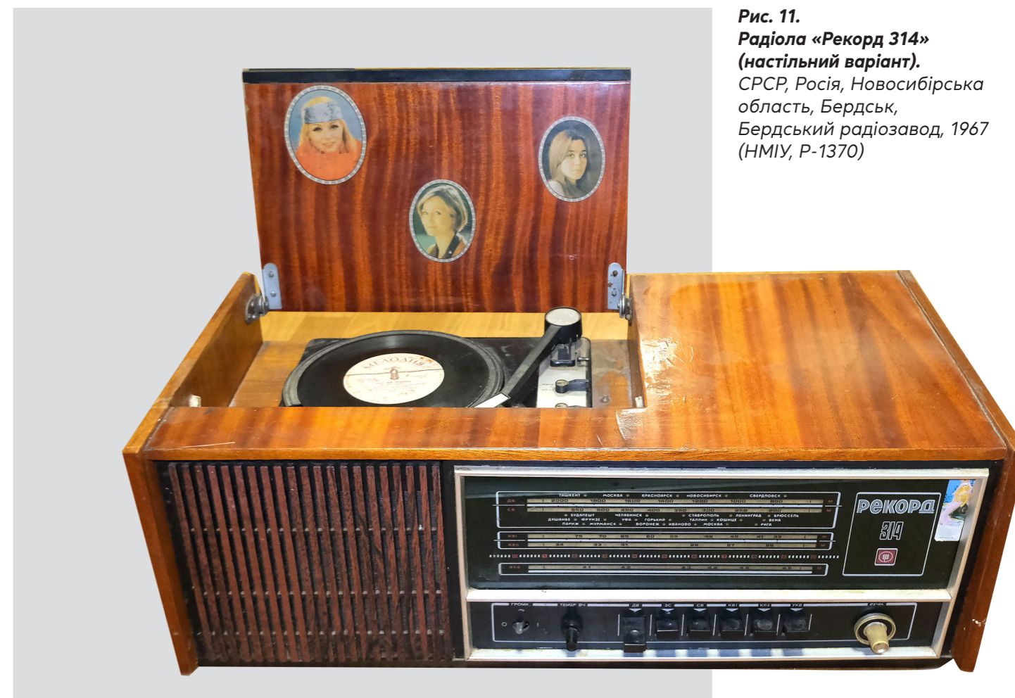
Рис. 11. Радіола «Рекорд 314» (настільний варіант). СРСР, Росія, Новосибірська область, Бердськ, Бердський радіозавод, 1967 (НМІУ, Р-1370)

Роздрібна ціна на подібні радіопристрої була достатньо високою. Так, після грошової реформи 1961 р. радіола «Харків» коштувала 87 карбованців 95 копійок, а «Весна» – 140 карбованців 25 . При цьому середня заробітна плата у Радянському Союзі у 1960 році становила 652,4 крб. (відповідно, після реформи 1961 р. – 65,2 крб.) 26 .