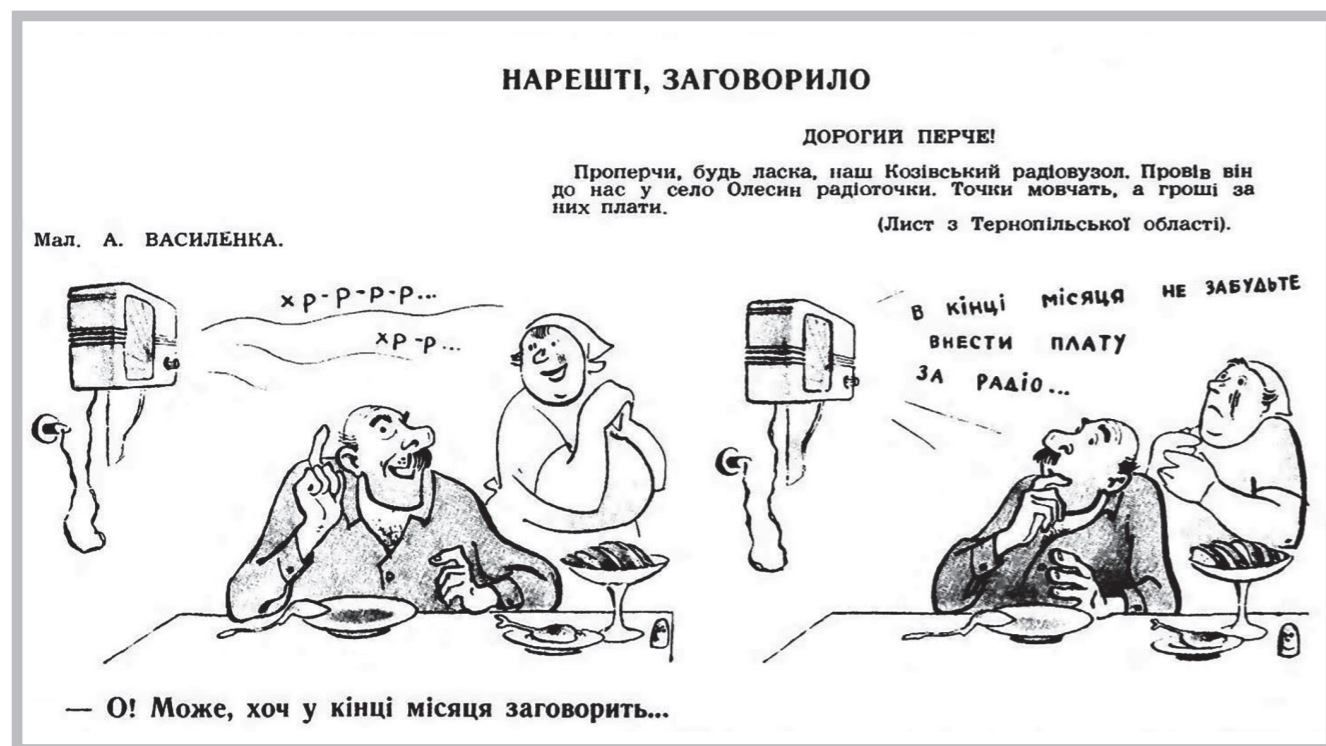
Рис. 12. Перець. № 6, 1961

бути встановлені в кожній хаті, а послуги так і не отримали 27 . Подібні листи до «Перця» надходили з усіх, без винятку, областей УРСР, що свідчило про масштаб проблеми. Значна кількість скарг до редакції журналу в 1950-х роках стосувалася також і поганої якості радіотрансляції. Подекуди «Перець» відгукувався на подібні скарги не лише публікаціями, а й карикатурами, як у випадку з листом з Тернопільської області. (Рис. 12) 28