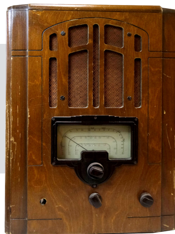
Рис. 6. Радіоприймач мережевий ламповий 6Н-1. СРСР, Росія, Воронеж, 1938–1941 (НМІУ, Р-229)

З тих же пропагандистських міркувань велике значення радіофікації країни надавали і в СРСР, а відтак – і в УРСР. У фондах Національного музею історії України зберігається кілька зразків радіоприймачів виробництва 1940-х – 1970-х років. Одним із найстаріших за часом виготовлення є апарат під фондним номером Р-229. ( Рис. 6 ) Це достатньо габаритний прилад, обшивка якого виготовлена з натурального дерева. На передній панелі є чотири ручки управління: верхня центральна слугує для перемикання частот, а нижні (зліва направо) – для відключення приладу від мережі, перемикання діапазонів та регулювання гучності.