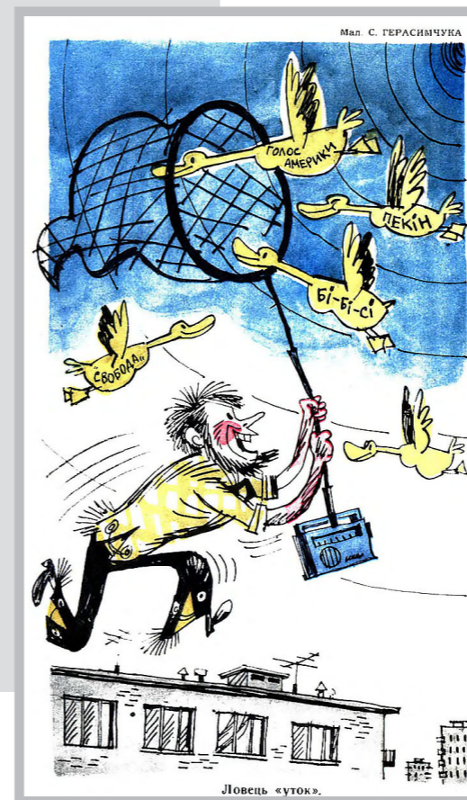
Рис. 15. Перець. 1967, № 17.

кової «Ластівки» та радіоли «Промінь» виробництва Дніпропетровського радіозаводу 37 . Також, ще з 1950-х років у журналі фігурувала тема тотального дефіциту (можна сказати – повної відсутності) сухих батарей для радіоприймачів 38 . Цікаво що, не зважа-