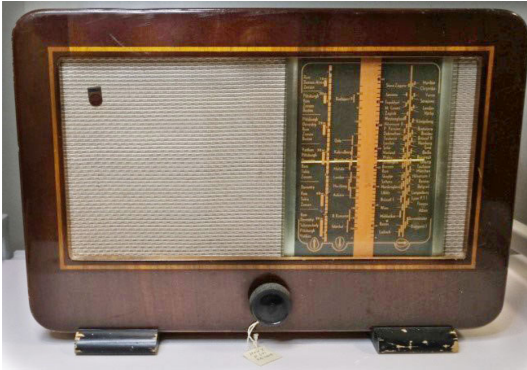
Рис. 8. Philips 661U. Бельгія, Левен, 1942–1943 (НМІУ, Р-341)

Британії. Музейний же екземпляр – Philips 661U під серійним номером 342212 – було зібрано у бельгійському місті Левен орієнтовно у 1942–1943 рр. 11 (Рис. 8) Це – настільна модель у дерев'яному корпусі з габаритами 42x29x18 см. На циферблат приймача нанесені назви різних міст Європи, поруч із якими вказані хвилі довгого, середнього та короткого діапазонів.