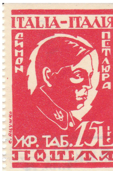
Рис. 9. Марка «Симон Петлюра. Укр. таб. пошта. Italia-Италія»

9. Марка негашена, зубкована. Назва: «Симон Петлюра.» Укр. таб. пошта. Italia-Италія». Італійська Республіка. Інвентарний № 2923/2. Книжковий друк у біло-червоних кольорах. Зображено портрет Симона Васильовича Петлюри (1879–1926) – українського державного, військового та політичного діяча, публіциста, літературного й театрального критика, організатора українських збройних сил, Генерального секретаря з військових справ при Генеральному секретаріаті Української Центральної Ради (28 червня – 3 грудня 1917), Головного отамана військ Української Народної Республіки (з листопада 1918); Голови Директорії УНР (9 травня 1919 – 10 листопада 1920). Написи: «Симон Петлюра», «Укр. таб. пошта», «Italia-Италія». Вказані ціна «15 Lire» та автор «С. Яцушко». Розмір марки: 5,1×3,4 см. (Рис. 9)