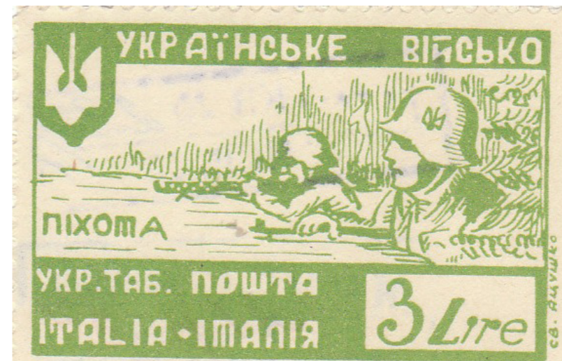
Рис. 11. Марка «Українське військо. Піхота в окопах. Укр. таб. пошта. Italia-Италія»

2. Марка негашена, зубкована. Назва: «Українське військо. Піхота в окопах.» Укр. таб. пошта. Italia-Италія». Італійська Республіка. Інвентарний № 2920/1. Друкована у біло-зелених кольорах. Зображено піхотинців українського війська в шоломах німецького зразка із тризубом, у одного в руках – німецький кулемет часів Другої світової війни MG 34, у другого – гвинтівка; зверху в лівому куті – тризуб. Написи: «Українське військо», «Піхота», «Укр. таб. пошта», «Italia-Италія». Вказані ціна «3 Lire» та автор «С. В. Яцушко». Розмір марки: 5,1×3,4 см. (Рис. 11)