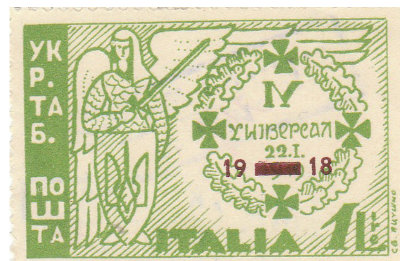
Рис. 12. Марка «IV Універсал 22.I.1918. Укр. таб. пошта. Italia-Италія»

Означена пропам'ятна марка видана до 28-річчя IV Універсалу Центральної Ради Української Народної Республіки, яким 22 січня 1918 р. було проголошено державну незалежність України. (Рис. 12)